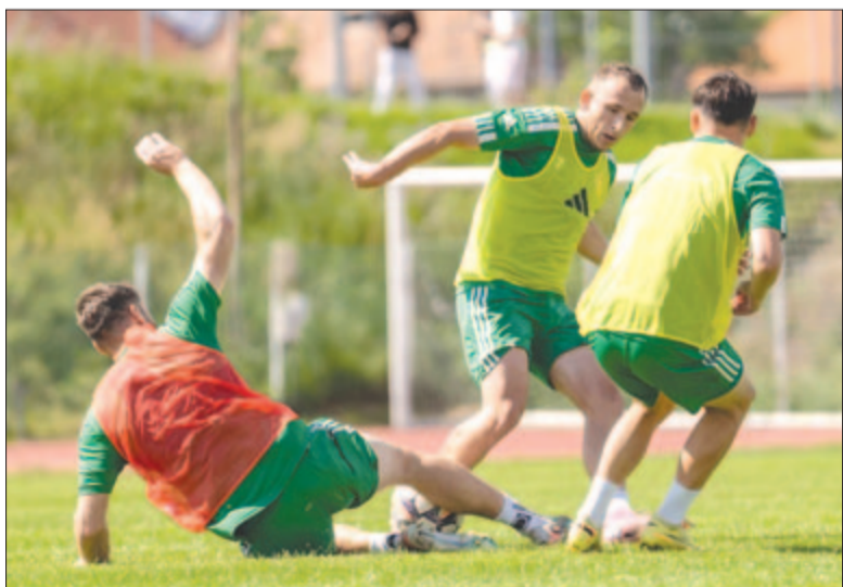
Egyelőre két érkezőről és egy távozóról tudni hivatalosan, de biztosan lesznek még, akik elhagyják a klubot