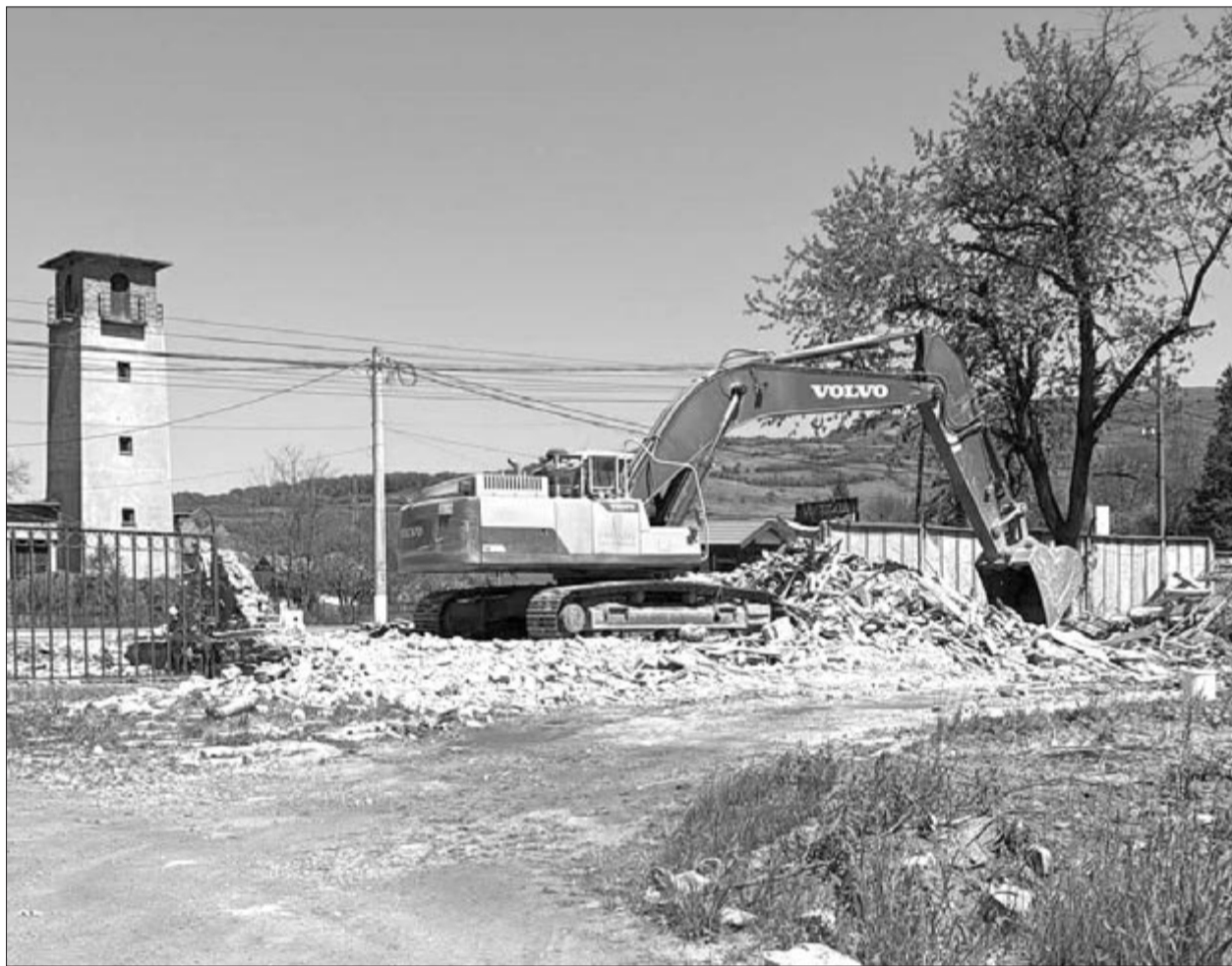
Jelenleg a tereprende-zés zajlik a leendő park helyszínén

Az Electrica tavaly december 18-án jelentette be a gyulakutai akkumulátoros energiátároló megépítését. A beruházás kivitelezője az ENEVO Group, a Prime Batteries Technology és a SIMTEL társaságában. Az Electrica közlése szerint ez a vállalat első „független” típusú beruházása, és nagy lépést jelent a társaság azon célkitűzése irányába, hogy elérje az 1 GWh teljesítményű energiátárolást. (GRL)