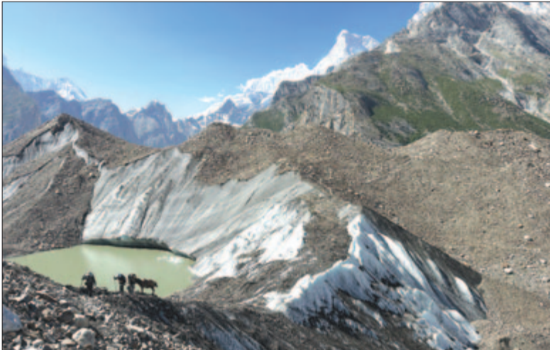
Kapaszkodás a gleccseren

A nagy trigonometrius felmérésben több neves személy is részt vett, többek közt George Everest