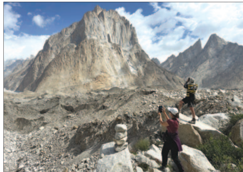
Örök fotótémák a hegyek

Csodás élményekkel, de kimerülve, 7 órányi túrázással érkezünk meg a 4285 méteren fekvő Goro II táborba. Ez volt az első éjszakánk, amelyet szó szerint a jégár hátán töltöttük a Baltoro- és a Biange-gleccserek összefolyásánál. Figyelmeztettek, hogy az éjszaka hűvös lesz, s bizony a karakorumi éj jeges lehelete már akkor megborzonga-