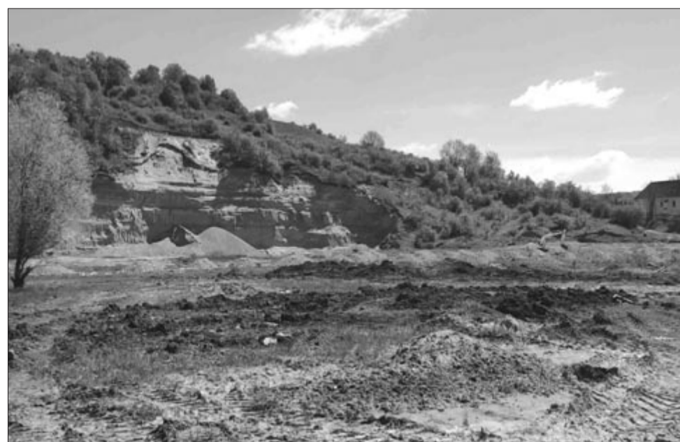
A helyszínt a közelmúltban előkészítették, már csak egy réteg termőtalaj szükséges az ültetés előtt

A kormány a 2022–2026-os időszakra szóló országos erdősítési programja keretében 56.700 hektár erdő telepítését és újratelepítését célozza meg, amit az országos újakezdési és rezilienciaprogram (PNRR) keretében finanszíroz, továbbá a következő húsz évre hektáronként évi 640 eurós kezelési támogatást is biztosít a kedvezményezetteknek.