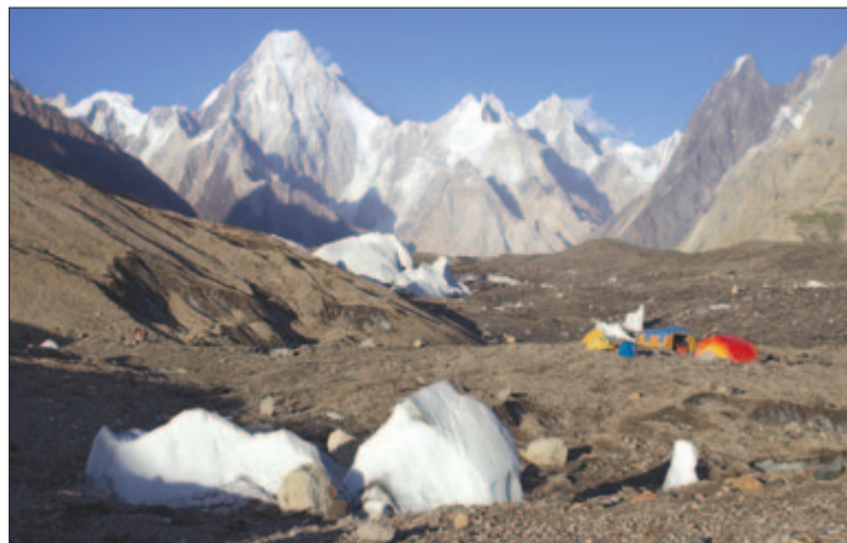
A Goro II tábor

tott, amikor a nap már csak erőtlen sugaraival kandikált ki az ormok mögül. Azon az éjszakán mindent magamra vettem, és úgy összekucorodtam hálósákomban, hogy az orrom sem látszott. Ameddig mi viszonylag kényelmes iglu sátrakban éjszakáztunk, addig segítőink egy rögtönzött ponyva alá bújtak. Csodáltam őket szívósságukért, kitartásukért, annál is inkább, mert ettől a ponttól kezdve bizony didergős, mínusz fokos éjszakákra számíthatunk.