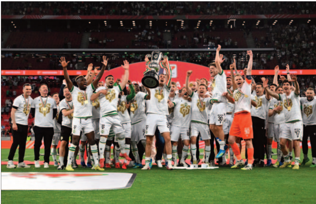
A győztes Ferencváros csapata ünnepel a kupával