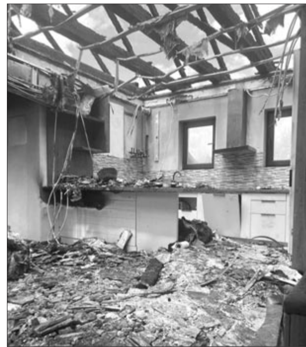
A paniti tűz következménye

A marosvásárhelyi tűzoltókat és a mezőpaniti önkéntes tűzoltókat pénteken, május 8-án délelőtt Mezőpanitba riasztották, ahol a Fő utcán egy lakóházban keletkezett tüzet oltottak el. A lángok mintegy 160 négyzetméteren tettek kárt a házban, szerencsére a tűz nem terjedt tovább – tájékoztatott a tűzoltóság sajtóosztálya. (pálosy)