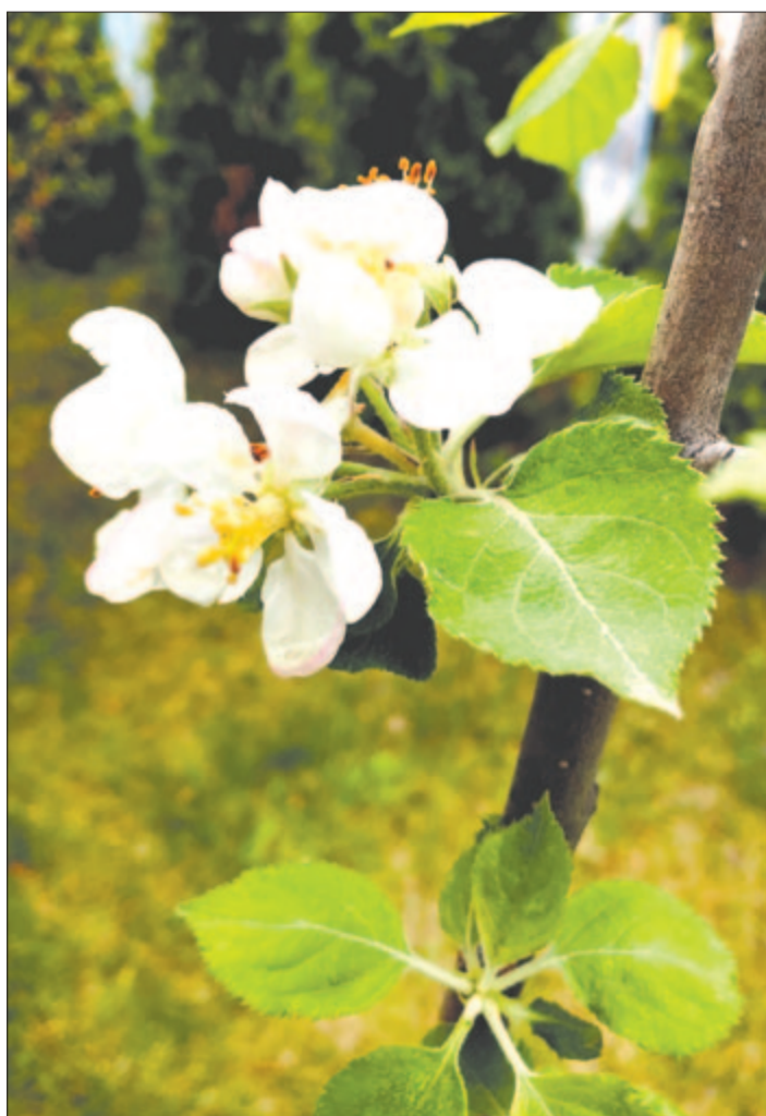
Bolyai-féle pónyikalmafa első virágai a Szentenderei Református Gimnázium előkertjében, 2019

Goethei csend. A lombon egy madár, alig lebeg, mint ez a német nyár,