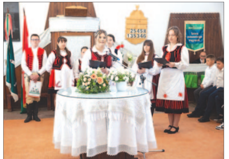
A templom a gyermekek és az ifjúság neveléséért is épült – hangzott el

A hálaadó ünnepséget a gyülekezet gyermekeinek előadása, a kórus szolgálata, illetve a holtmarosi dalkör előadása tette emlékezetesebbé.