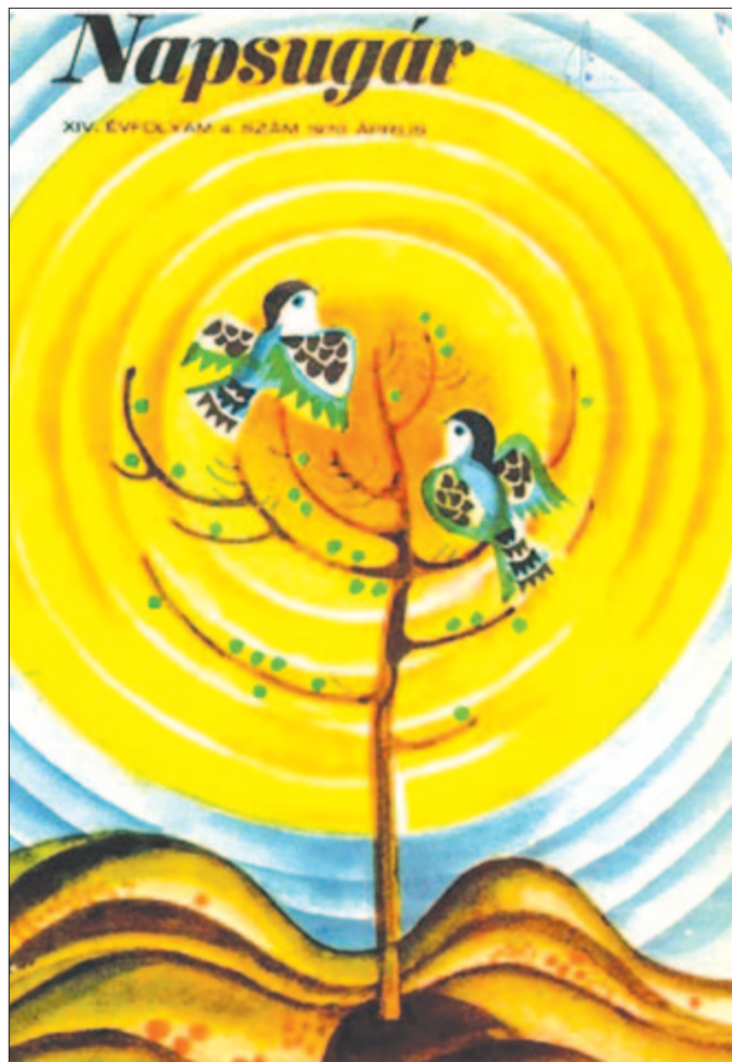
Napsugár, 1970. április – a havilap fedőlapja Deák Ferenc grafikája

melyet a szó, a lefordítható úgy rajzol most, hogy csak bent látható.