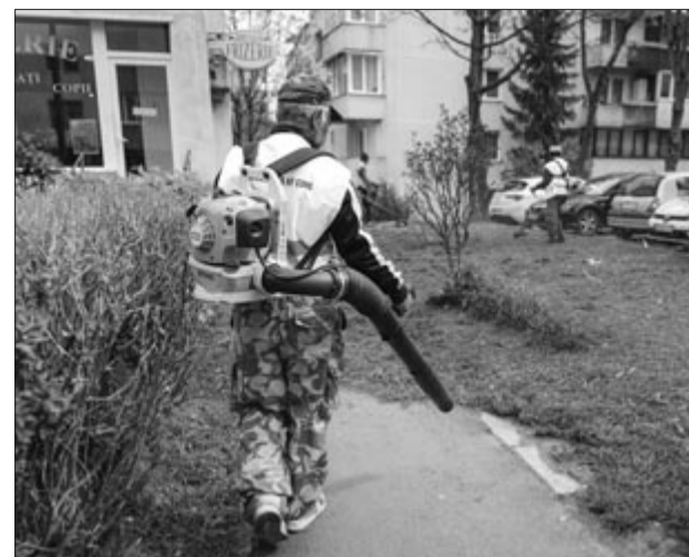
Víkendtelepen a kaszálás befejeződött, itt elsősorban a medencék környékét és a sétányokat tisztították meg. (sz. v.)

A város több pontján nyírják a fűvet. A munkálatok a Tudor Vladimirescu negyedben és a Szabadság utcai zöld területeken kezdődtek, a következő időszakban pedig a Budai Nagy Antal negyedben folytatódnak, majd fokozatosan eljutnak a város minden részére. A városban, illetve a