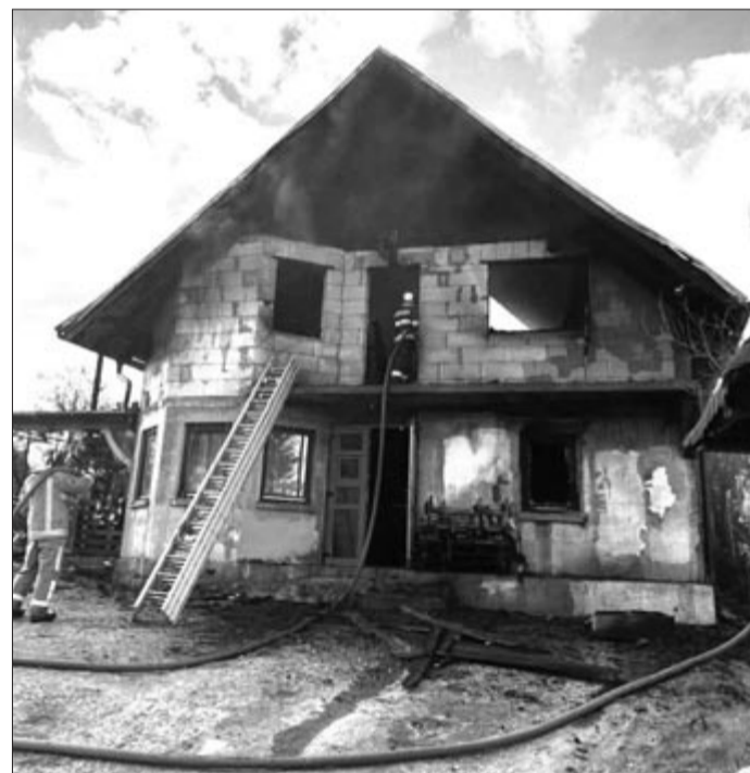
A tűzoltók a lángok továbbterjedését megakadályozták, de semmit nem tudtak megmenteni