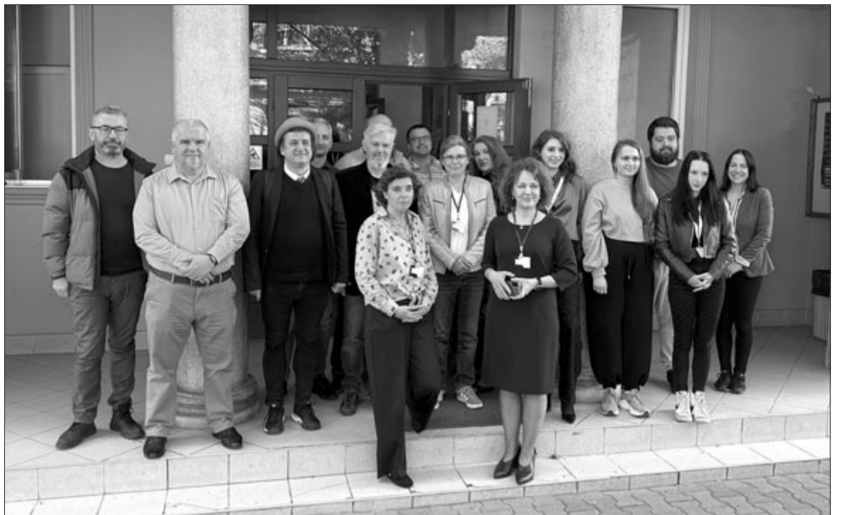
A konferencia szakmai stábjá

A nemzetközi médiatudományi konferenciának továbbá már évek óta szerves részét képezi a sajtófotópályázat díjkiosztója is. A pályázatra 11. és 12. osztályos diákok jelentkezését várják minden évben, az első díjasok pedig könnyített felvétellel nyerhetnek bejutást az egyetem audiovizuális kommunikáció, forgatókönyv- és reklámírás, média szakára. Az idei pályamunkák kapcsán dr. Jakab Tibor fotóművész, a Marosvásárhelyi Művészeti Egyetem oktatója elmondta, hogy nagyon jó minőségű anyagok érkeztek, a minőség fejlődése pedig egy évek óta megfigyelhető tendencia. Látszik, hogy a pályázók készülnek, tudatosan és figyelmesen készítik a képsorokat, fogalmazott a fotóművész, aki azt is elárulta, hogy a pályázatok között olyanok is voltak, amelyek akár egy kitalált, megrendezett képsorból álltak, amely egy sztorit bemutat. Nem mellesleg a fotópályázat szabályza-