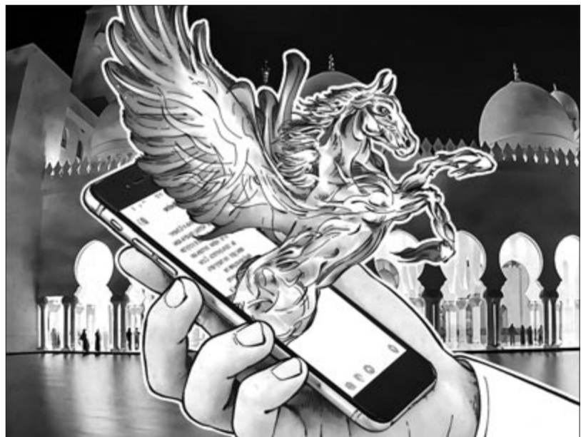
Pegasus kémprogram, illusztráció

nem szól mindenkinek, és aki aktiválja, az a telefonja bizonyos funkcióinak részben vagy teljesen búcsút inthet. Fontos az adataink védelme, és ez mindenkire érvényes, fontos viszont, hogy vannak olyan funkciók, biztonságot nyújtó szoftverek, amelyek nem szólnak az átlagos felhasználóknak. Az iOS zárt módja ilyen, viszont bőven vannak olyanok, akiknek ténylegesen hasznos lehet ez a bizonyítottan jól működő funkció.