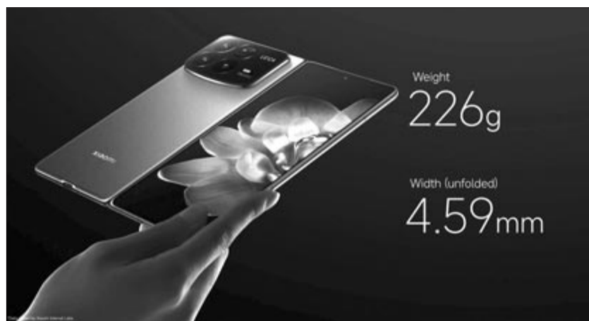
Xiaomi Mix Fold 4, illusztráció