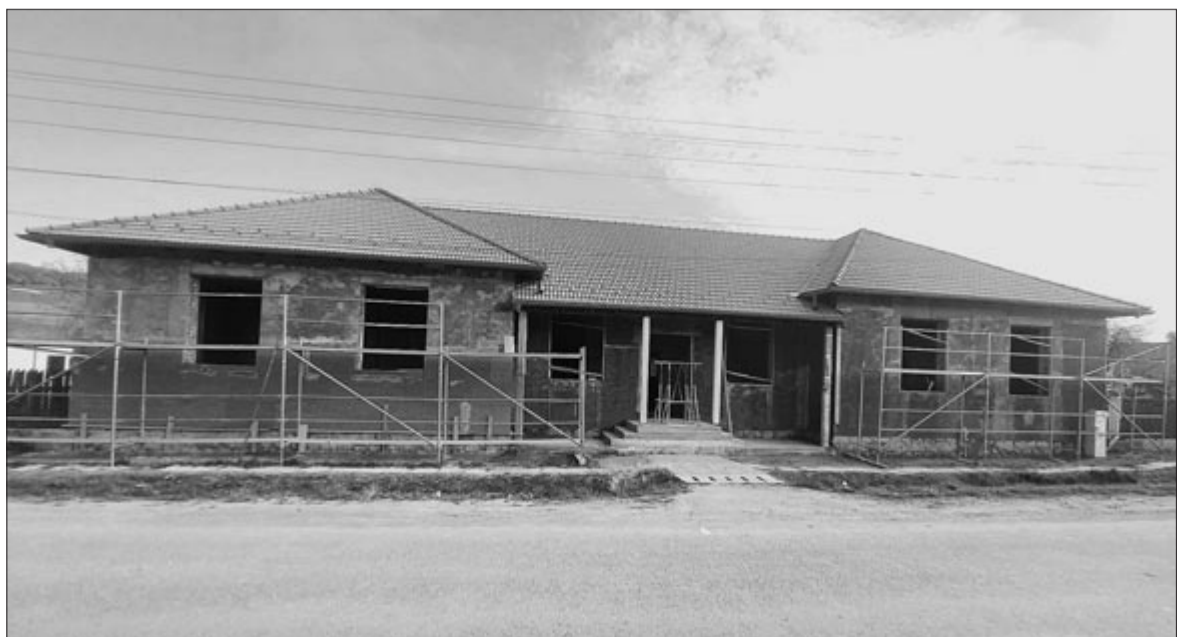
Az új kivitelező jó munkát végez, szépen halad

azt ígérte, hogy visszaperelik az új közbeszerzés költségeit. Ezért írásos felszólítást küldtek a vállalkozónak, amiben kérték, hogy fizesse vissza a második közbeszerzés költségét (35.000 lej+héa), másképp bírósághoz fordulnak, s ez további költségekkel fog jární a vesztes fél számára. Meglepő módon a cégvezető megígérte, hogy mindent kifizet még azelőtt, mielőtt az ügy az igazságszolgáltatás elé kerülne.