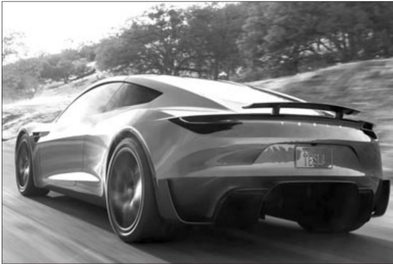
Tesla Roadster, a második generáció koncepciója, illusztráció

A múlt év végén, az idei év elején még azt közölték, hogy április elsején végre-valahára bemutatják a Roadster második generációját. Ez nem történt meg, mondjuk ezen egyrészt nem lepődünk meg, másrészt nem a hónap első napján jött a bejelentés a bemutató elhalasztásáról, hanem még március vége felé. Akkor közzétettek egy bejegyzést az X közösségi médiás oldalon, ahol azt írták, hogy „valószínűleg április végén” lesz a be-