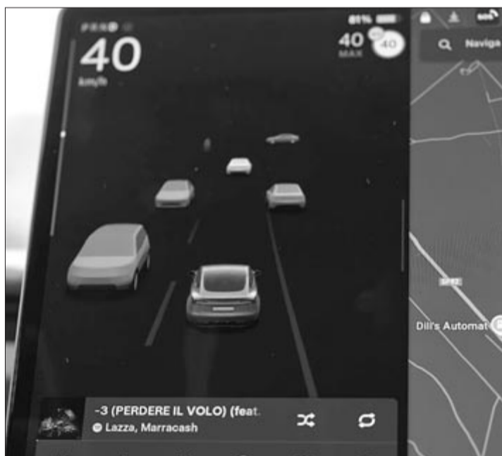
Tesla FSD, illusztráció

A Tesla-féle Full Self-Driving korábban olyan országokban kapta meg az engedélyt, mint az Amerikai Egyesült Államok, Ausztrália és Kína. Mindazonáltal a holland engedély csak arra ad lehetőséget, hogy emberi felügyelet mellett működhessen a rendszer. Mondjuk, ahogy a közelmúltban is láthattuk, ez korántsem biztosíték arra, hogy nem lesz probléma a működésével.