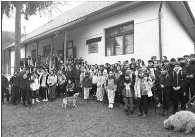
Idén 130 marosvásárhelyi indult neki a Székelybő és Jobbágyfalva közötti távnak

A tizenkilencedik alkalommal megszervezett gyalogtúra ezúttal Székelybő és Jobbágyfalva között zajlott, mintegy 14 kilométeren. Előtte a rendezvény egyik partnere, a Székelybő-