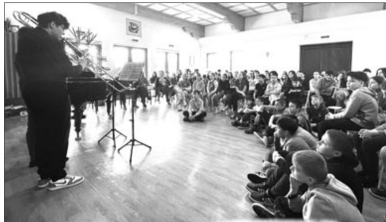
Marosvásárhelyi fiatal tehetségek adtak elő klasszikus zeneműveket