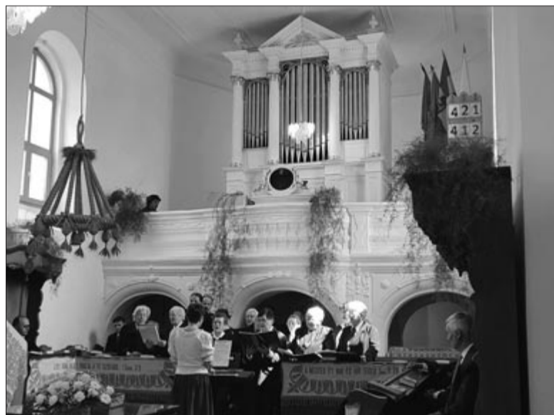
Ünnepelt a backamadarasi gyülekezet: nemcsak a kórusa, hanem már az orgonája is megszólal a templomban