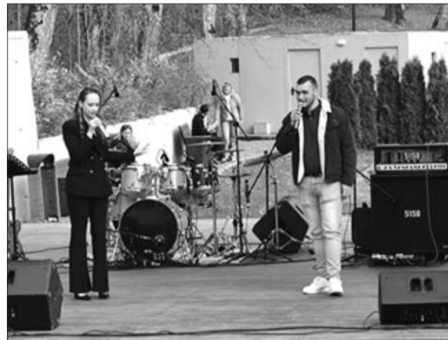
Több százan vettek részt a koncerten, és adományoztak a beteg személyi műtétjére