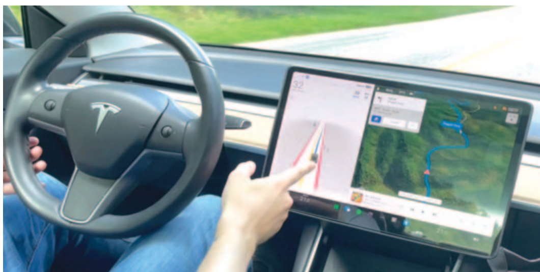
A Tesla önvezető rendszere, illusztráció