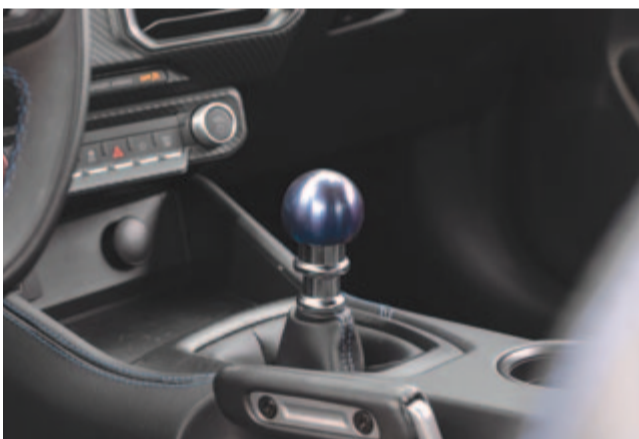
Manuális váltó, illusztráció

A vezérigazgató azt is elárulta, hogy a vásárlói kereslet is megerősíti, hogy megéri a kézi váltó fejlesztésével járó többletköltségeket bevállalni. Jim Farley hisz abban, hogy a For-