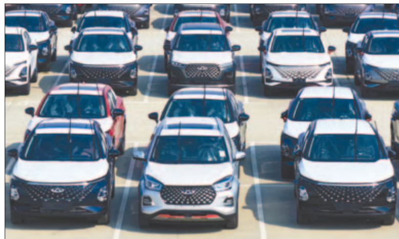
Kínai autók, illusztráció