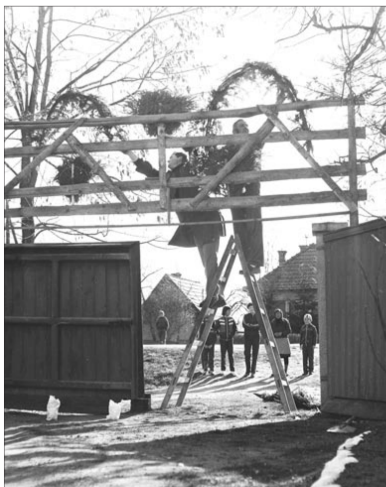
Készül a húsvéti kapudisz Gernyeszegen 1987-ben