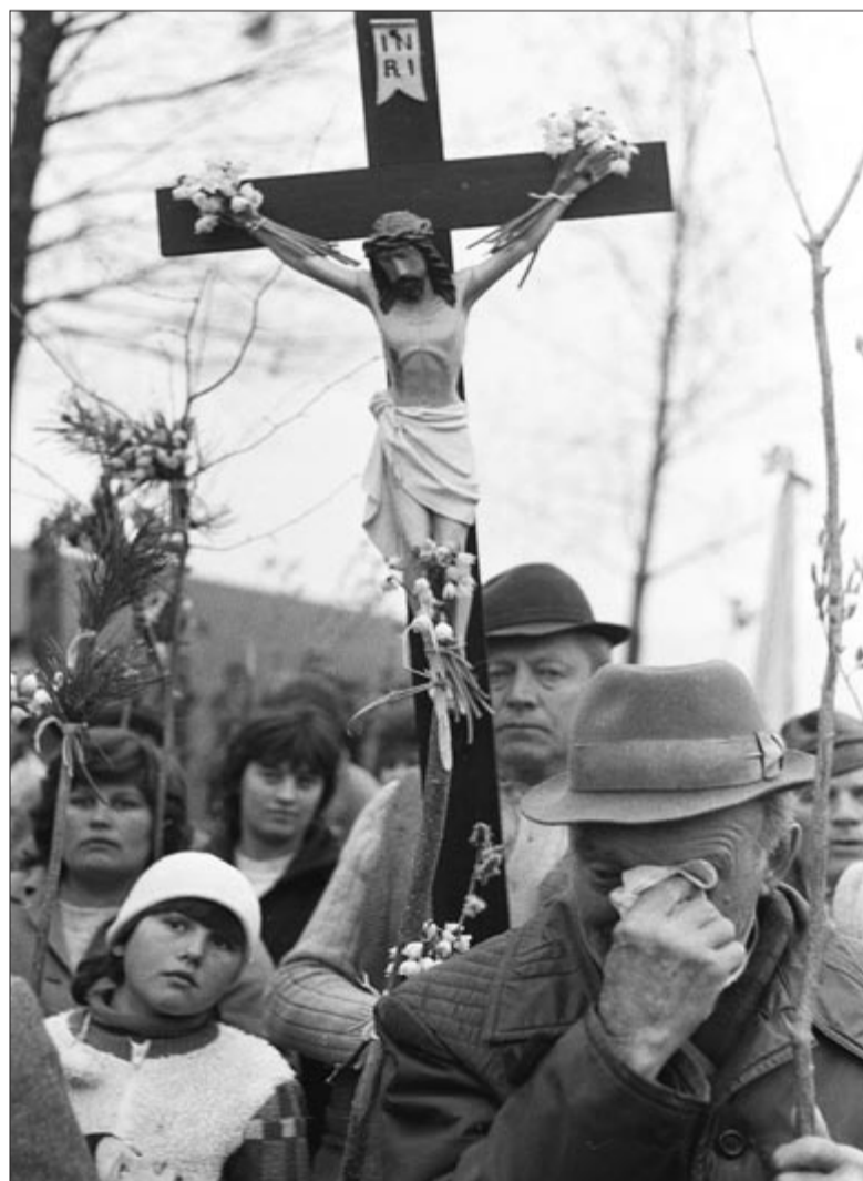
Nyárádremetei határkerülés 1991-ben

Szerintük igazi lelki feltöltődés a határkerülés, s enélkül elképzelhetetlen számukra a húsvét, ahogyan a közsvényesiek szerint sincs húsvét határkerülés nélkül.