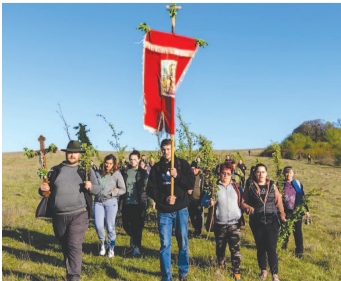
A közsvényesiek fonott vesszőkkel térnek haza a határból

A határkerülést reggel kilenc óra körül be kell fejezni, vissza kell térni a faluba, ahol zúgó harangokkal, zászlókkal s az otthon maradtakkal várja őket a plébános. Mivel a temp-