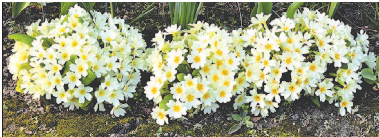
Törpe kankalin virághabzása a Szigethegység mészköleitőin

kiragyog mind mi tovatűnt egy hársfalevélen remegő cseppből, vagy gyöngy már? Félőruilt gyémánttá – gömbbé verte a pofozó idő? Izzik szikrázó mélyén