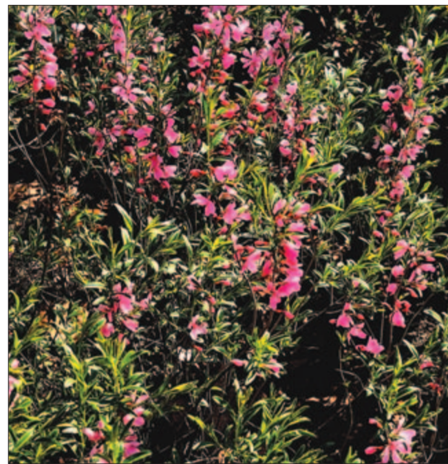
A húsvét kárminpiros törpemandula fátylát libbenti az Erdélyi Mezőség dombperemeire