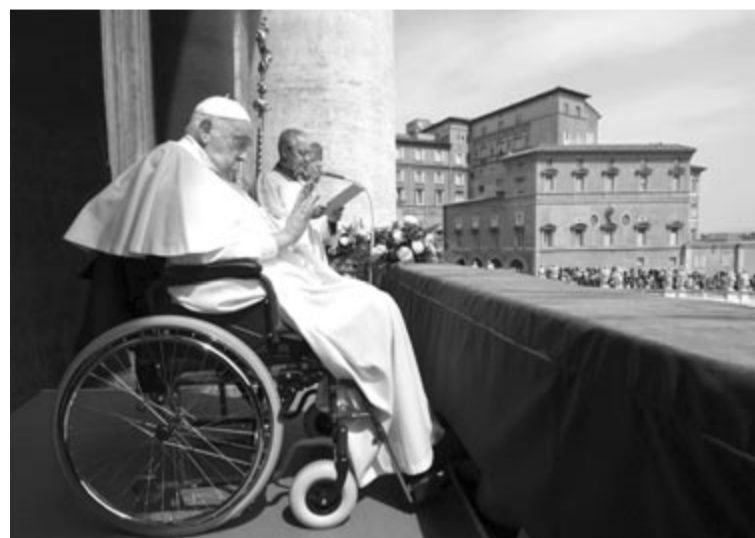
Ferenc pápa utolsó húsvétja

Hétfőn a pápa rövid beszédet mond a Regina Coeli (Mennyek királynője) imádsággal egybekötve, mint ismeretes tavaly, húsvéthétfőn hunyt el Ferenc pápa, akkor ugyanez a nap április 21-re esett. (MTI)