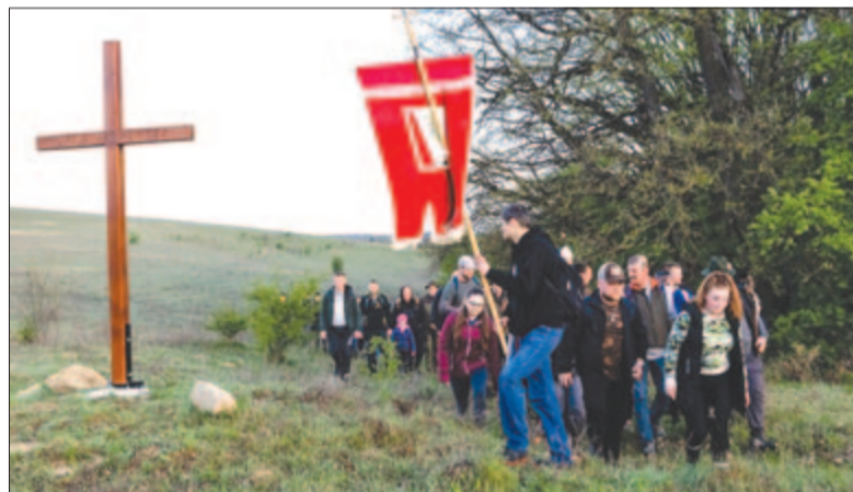
A közsvényesiek új keresztet is állítanak, és a határkerülés részeként felkeresik őket