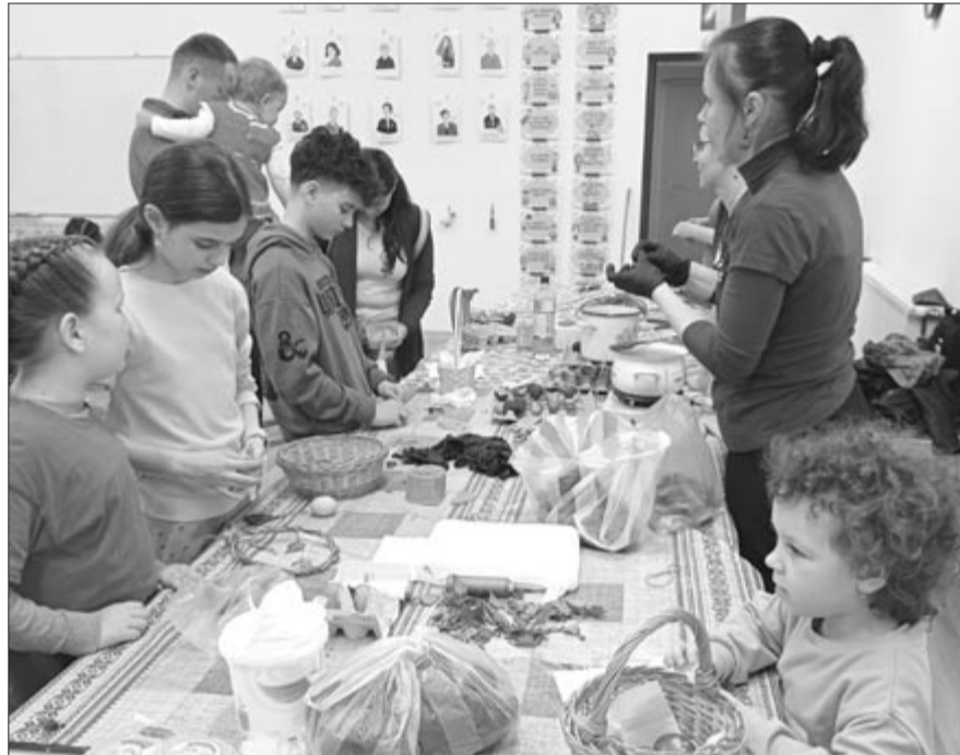
Szovátán minden jeles ünnephez kapcsolódóan szerveznek tematikus alkalmakat, kézműves-foglalkozásokat

Örvendetes, hogy az ünnep előtti rohanásban, sürgés-forgásban vannak helyek, ahol még időt szakítanak az emberek arra, hogy szívben-lélekből hangolódjanak a következő napokra, s azt sem az otthon magányában tesszik, hanem közösségekben.