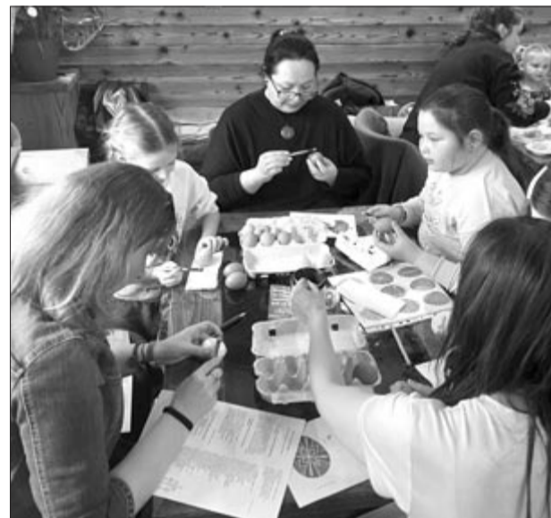
Nyárádszeredában kicsik-nagyok kíváncsiak voltak a tojásírásra