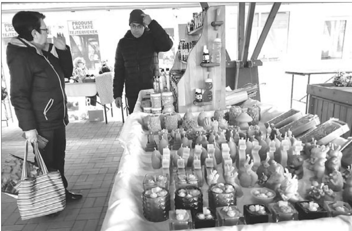
Ezúttal árus és vásárló is kevesebb volt, de aki vásárolni akart, talált magának való termékeket

A vásár kora délután zárult, de mielőtt delet harangoztak volna, a vásárlátogatókat a helyi Tücsökraj népi zenekar derítette jobb kedvre. A szervező polgármesteri hivataltól megtudtuk: idén két tucat árus, kézműves igényelt asztalt a vásárra, udvarhelyszékiek, szovátaiak, valamint termékeikkel a Kis-Küküllő és a Nyáradmentéről érkezők.