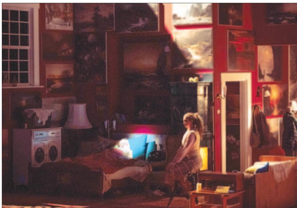
Ház a blokkok között