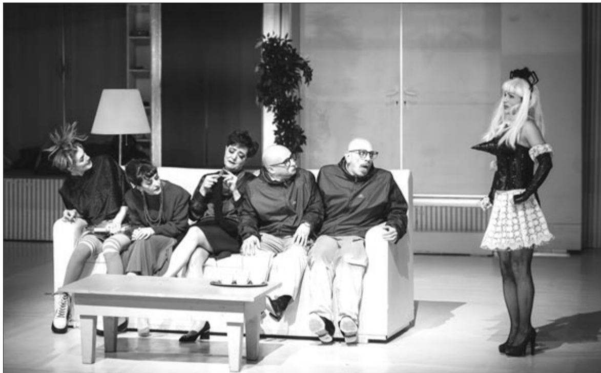
Fotó az Egy római tragédia című előadásból

Megerősödve a bortól, kimehettem a többi gyerek közé, rúgni a rongylabdát – mert akkor még a bőrlabda ritka volt, s ha lett is volna, az ára igen nagy volt.