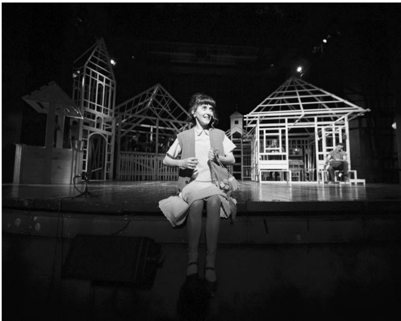
Az igazság gyertyái

Valahol itt van közel a pokol, lángjai lobognak láthatatlanul. És fel-felsírnak a kemény kövek imbolygó, nesztelen lábam alatt.