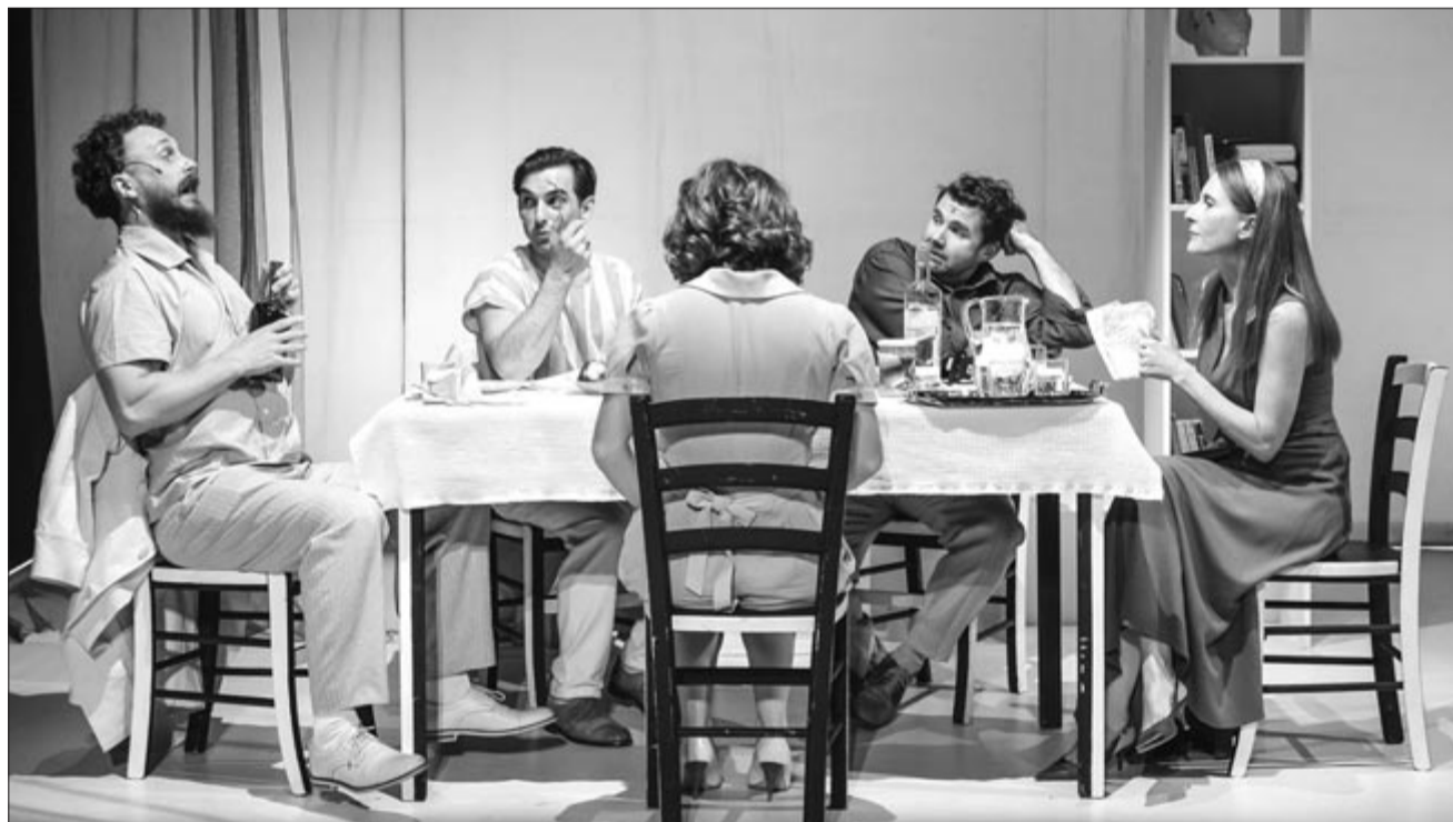
Fotó A nap gyermekei című előadásból