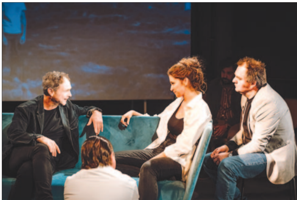
Én nem tudok versben hazudni

Nagyterem. Az előadás 16 éven felülieknek ajánlott, időtartama 2 óra 30 perc (két szünettel).