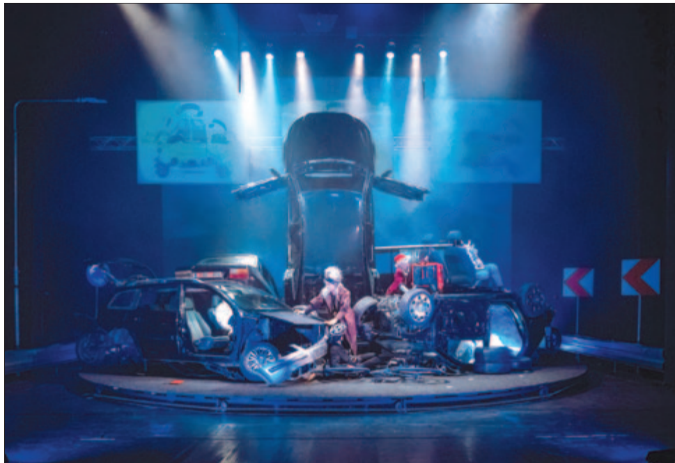
Emberk és istenek