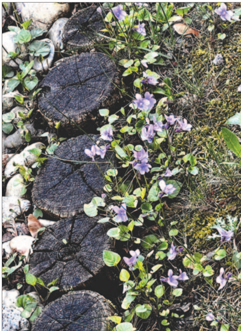
Rönkök vénsége, ibolyák frissessége