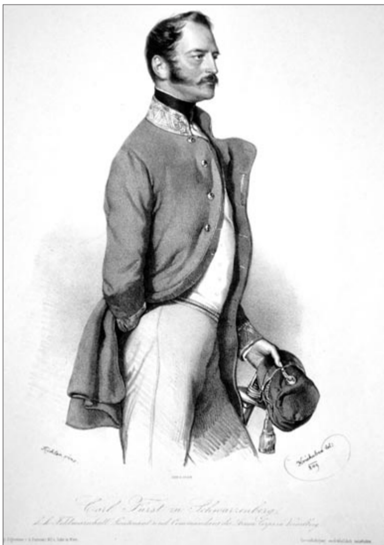
Karl Philipp zu Schwarzenberg kormányzó

Az öreg úr nagy szemeket vetett rám s szobámba lépve, halkan mondá: »Maga bizony jó. Segítsen maga is, hogy takarjuk el koszosrukkal azt az oda akasztott professort, hogy ő Felsége ne lássa meg.«