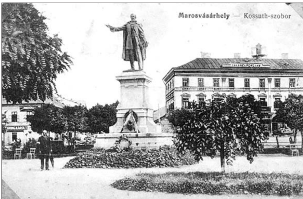
A kormányzót és Ferenc József császárt a Görög-házban (a képen jobbra) látták vendégül 1852-ben