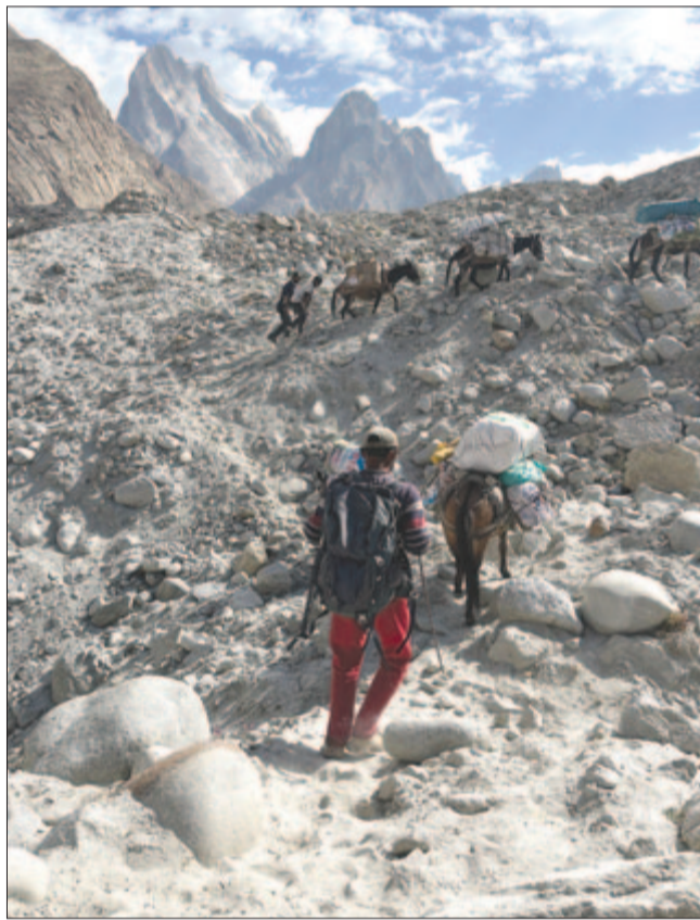
Kapaszkodunk a Baltoro-gleccser homlokmorénáján

És egyszer csak ott álltunk annak a hatalmas valaminek az aljában, s akkor bizonyosodhattunk meg arról, amiről nyilván már tudtuk elméletileg, hogy a kolosszális fal nem más, mint egy gigagleccser végső szakasza. Ez egy válaszfal volt számunkra, nem csupán fizikai értelemben, és nem csak ezen az úton, hanem felfoghatom életünk egyik fontos választóvona-