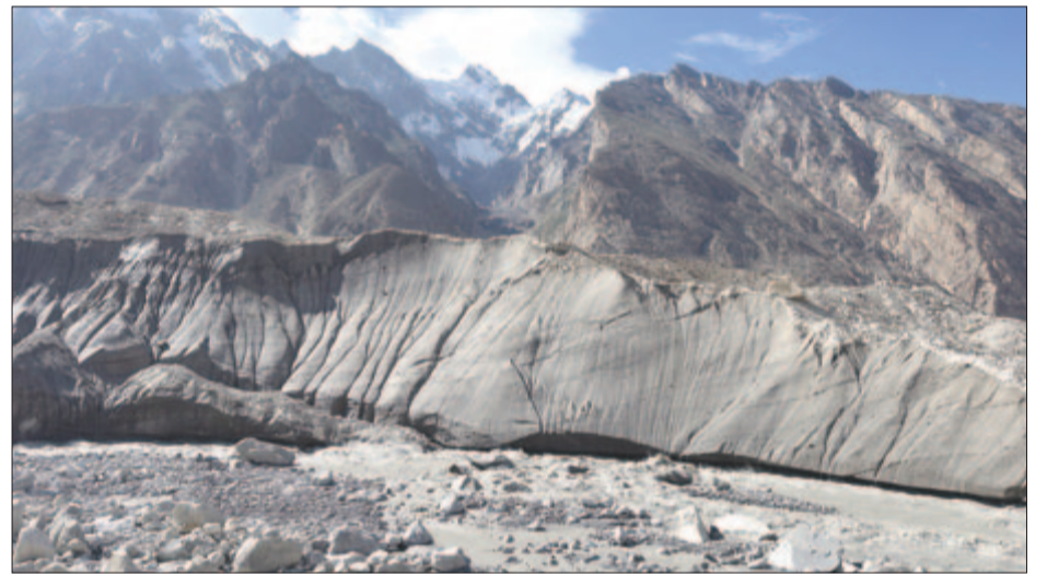
Ahol a Braldut folyó születik

használnak a pásztorok és a természetjárók, hanem mindig új utat kell találni, hiszen a jégár arcúata szezonról szezonra, viszonylag rövid idő alatt is változhat. Ezért a Karakorumban szó szerint úttörőnek kell lenni, mert az az ösvénynek nevezett csapás, amelyet korábban használtak, a gleccser mozgása, illetve a tavaszi áradások következtében tönkre mehet, újabb lehetőségeket kell keresni, s ez még a helyi guide-oknak is kihívást, sok veszélyt jelent. S mivel nincsen jól kitaposott ösvény, ami van is, az a poros, gurulóköves labilitás miatt megkeseríti az odavetődő vándorok életét. A kövek könnyedén billennek, a kavicsos, homokos talajon könnyen meg lehet csúszni, félre lehet lépni, s ebben a magasságban, többnapos járásra az első egészségügyi intézménytől egy félresikerült lépés, egy banális bokaficam a túra végét és sürgősségi, helikopteres mentést jelenthet a figyelmetlen és szerencsétlen túrázóknak. Az ember csak hajlékony nádszál, koponyája csak egy törékeny pohár ezen az elhagyatott he-