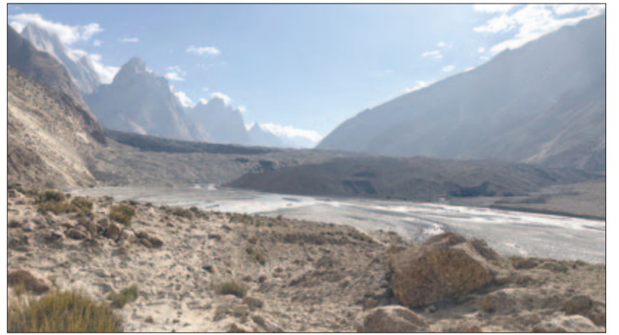
Feltűnik a Baltoro-gleccser falszerű képződménye

Nekivágtunk. Már az első kapaszkodón kiköptük a lelkünket, hiszen a gleccser hátára kellett felkapaszkodnunk azon a kaptatón, amelyet távolról egy gigantikus falnak néztünk, s amely nem volt más, mint ennek a Balaton nagyságú jégfolyónak a végmorénája, más néven homlokmorénája. Ekkor szembesültünk azzal, hogy a gleccser háta a morénáknak köszönhetően dimbes-dombos, felülete hatalmas guruló kövekkel, szikladarabokkal borított, és ezek mind nagyon mozgékonyak, bármikor megadhatják magukat a gravitációnak, elindulhatnak, gurulhatnak, és mindent elsodorhatnak, ami az útjukba kerül. E guruló kövek között kellett úgy lavíroznunk, hogy a súlyos „tekegolyók” útjában ne mi legyünk a ledöntött „bábuk”. Ráadásul nem csupán a kövek vannak állandó mozgásban, hanem – mint ismert – a gleccserek mint „élő” képződmények, lassan, de folyamatosan mozognak, azaz csúsznak lefelé, naponta átlagosan 1-2 métert is, mint egy nagy, lomha, ráérős folyó, vagy mint egy nagyon viszkózus méz, amelyet ki szeretnénk tölteni az edényből. A gleccser mozgása viszont nagyban befolyásolja annak felszínét, állandóan változtatva azt. Ezért, szemben az általunk megszokott hegyi túraútvonalakkal, a gleccser hátán nincsen jól kitaposott és bejárt ösvény, amelyet évtizedek, esetleg századok óta