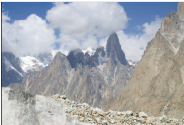
A 6417 méteres Uli Biaho felhőkarcoló tornya

zsákutca, mert a túloldalán gleccserhasadék vagy olvadékvíz táplálta tengerszem állta útunkat. Ilyen esetekben irányt kellett változtatnunk, és vezetőink más alternatívát kerestek, elsősorban tapasztalataikra, de főleg ösztönös megérzéseikre hagyatkozva. Ez az össze-vissza csúszkálás, törmeleken való csúszkálás nagyon kimerítő, ráadásul paradox módon a hegy és maga a gleccser olykor inkább sivatagnak tűnt. Hiába volt lábaink alatt a Románia ivóvízminőségét évekre fedező, irtatlan nagy, fagyott víztartó, a rekkenő hőség és a tűző nap nagyon próbára tett, és inkább sivatagi túrához tette hasonlatossá előrehaladásunkat, mintsem az általam Erdélyben megszokott kellemes kiránduláshoz.