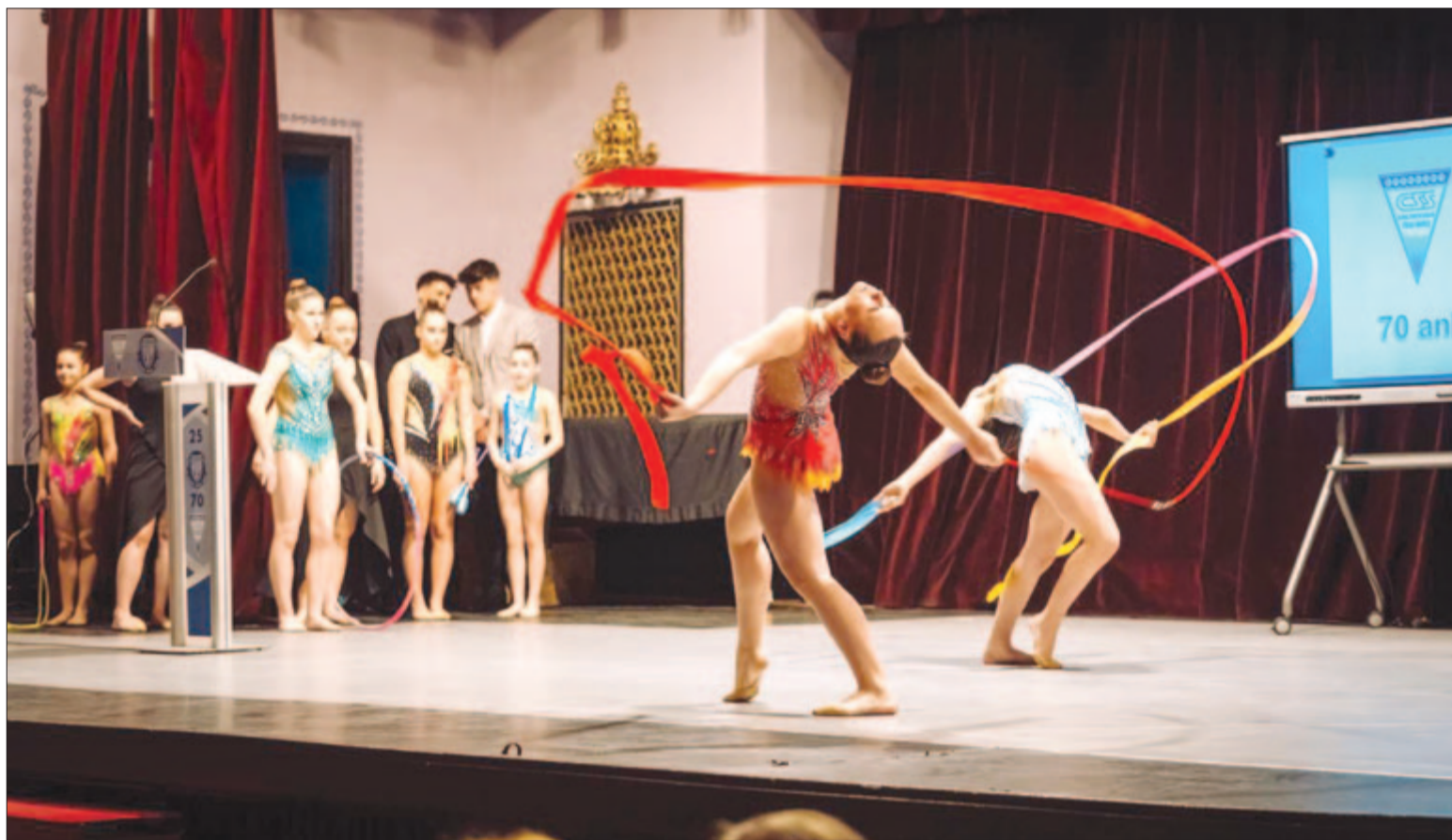
A Szász Adalbert Sportliceum ritmikus gimnasztika csapata