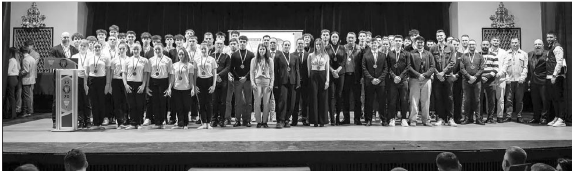
Az elmúlt évek legeredményesebb sportolói

A jubileumi ünnepséget a Szász Adalbert Sportlíceum ritmikus gimnasztika csapatának látványos bemutatója tette még emlékezetesebbé. A rendezvény állófogadással zárult.