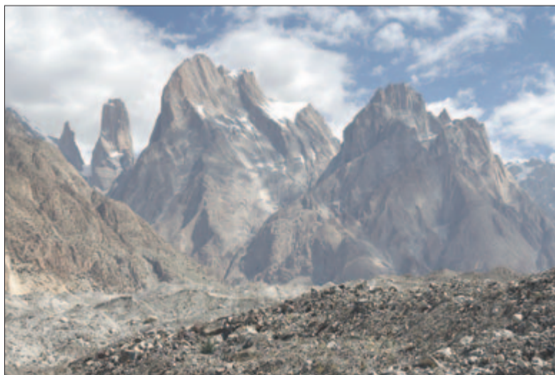
A 6000 méter fölé magasodó Trango-tornyok

laként is, hiszen Földünknek egy olyan különleges szegletébe érkeztünk, amelyet korábban csak földrajzi atlaszok lapjain tanulmányozhattunk. Megsemmissülve hunyorogtunk a „falra”, és megilletődve kopogtattunk a Baltoro-gleccser kapuján, a világ egyik legnagyobb gleccserrégiójában.