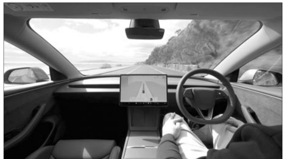
Tesla Full Self-Driving, FSD, illusztráció

De térjünk vissza a jelenbe, hiszen zajlik a vizsgálat a Tesla ellen. A gyártó 8313 baleseti felvétel részletes idővonalát kellene átadja a hatóságoknak, a vállalat viszont eddig többször is halasztást kért, arra hivatkozva, hogy naponta csak korlátozott számú esetet tudnak feloldozni. Ez az újabb videó viszont felerősítheti azokat a hangokat, amelyek szerint az FSD a jelenlegi formájában nem tud minden közlekedési helyzetet megfelelően kezelni. Ahogyan az is aggasztó, hogy a hatóság több mint 8000 baleseti felvétel részletes idővonalát kéri, ez azt is jelenti, hogy ennyi kisebb-nagyobb balesetet mindenképpen okozott az FSD rendszer, ami azért nem kimondottan növeli a bizalmat a szoftverrel szemben, hogy finoman fogalmazzunk. Érdekes lesz majd azt megnézni, hogy a hatóság milyen következtetéseket fog levonni az adatokból, már azt követően, hogy a Tesla átadja a kért információkat.