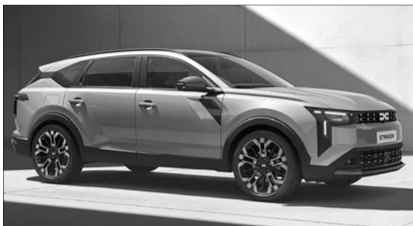
Dacia Striker, illusztráció