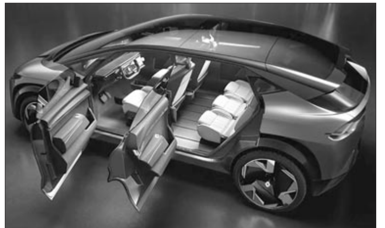
Renault R-Space Lab tanulmányautó, illusztráció

Az alapváltozatok mellett érkeznek egy kéttonnás vontatási kapacitású összkerekes változat, valamint egy hatótáv-növelős kivitel is, amelynek hatótávolsága eléri majd az 1400 kilométert.