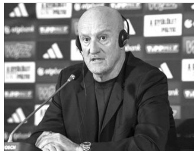
Marco Rossi szövetségi kapitány a szlovének és görögök elleni felkészülési mérkőzésre készülő magyar labdarúgó-válogatott keretének kihirdetésén az MLSZ telki edzőközpontjában 2026. március 17-én.

A hálór és a csatár meg nem nevezett sérülés, a védő vádlihúzódás miatt nem áll rendelkezésre.