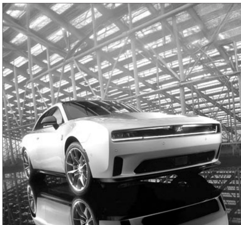
Dodge Charger Daytona, az elektromos Charger, amely nem aratott sikert

Tagadhatatlan, hogy nagyon fontos a zöldátállás, fontos tenni a környezet védelme érdekében, hiszen, ha tetszik, ha nem, a bőrünkön érezzük az éghajlatváltozást és a globális felmelegedést. Ennek a jeleiért nem kell a szomszédba menni, elég a Romániában is tapasztalható árvizekre gondolni, vagy arra, hogy a tél lényegében egy-két hetet tartott, ez pedig nemcsak az idei szezonban volt így. 15-20 éve még egyáltalán nem volt ritka a hatalmas hó Marosvásárhelyen, a kisebb utcákban szánkóztak a gyermekek. Mostanra azonban csak az eső maradt, a hóhatár jó 60 kilométerrel fennebb húzódott, a Bucsin környékére. Tehát a környezetért tenni kell, viszont ezzel együtt nem lenne szabad veszni hagyni a kultuszokat.