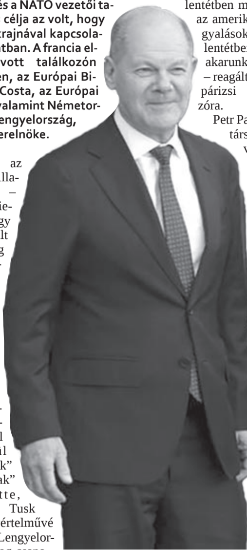
Emmanuel Macron francia elnök (j) fogadja Olaf Scholz német kancellárt az EU-tagországok vezetőinek informális biztossági csúcstalálkozója előtt a párizsi államfői rezidencián, az Elysée-palotában 2025. február 17-én.

Petr Pavel cseh köztársasági elnök vasárnap a közszolgálati Cseh Televízióban kijelentette, hogy Európának ott kell lennie a háború befejezésé-