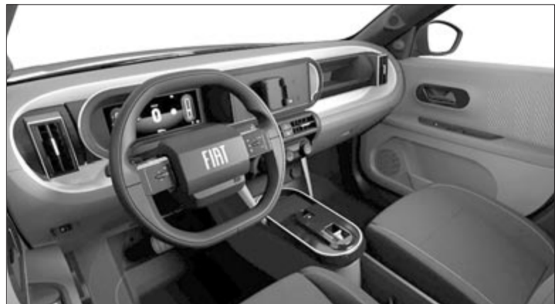
Fiat Grande Panda-beltér, a kijelző helyett felszerelt fekete műanyagdarab a telefontartóval

Egyelőre nem sok mindent tudunk az újdonságról, mindössze annyit árultak el róla, hogy a motortérben egy háromliteres, sorshatos, dupla turbós motor dolgozik, ami elérhető lesz 420 és 550 lóerővel is. A Dodge Charger Sixpackhez opcionálisan elérhető lesz az összerúghajtás, valamint – az elektromos változatához hasonlóan – rendelhető lesz két- vagy négyajtós kivitelben.