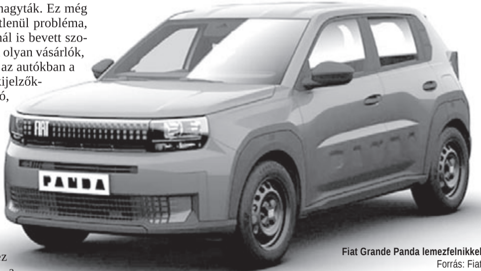
Fiat Grande Panda lemezfelnyikkel

annak fényében, hogy a Fiat Grande Panda egyáltalán nem nevezhető olcsónak, Olaszországban több mint 5000 euróval kerül többé a fapados változat, mint a Dacia Sandero Stepway. Természetesen a Dacia sem arról híres, hogy pré-