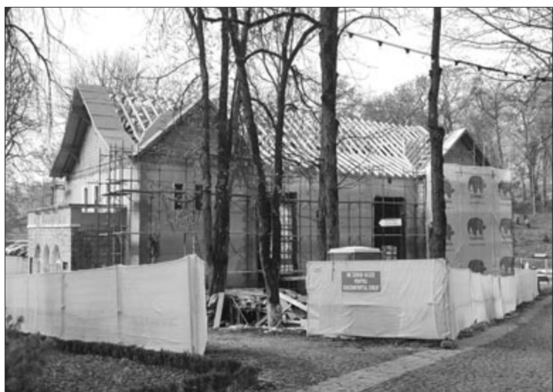
Megújul a volt mozi

becsülése céljából ennél jobb helyszínt nem találhattak volna, és elhelyezkedése miatt a működtetése és fenntartása is hatékonyabb. Továbbá az elmúlt évben virágórával gazdagodott a fürdőtelep a Bălcescu parkban, a lakótelepeken járdák és játszóterek újultak meg, korszerűsítették a városi könyvtárat, folyik az önkéntes hulladékátroló építése, valamint Illyésmezőben a víz-, szennyvíz- és gáz-hálózat kiépítése, miközben keresik a lehetőséget az oda vezető út aszfaltozására is.