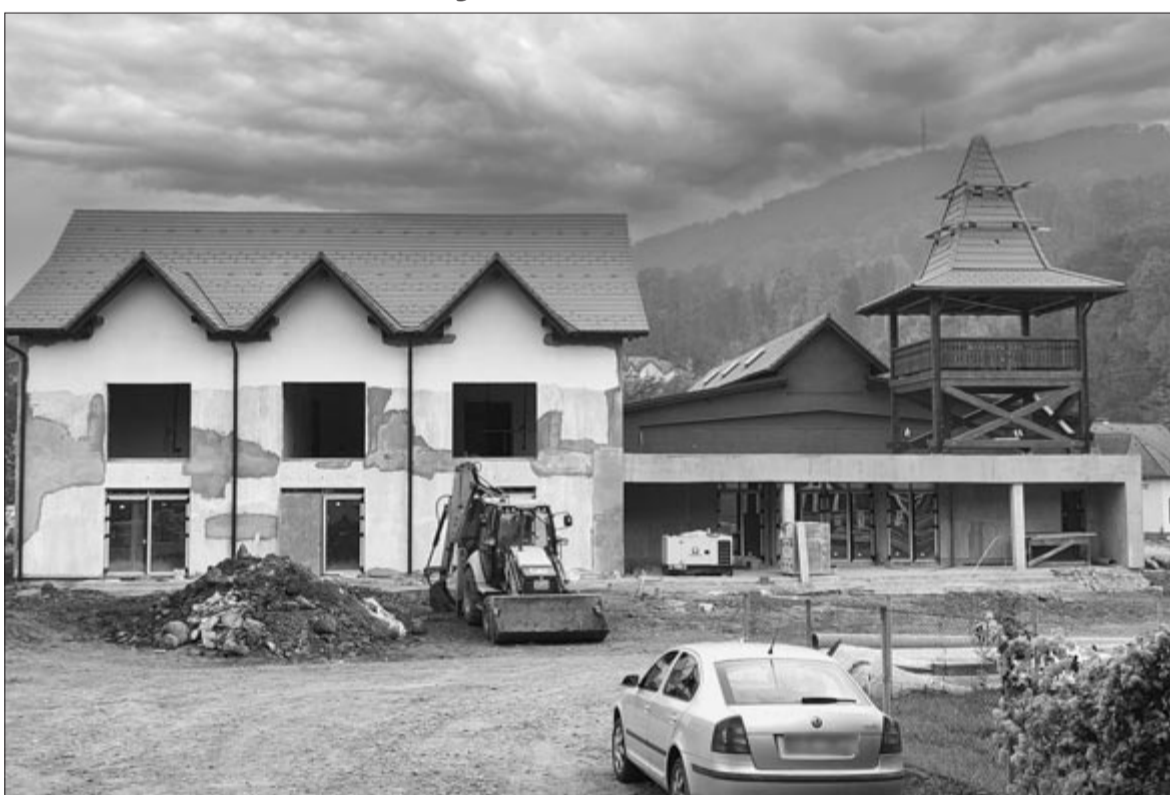
Jól halad az új kulturális központ építése

Jó ütemben épül a kulturális központ, az építkezési és külső munkálatok nagy részét már elvégezték, következnek a belső munkálatok. Miután a fürdőtelepen elkészült az amfiteátrum és körülötte a zöldövezet, rögtön kitérte, hogy valamit kezdeni kell a leromlott állapotú Doina mozival is, mivel nagyon rontja a