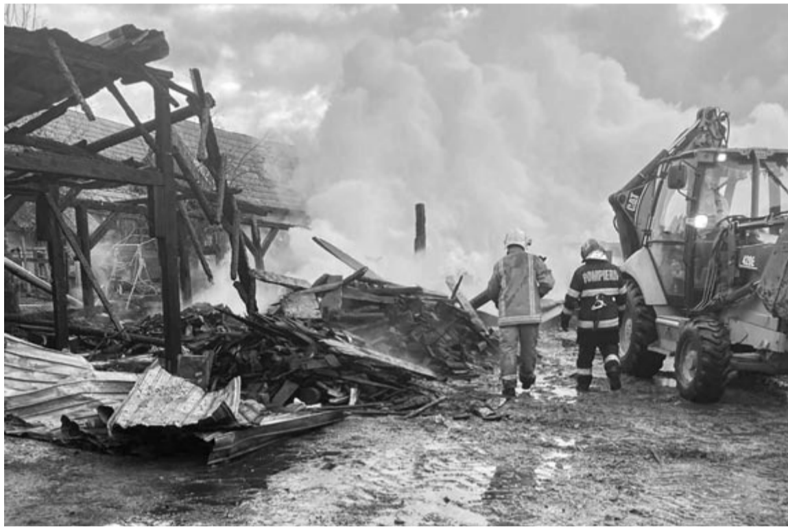
Backamadarason nagy anyagi kár keletkezett a három és fél óráig tartó tűzben