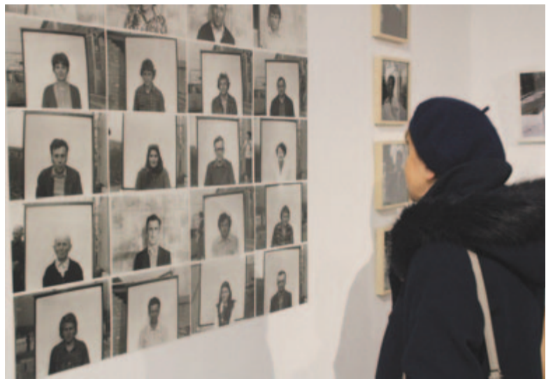
Munkásportré-sorozat a kiállításon

A fotográfia ugyanakkor egyéni munka, tette hozzá a kurátor, hiszen valakinek a kreativitása, egyénisége mutatkozik meg a fotókon keresztül. Török Gáspár a művészi fotók mellett dokumentumértékű felvételeket is készített: építkezések helyszínét rögzítette, munkatársairól készített portrékat. A képek nagy részében megjelenik