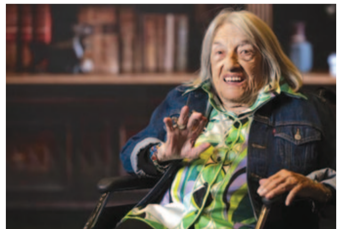
Keleti Ágnes ötszörös olimpiai bajnok tornász, a nemzet sportolója a Madame Tussauds Budapestben, miután megtekintette egykori pályatársai, Puskás Ferenc olimpiai bajnok labdarúgó és Papp László háromszoros olimpiai bajnok öklívívó viaszfiguráját 2024. április 26-án.

Ő lett a játékok legeredményesebb versenyzője, egyben a legidősebb tornász, aki aranyérmet tudott szerezni.