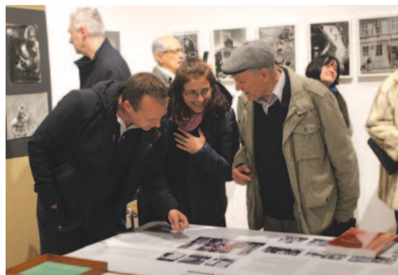
A Marosvásárhelyi Fotóklub jelenlegi tagjai az egykori tagok csoportképe előtt