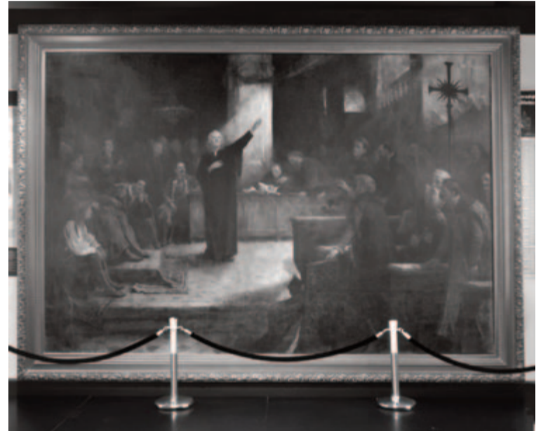
Körösfői Kriesch Aladár festménye a tordai múzeumban

A tordai ünnepséget a Duna World televíziós csatorna romániai idő szerint 11 órától élőben közvetíti. (közlemény)