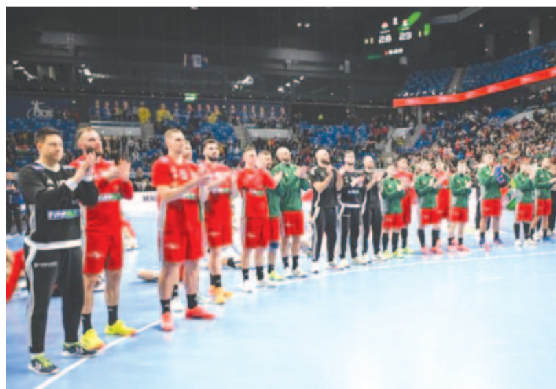
A magyar kézilabda-válogatott tagjai, miután világbajnoki felkészülési mérkőzésen 28-23-ra győztek Szerbia ellen a szegeci Pick Arénában 2025. január 10-én.

Ez lesz a 29. férfivilágbajnokság, a mezőny 32 csapata összesen 108 mérkőzést játszik Norvégiában (Oslo), Dániában (Herning) és Horvátországban (Porec, Varasd, Zágráb) a húsz nap alatt. A nyitómérkőzést ma 18.30 órától Olaszország és Tunézia játssza Herningben.