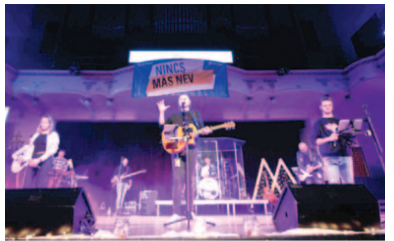
A színpadon a Reménység zenekar