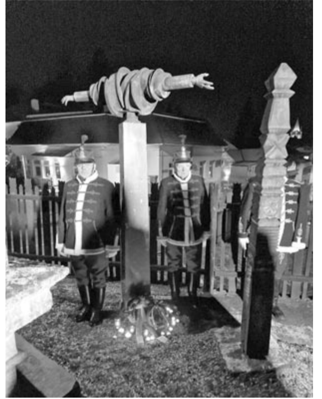
Vitézi Rend tagjainak jelenléte. A megemlékezést a himnuszok elnéklése tette teljessé, majd az emlékezés gyertyáinak a meggyújtására került sor.