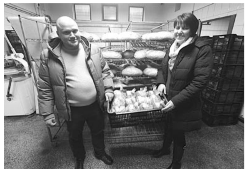
Ebben az évben hetente tizenöt kenyeret kap ingyen a támogatók és a Magyarok kenyere program jóvoltából az abodi gyermekotthon