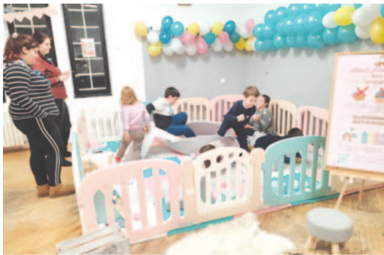
A legkisebb fesztiválózó