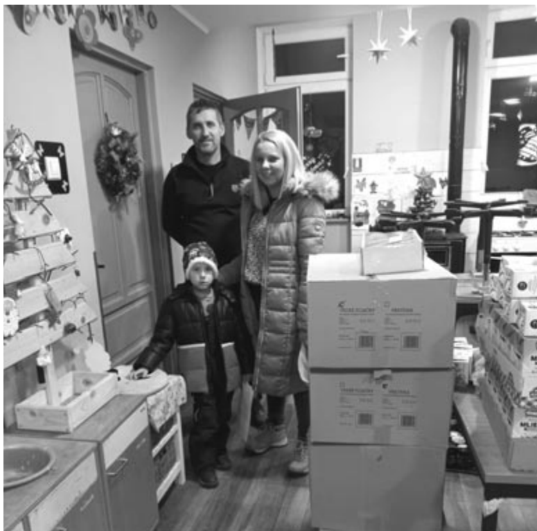
Ezúttal is jókora adomány érkezett a felvidéki barátoktól

finomságokat is tartalmazott, amelyeket nem biztos, hogy ők biztosítani tudtak volna a gyerekeknek. A kenyéradomány nagy tehertől szabadította meg őket, hiszen naponta többször kell ennivalót biztosítani tizenhárom gyereknek, ez pedig nem kis mennyiség. „Nekünk fontos érezni, hogy nem harcolunk egyedül ezekért a gyerekekért, hanem szívügye ez másoknak is, akik nem is ismernek minket. Jó érzés csapatként dolgozni: egyik közvetlenül neveli a gyerekeket, a másik adományokkal segít a mindennapi kiadásokban, a harmadik imádkozik értünk, a negyedik önkéntesként dolgozik a ház körül. Egyik sem tudja a másik nélkül végezni ezt a munkát. Köszönöm, hogy másoknak is fontos ezeknek a gyerekeknek a sorsa!” – mondta el érzéseit a Népszágnak az otthon vezetője.