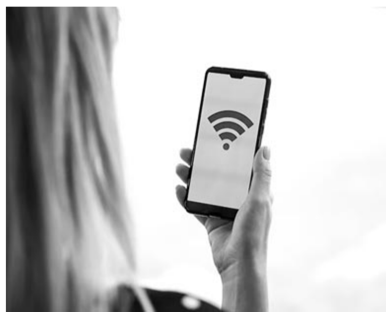
Telefonról megosztott internet (hotspot), illusztráció

Ha 2025-ben debütál is az almás vállalat saját 5G chipje, a mobiladat-forgalmat támogató MacBook leghamarabb 2026-ban érkezik meg, aminek oka, hogy a Bloomberg szerint az Apple a technológia piacra dobásával megvárna a második generációs modem, ami az előrejelzések szerint egy gyorsabb