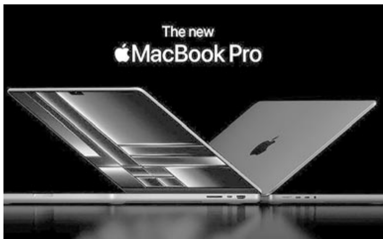
MacBook Pro, illusztráció

Azonban ezen a ponton még semmi nincs kőbe vésve, hívják fel a figyelmet a Bloomberg szakírói is, akik kiemelték, hogy az Apple-nek megvan a lehetősége arra, hogy elveti az ötletet, vagy egy időre parkolópályára állítja. Az viszont reményre adhat okot, hogy szintén a Bloomberg szerint – az almás vállalat azt is mérlegeli, hogy a Vision Pro kevertvalóság-szemüvegbe is beépítsen egy mobiladat-kapcsolatra képes modemet. Ez a tény pedig azt is jelzi, hogy talán tényleg komolyan gondolják mindkettőt, illetve, ha az egyik tényleg megszületik, akkor a másikra is sokkal nagyobb esély lesz.