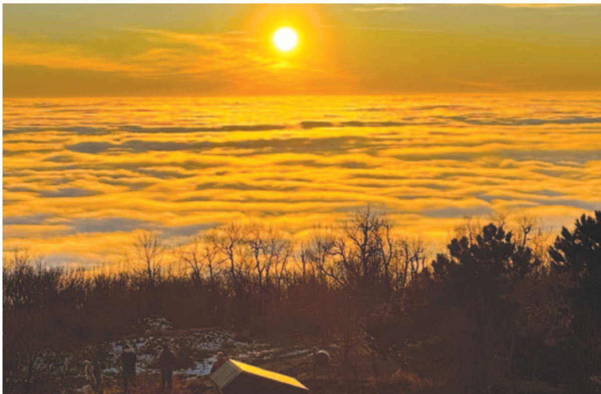
Újévi ködfelhő felett tavaszt ígér a nap

Kelt 2025-ben, ötvenkét évvel a Horto- bágyi Nemzeti Park megalapítása után