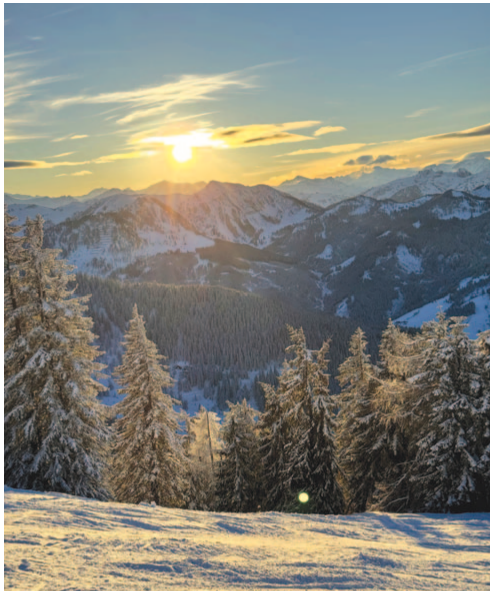
Csonkíthatatlan téli teljesség – benne alszik az élet

Január 13-án lesz nyolcvan éve, hogy meghalt az érolasz (Bihar vármegye) születésű