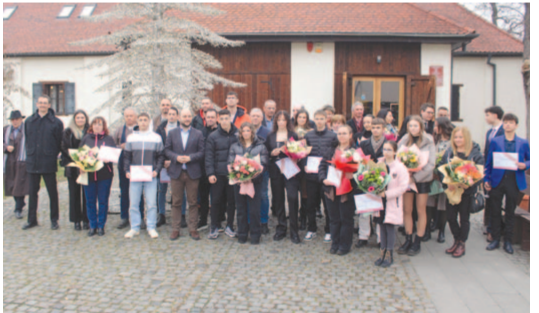
Rendhagyó módon, az év vége felé (!) díjazták a 2023-as év legjobb Maros megyei sportolóit Marosvásárhelyen. Képünk a városvardar, a házasságkötő terem előtt készült 2024. december 13-án