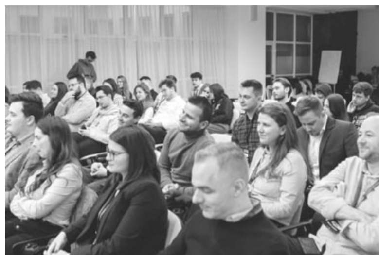
Telt házas előadások a XXII. EU Akadémián

– Sajátos helyzetben élünk, sajátos kihívásokkal, ezekhez kell megkeresni a megoldásokat – mondta Markó Béla , aki úgy tapasztalja, hogy sokan fordulnak el az Európai Uniótól és a NATO-tól, a nyugati demokráciáktól, amelyek mintáját az Egyesült Államoktól és a fontos nyugati államoktól kaptuk. Tagadhatatlan, hogy a demokrácia tőlünk nyugatabbra is megakad, ott is vannak konfliktusok, viszont a demokrácia és a nyugati szövetségi rendszerek jelentik az egyetlen utat az erdélyi magyarság előtt, ez az út egy nyitott Európa, egy olyan Európa, amely határok nélkül kínálkozik mindannyiunk számára, magyarázta az RMDSZ volt elnöke. Meglátása szerint, hogyha elfogadjuk a Magyarországról jövő üzenetet, és Románia elfordul az Európai Uniótól és a NATO-tól, elzárkózik, és egy nemzetállamot kezd el kiépíteni, akkor itt csak azoknak lesz helye, akik románul beszélnek,