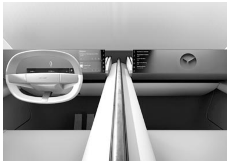
Jaguar Type 00-beltér, koncepció

A típus a Jaguar Electric Architecture – röviden JEA – platformjára épült, ami szintén egy teljesen új fejlesztés, és ahogy a neve is mutatja, kimondottan az elektromos autók számára volt kifejlesztve. A