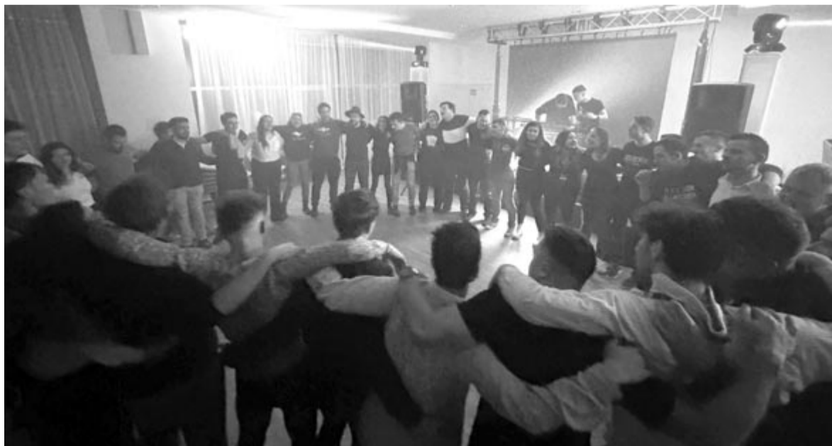
A hangfalak leállása után jött csak az igazi nagy buli az EU Akadémián