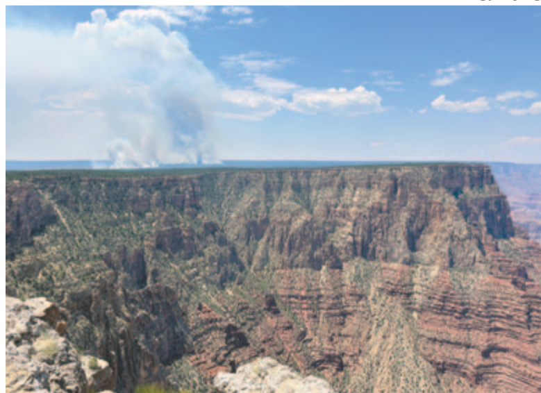
Erdőtűz a Grand Canyon közelében

Az utak azért vannak, hogy összekössenek. Összefűznek országokat, államokat, népeket, nemzeteket, kultúrákat és mindenekfelett embereket. Én büszke vagyok arra, hogy az E60-as út áthalad Maros megyén és Segesváron is, és mindennap emlékeztet bennünket amerikai élményeinkre.