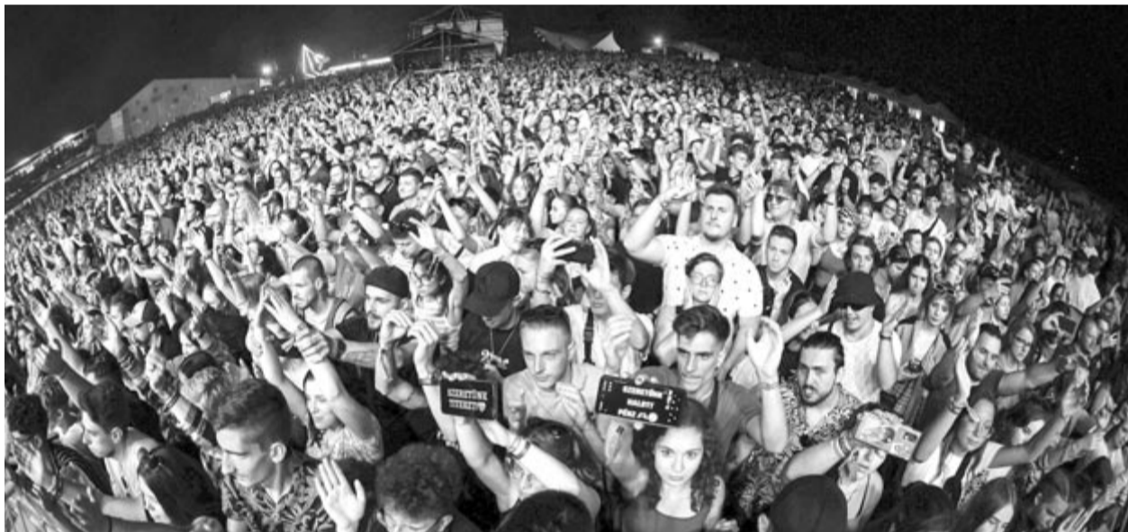
A Halott Pánz koncertjén

Az ünnepi időszakra a VIBE különleges ajánlattal is készült. A Mystery Christmas Box by Plaza M nemcsak egy VIBE-bérletet rejt, hanem VIBE-os ajándékokat és egy kuponkódot is, amely több mint 3000 nyereményhez biztosít esélyt. Aki karácsonyi ajándéknak szánja a Mystery Christmas Box by Plaza M dobozt, az online december 18-ig rendelheti meg, míg a Plaza M-ben és a promóterhálózatnál december 31-ig érhető el. A 2025-ös VIBE július 3–6. között lesz Maroszentgyörgyön. (közlemény)