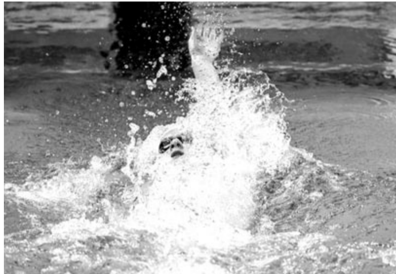
Kós Hubert a férfi 200 méteres hátúszás előfutamában az úszók rövidpályás világversenyén a Duna Arénában 2024. december 15-én.

századdal elmaradva, 1:45.65 perces Európa-rekorddal diadalmaskodott, az orosz Arkagyij Vjacanyin 2009-es 1:46.11-es kontinenscsúcsát javította meg.