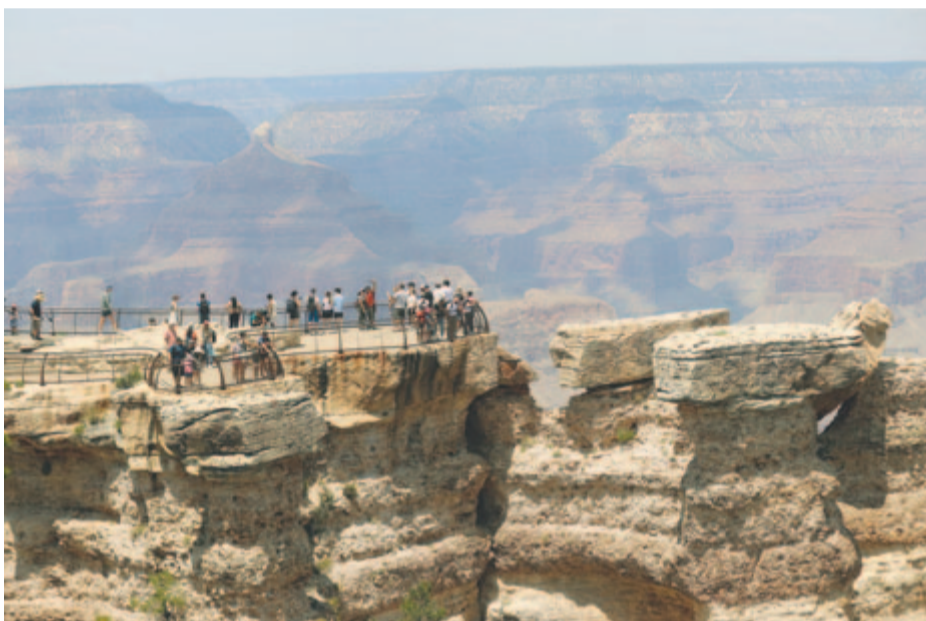
Kilátópont a Grand Canyon déli peremén

teni a vízszintes és függőleges összefüggéseket, minden összefolyt, hipnotizált, elkápráztatott. Elnyűtt hegycsúcsok ágaskodtak a mennybe, millió lépcső terelte tekintetünket a mélybe, mellékanyonok ágaztak százfelé, mint koszorúerek a verőérbe, azaz a Coloradóba. Merthogy mindez a nagy és titokzatos folyó műve, ahogy azt Leonardo da Vinci is tudta már: „az idő és a víz mindent megváltoztat”, illetve ahogy azt Petőfi is írta jelképesen: „a víz az úr”. A hatalmas és színes Grand Canyon, földünk egyik legfestőibb és leginspirálóbb táját a Colorado folyó sokmillió éves szurdokképző munkája vájta 446 km hosszan, a legmélyebb szakaszon 1800 méteres mélységbe. Ez a világ legnagyobb szárazföldi eróziójának iskolapéldája, a földtörténet nyitott enciklopédiája, melyben a kőzetrétegek ablakként tárták elénk az évmilliókat.