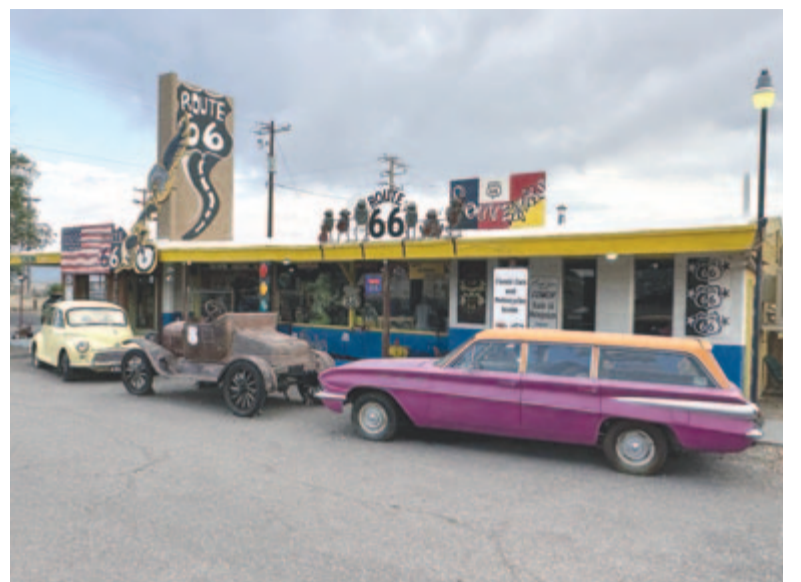
Ajándékbolt Seligmanben, a 66-os út mentén

is, de nem árt tudni, hogy a 45-50 Celsius-fokos gyilkos hőség, az esetleges ivóvíz- és élelmiszerhiány halálosan veszélyes lehet a tapasztalattal nem rendelkező, megfontolatlan kirándulókra. Több tábla is figyelmeztet a veszélyekre, na meg arra is, hogy nem szabad etetni a park területén nagy számban jelenlévő sziklai ürgéket. A tiltást azért érdemes megszívlelni, mert a Grand Canyonnak ez a kedves, de huncut „fenevadja” egyrészt évente több ezer ember megmarásáért felelős, másrészt – el sem hinné az ember – a kis állatok szó szerint elhíznak az állandó zabálástól, jóléttől. És valóban sok túlsúlyos kisállatot figyelmeztünk meg, melyek szemmel láthatóan nehezebben mozogtak a rájuk rakódott zsírfellegeltől. Nahát, erre nem gondoltam volna! Nem elég, hogy a nyugati kultúránkban ma már az egyik legnagyobb probléma az elhízás és az ebből adódó