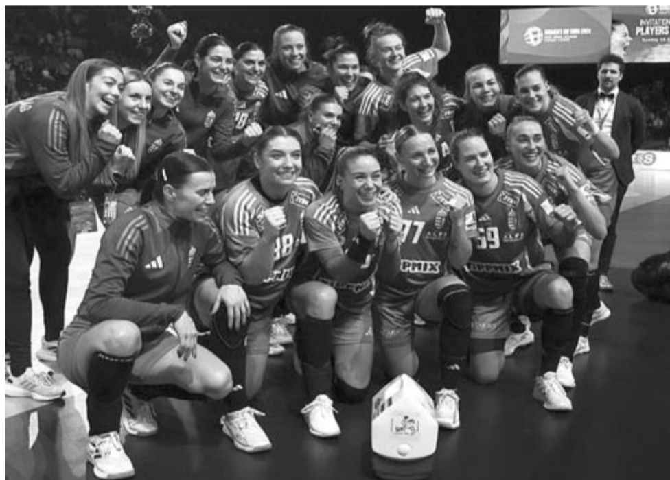
A győztes magyar csapat a női kézilabda Európa-bajnokság harmadik helyéért játszott Franciaország – Magyarország mérkőzés végén a Wiener Stadthalléban 2024. december 15-én.

A magyar válogatott 25-24-re legyőzte a világbajnok és olimpiai ezüstérmes francia csapatot a magyar-osztrák-svájci közös rendezésű női kézilabda Európa-bajnokság vasárnapi bécsi bronzmérkőzésén.