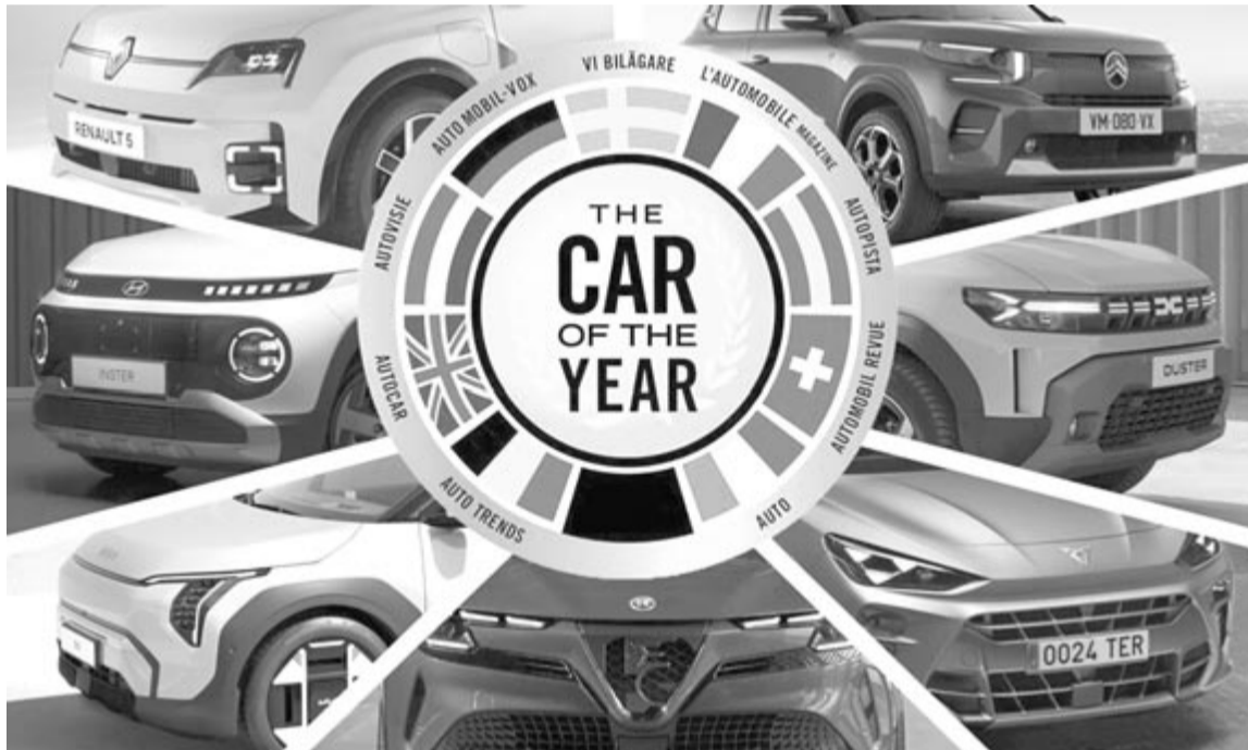
A 2025-ös Év Autója díj döntősei

Az elektromos autók feltörésével egyidejűleg pedig mind nagyobb szerep jut a kisautóknak, mint amilyen a Renault 5/Alpine A290, a Hyundai Inster vagy a Citroen C3 és e-C3, ebből pedig arra lehet következtetni, hogy a szakmai zsűri egyre több racionális szempontra figyel, és nem az a célja, hogy egy kívánatos, nagy autónak ítélje oda a díjat, hanem egy több szempontból praktikus gépjármű legyen.