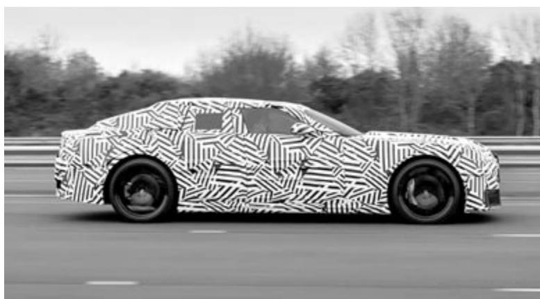
Álcázott elektromos Jaguar oldalról

Az pedig még különösebbé teszi a helyzetet, hogy a brit márka ettől a lépéstől azt várja, hogy rövid távon, 2030-ig valós konkurense lesz a Bentleynek. Tévedés ne essék, mindkét gyártó egy bizonyos réteget szólít meg, sem a Jaguar, sem a Bentley nem szól mindenkinek, már csak az árak miatt sem, azonban jelenleg utóbbinak jóval nagyobbak az eladásai. A Jaguar nagyon komoly növekedésre kell szert tegyen, ha utol szeretné érni a vetélytársát. A cél elérése érdekében pedig készül egy másik villanyautóval is, ami, úgy hírlik, 2026-ban mutatkozhat be, és minden bizonnyal egy elektromos SUV lesz.