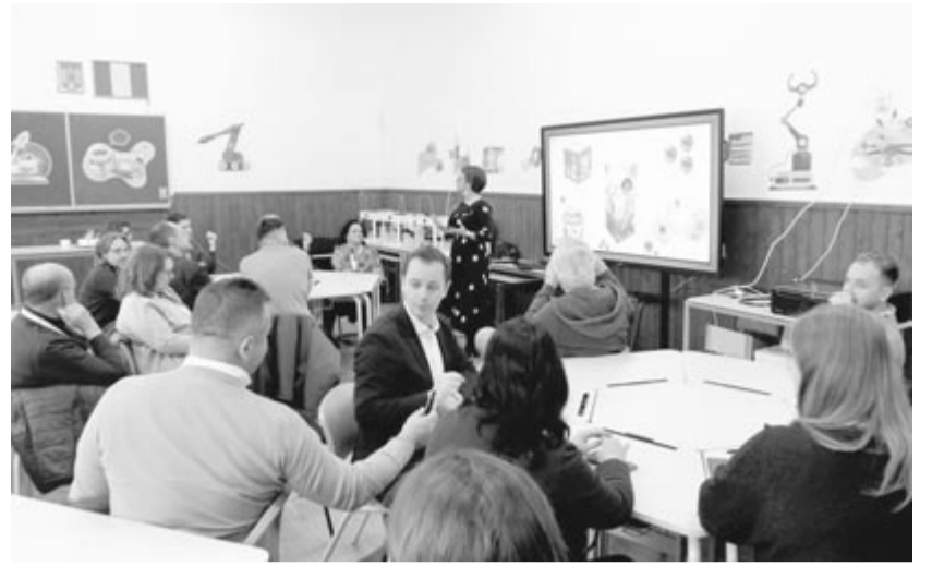
Hasznos tapasztalatot szereztek a vendégek Szovátán a digitális oktatási lehetőségekről

A múlt heti rendezvényt az iskola mellett a Romániai Magyar Pedagógusok Szövetsége (RMPSZ) is támogatta, amelynek az ajánlásával két éve valósult meg az első romániai okos-