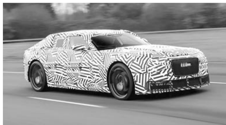
Álcázott elektromos Jaguar