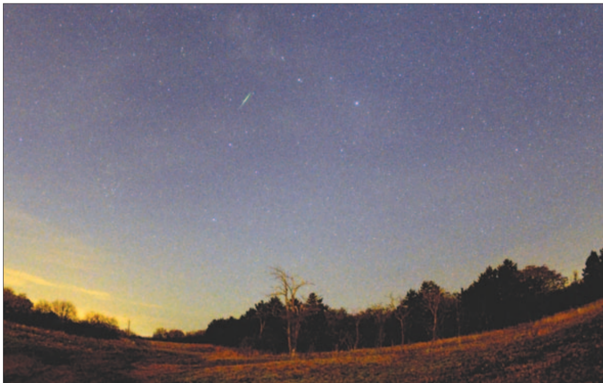
Egy Leonida égve érkezik az Oroszlán (Leonus) csillagkép fejéből

Áprily Lajos Intérieurje legyen mai hála-szavam a tudomány fényt hozó titánjainak. Maradok kiváló tisztelettel. Kelt 2024-ben, enyészet havának idusán.