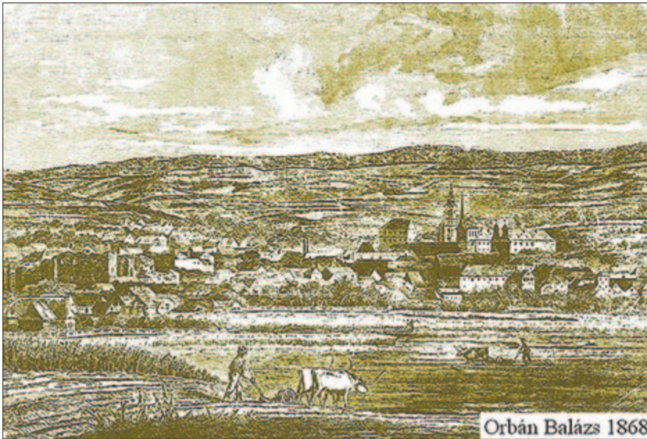
Orbán Balázs 1868