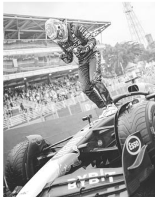
A Red Bull holland versenyzője, Max Verstappen a győzelmét ünnepli

A világbajnoki idény három hét múlva Las Vegasban folytatódik.