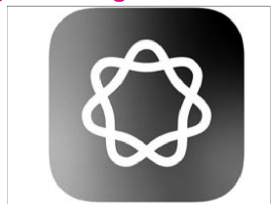
Apple Intelligence – az Apple mesterséges intelligenciája – logó

Ez is alátámasztja azt, amit Mark Gurman, a Bloomberg szakírója publikált legfrissebb Power On nevű hírlevelében. Ebben arról van szó, hogy az Apple néhány munkatársa szerint a vállalat megközelítőleg két évvel le van maradva a mesterséges intelligencia fejlesztésével. Arról nem is beszélve, hogy a vállalat mesterséges intelligenciája csak azokon a termékeken fog futni, ame-