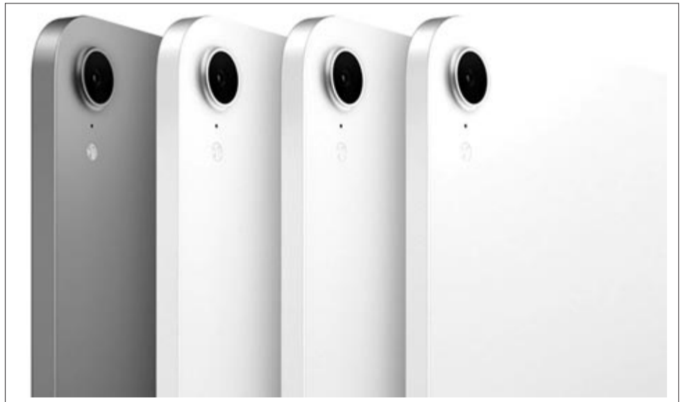
Hetedik generációs iPad mini

Az újdonság elérhető purple (lila), starlight (csillagfény) space gray (asztroszürke) és blue (kék) változatban is, színek tekintetében utóbbi számít újdonságnak. Továbbá az új mini támogatja az Apple Pencil Prót, valamint a legolcsóbb változata immáron nem 64 GB, hanem 128 GB belső tárhellyel érkezik. A készülék még támogatja a Wi-Fi6E és Bluetooth 5.3 csatlakoztathatóságot, illetve immáron az iPad mini is megkapta az USB-C aljzatot. Ezen túlmenően a legtöbb specifikáció változatlan maradt. A kijelző sem változott, továbbra