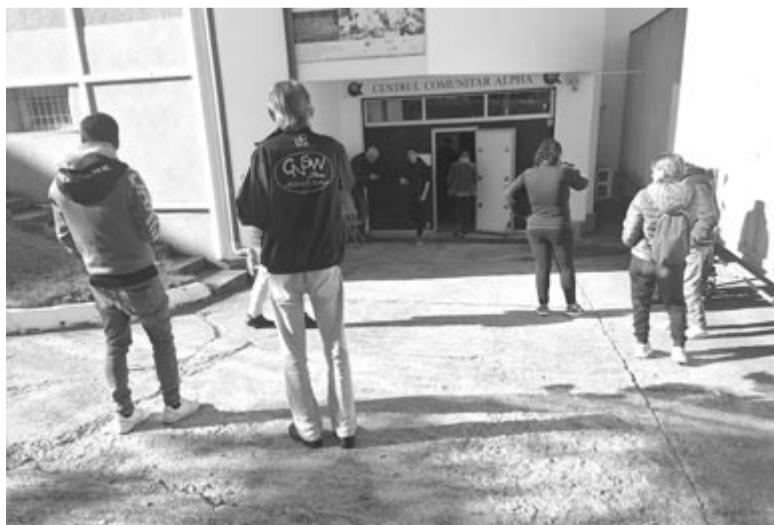
Alpha közösségi központ

A Solidaris Egyesület munkatársas hangsúlyozta, amennyiben a vártnál többen érkeznek a régi születés melletti parkba ételért, akkor sem fog senki üres kézzel távozni, hiszen arra is volt példa, hogy elosztották a menüt, egyesek levest, mások másodikat kaptak. A menü amúgy is bőséges: leves, második fogás, savanyúság, desszert, és melléje kenyér, így most is sokan beosztják, és egy adagból két napig esznek.