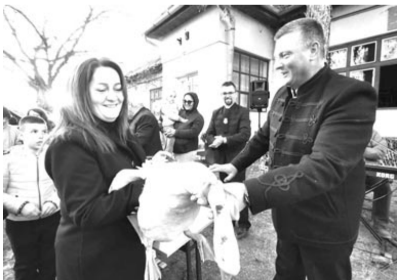
Nyárádszentmártonban minden évben a szerencsés nyertes egy libát vehet át a Márton-napi vigasságon

Manapság néhány étterem is különleges menüt kínál a jeles naphoz kapcsolódóan. A nyárádszeredai Csámborgóban a múlt héten ínycsiklandó hétvégét hirdettek, három napon át elérhető volt a libavacsora, azaz libacomb hagymás krumplival és párolt lila káposztával vagy zsályás almászósszal, pénteken élő zenés estet szerveztek, „hogy a liba ne csak a tényérodon, hanem a táncparketten is szárnyra kapjon!”. Sorsjegyet is lehetett vásárolni, a szerencsés egy konyhakész libát vihetett haza.