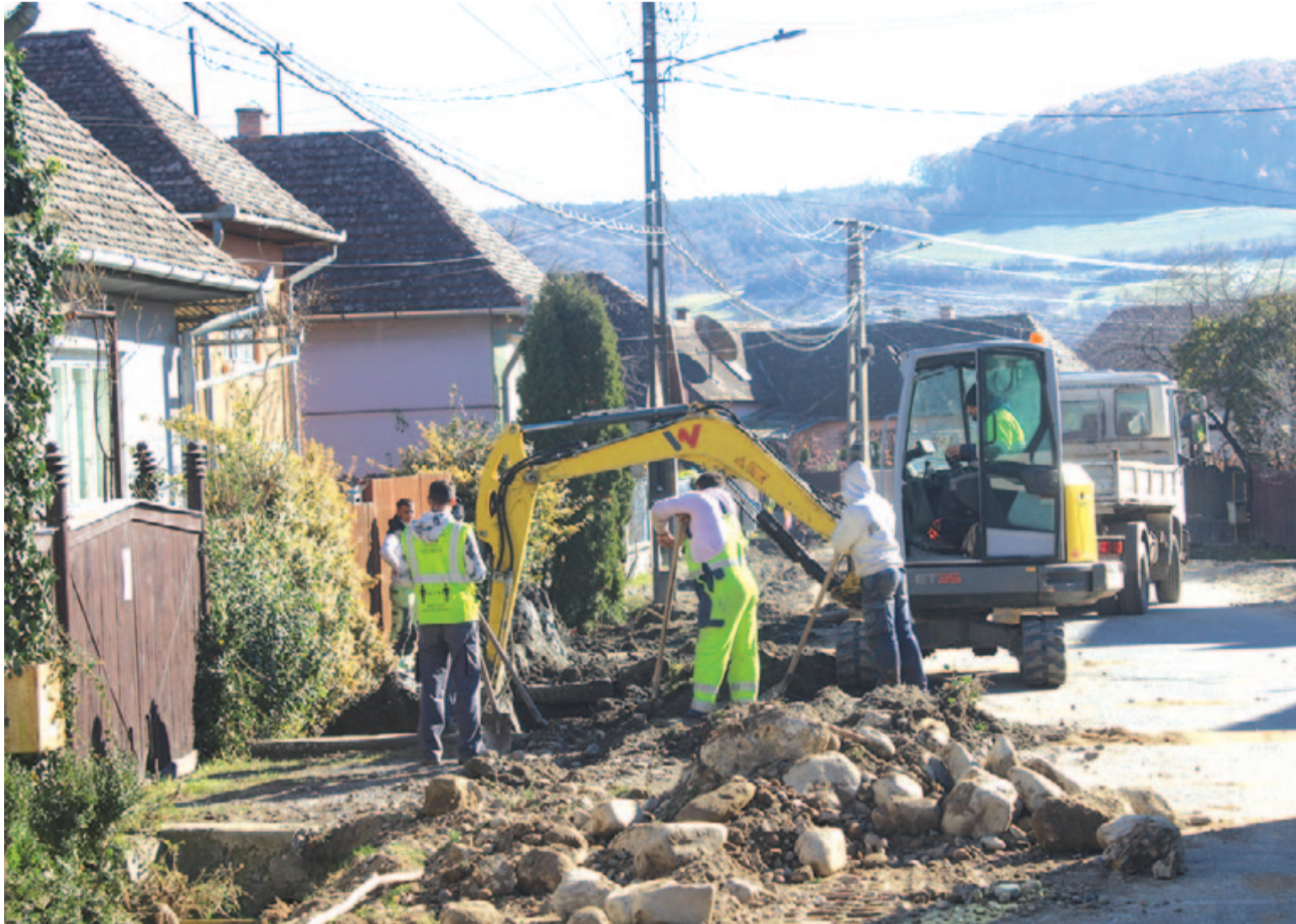
Cserélik a gázvezetékét a faluban