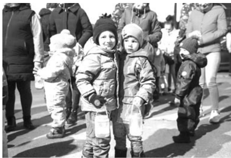
Szovátán a kisgyerekek és családjuk lámpás felvonuláson és tűzgyűjtésen vesznek részt

Múlt héten a szovátai S. Illyés Lajos Általános Iskola kisdíákjai és óvodásai Szent Márton napjára hangolódottak, miután a szent életű püspök jóságos, segítőkész, szeretetteljes életét, legendáját megismerték. A jeles naphoz kapcsolódó énekeket, mondókat tanultak, libás kézműves alkotások, lámpások (sőt libalámpások) is készültek, püspökkenyér sült. Pénteken kora este több százán bekapcsolódtak a Szovátai Népi Játékszínház által kezdeményezett lámpás felvonulásba, a kisgyerekek