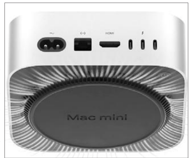
Mac mini hűtés, illusztráció

Portok tekintetében az új Mac mini ezek széles skáláját kínálja. Az előlapi részen helyet kapott két USB-C port, amelyek támogatják az USB 3-at, valamint (szintén elől) még lehet találni egy audiocsatlakozót is. A hátoldalon levő portok esetében viszont már különbség mutatkozik a sima M4-es és az M4 Pro processzorral ellátott változatok között. Előbbi esetében három Thunderbolt 4 csatlakozó van, míg az erősebb lapkával ellátott gép esetében három Thunderbolt 5 port. Ezek mellett mindkét változatban alapfelszereltség a gyorsabb hálózati sebességet biztosító Ethernet csatlakozó, egy HDMI-port és értelemszerűen a tápcsatlakozó. Mint ismeretes, a HDMI azt a célt szolgálja, hogy az eszközre rácsatlakoztassunk egy kijelzőt vagy tv-t, viszont ilyen tekintetben is van különbség az M4 és M4 Pro processzorral ellátott gépek