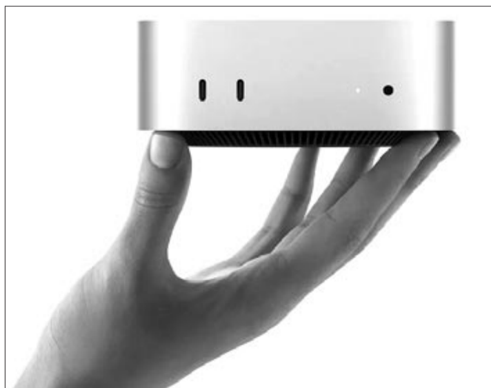
Mac mini 2024