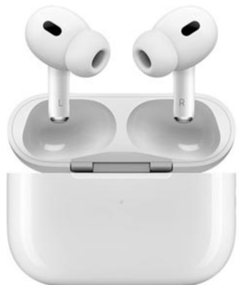
Apple AirPods Pro, illusztráció

A Powerbeats Pro 2-ről amúgy már megjelent néhány fénykép, amelyeken az látható, hogy a fülhallgató egy teljesen új designt kapott, állítható kampókkal rendelkezik a biztonságosabb illeszthetőség érdekében, illetve vékonyabbnak is tűnik a képek tanúsága alapján, mint az első generáció. Továbbá a Beats logón lévő fizikai gombot egy érintésérzékeny gomb váltotta fel, de ezenkívül is van még egy fizikai gomb a fülhallgató szárnán.