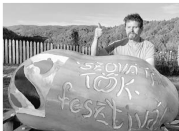
lyenkor tökkabokkal díszítik fel a várost, közöttük óriásméretűekkel