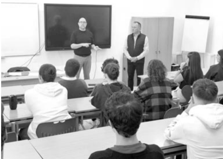
A DSD-diploma-átadó a Bolyai Farkas Elméleti Líceumban

A Szent-Györgyi tanulmányi versenyre érkező diákok meghívást kaptak a magyar tudomány ünnepe programsorozat szegedi megnyitójára, amelyen prof. dr. Karikó Katalin előadását is meghallgathatják.