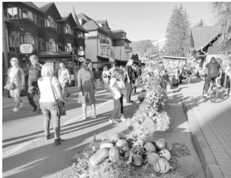
Három napon át látványos alkotásokkal, számos programmal várják a fürdőtelepre látogatókat

Szombaton délelőtt közösségi futást szerveznek, majd a tűzoltóautók vonulnak fel a fürdőtelepre, és retró autókat lehet szemügyre venni a buszállomáson. Délután a szováti Kangoo Jumps csapatával lehet megmozdulni az amfiteátrumban, majd Benkő Orsolya és Jeremiás Gellért szóra-