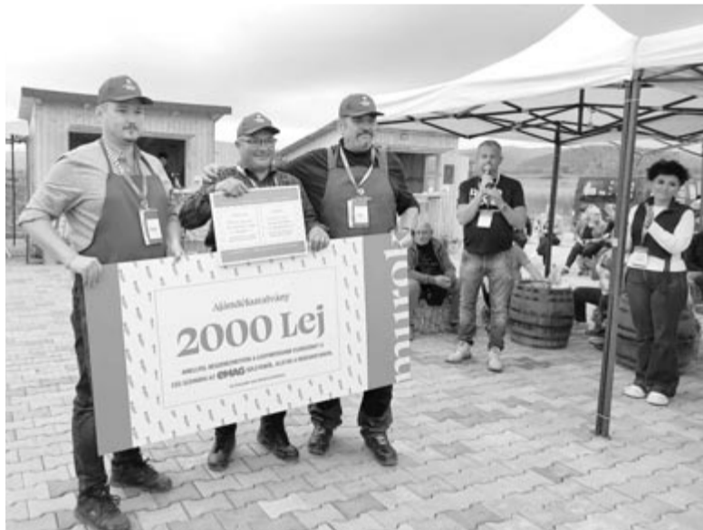
A legjobbnak a marosvásárhelyi repülőtér csapata bizonyult, három zakuszkával

A sok látogató is végigkóstolhatta a csapatok asztalára került sok finomságot: bár akadt kolbász, sonka, szalonna, szalámi is, mindenki főként a zakuszkára volt kíváncsi. A legtöbben a klasszikusnak számító paszulyos vagy padlizsános készítették, de akadt fokhagymás, gombás, sőt halas is. És