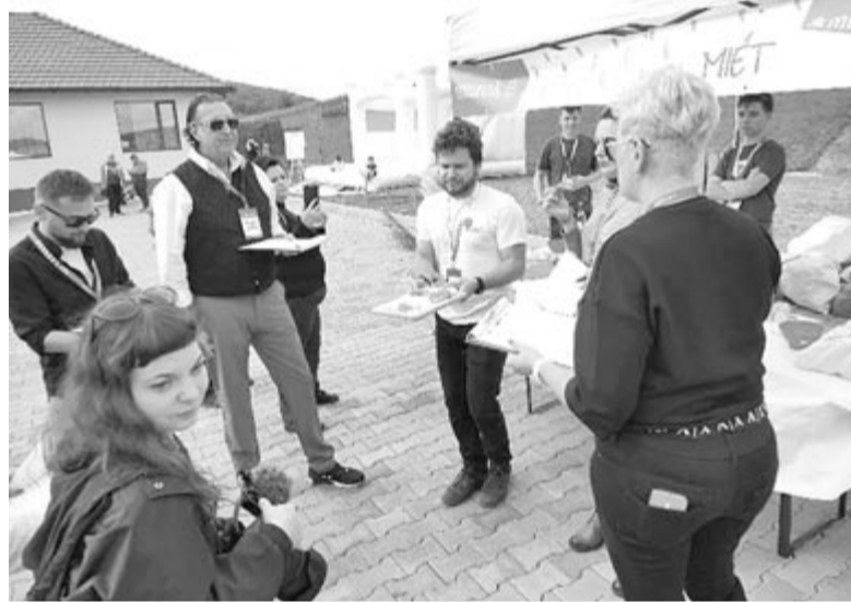
A tálalást, az ízeket, a jókedvet, azaz szinte mindent pontozott a zsűri

Azt is megtudtuk: a Murok a következő napokban elkészíti háromféle saját zakuszkáját is.