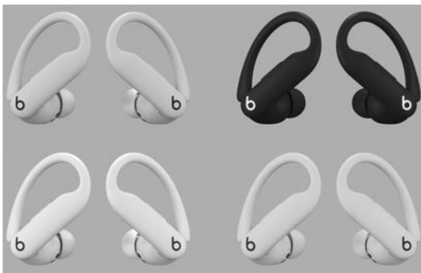
Powerbeats Pro 2