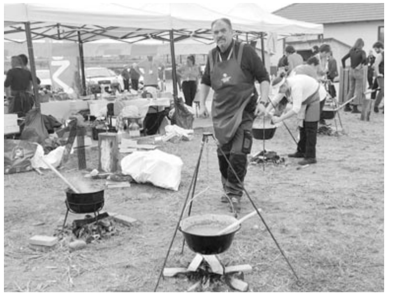
Nyolc csapat főzött számos hagyományos és új recept szerint

A készítményeket nem akármi-lyen nevekből álló zsűri ítélte meg: Doru Borşan üzetember, Mihaela