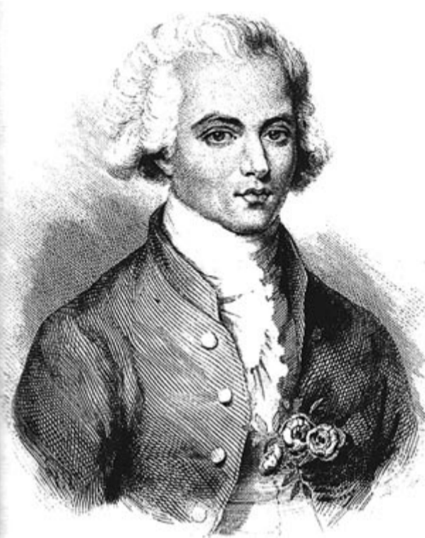
Charles-Édouard de Beaumont 1840-ben készült idealizált portréja az ifjú Joseph Bologne-ról

A hegedűs testőr kegyeiért azért versenyeztek a zeneszerzők, hogy ő mutassa be műveiket. Ezért egyesek Haydn műveit ajándékként hozták neki, Carl Philipp Stamitz német zeneszerző pedig hat vonósnyegyesét ajánlotta a lovag hegedűsnek.