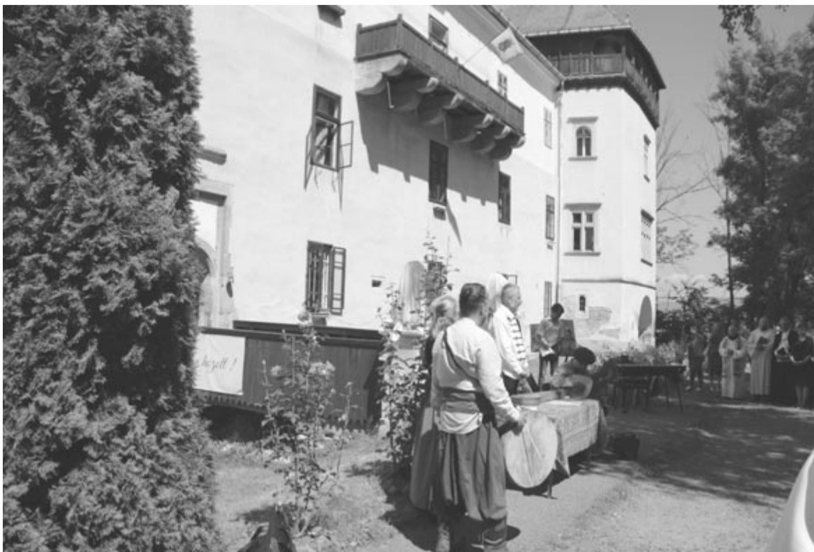
Ünnepi búzaösszeöntés a marosvécsi kastélyban

A színes, minden generáció érdeklődésére számot tartó kulturális rendezvényre a belépés ingyenes lesz, adományozni lehet majd a rendezvény helyszínén kihelyezett adománygyűjtő dobozokba,