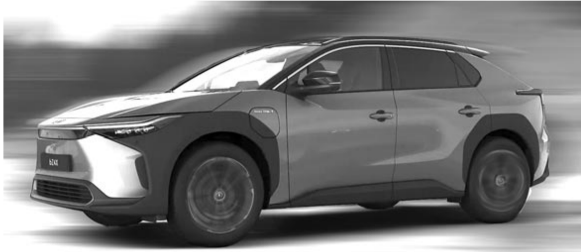
Toyota bZ4X, a Toyota egyetlen, Európában is kapható villanyautója