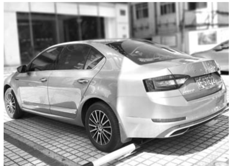
Kínai Škoda, illusztráció

Az új plug-in hibrid technológia viszont nem garancia arra, hogy a Škoda ismét sikeres lesz, illetve mindenképpen idő kell ahhoz, hogy kiderüljön, elégséges-e ez a lépés. Viszont nagy valószínűséggel a Škoda problémáját és az eladások drámai csökkenését ennyivel nem lehet majd megoldani.