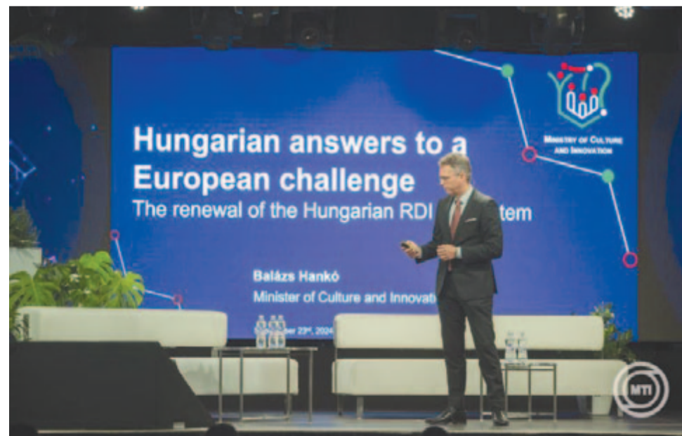
Hankó Balázs kultúráért és innovációért felelős miniszter előadást tart a Hungary Innovation Week nyitóeseményén Budapesten, az Akvárium Klubban

A rendezvény a héten előadásokkal, panelbeszélgetésekkel folytatódik. (MTI)