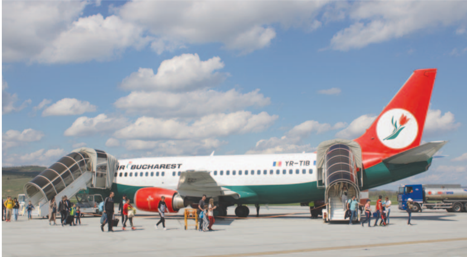
Charterjárat a marosvásárhelyi Transilvanai repülőtéren