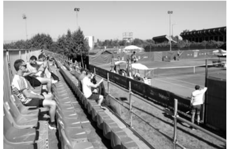
A tenisztorna helyszíne

Romániában nagy népszerűségnek örvend a tenisz. A tornaszervezők rangsorában a 6. helyet foglalja el Európában, ami fejlődésre ad lehetőséget a helyi tehetségeknek.