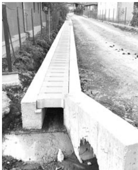
Néhány sáncot kibetonoznak, lefednek, hogy helyet nyerjenek

Szentlászlón jelenleg egy támfal épül a patak medre mellett és az útalapokat készítik, Szentháromságon most kezdték el ezt a munkaszakaszt. Az utcák alatti összes átterest kicserélik, de újjáépíteni nem kell egyet sem, Gálfalván viszont egyet megnagyobbítottak az egyik dombtetőn.