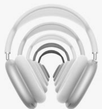
Apple AirPods Max 2