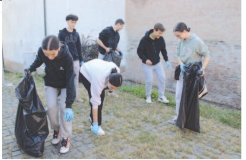
A marosvásárhelyi vár környékét takarítják a Let's do it önkéntesei

A megyeszékhely környékén a legtöbb szemetet a Maros partjának Marosvásárhely és Marosszentgyörgy közötti szakaszára viszik azok, akik így próbálnak megszabadulni a hulladéktól. A Marosvásárhelyi Rádió „Közösen kitarítjuk!” – jelmonddal több alkalommal meghirdetett hulladékgyűjtő akciója is erre a szakaszra összpontosult. Az idei Let's do it akcióba bekapcsolódott volna Marosszentgyörgy polgármesteri hivatala is, hiszen nagy részt az említett partszakasz a község területét érinti. Lapunk követte volna a hétvégi Maros-parti takarítást, de a város peremtelepülésének polgármestere szombaton reggel arról értesített, hogy a Let's do it szervezői más helyszínt választottak, ugyanis NEM VOLT SZEMETES A MAROS-PART, vagyis nem volt, amit összegyűjteni, így az önkéntes csoportokat a városba (Marosvásárhelyre) irányították, ahol, nem a korábbi