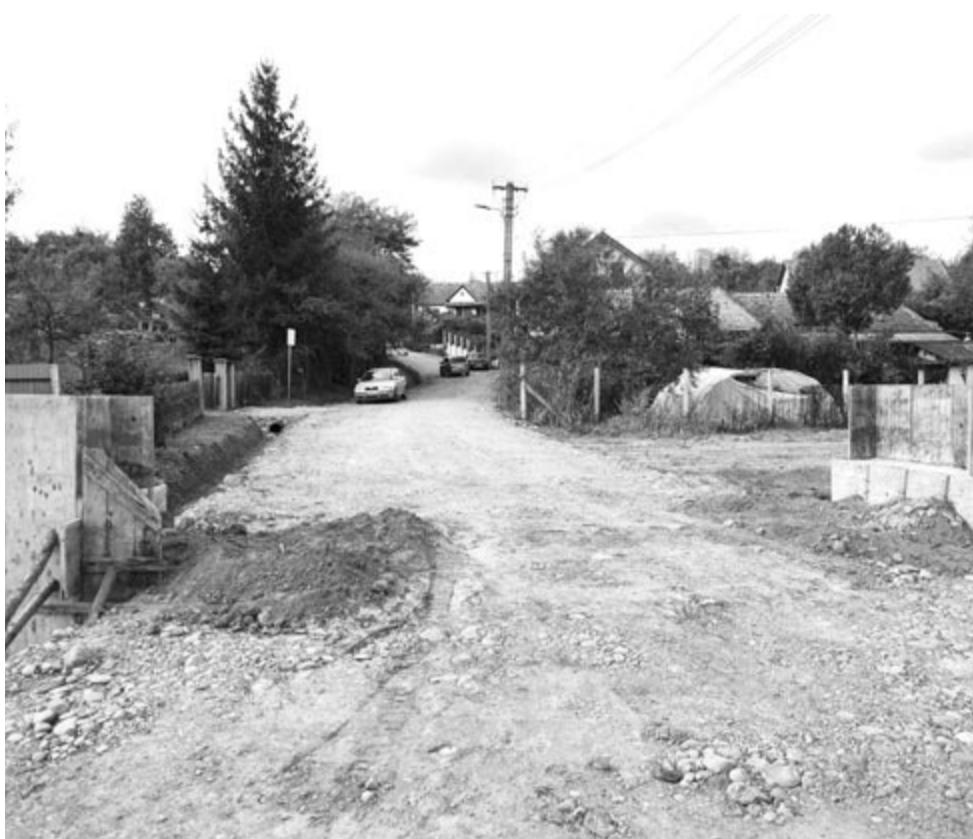
Kevés utca maradt, amelyet nem korszerűsítene most a községben

A községvezető elégedett a kivitelező céggel, amely jól dolgozik, megértő és segítőkész. Az a kérdés, hogy meddig lesz saját tartaléka, hiszen még nem nyújtott be számlát, s nem kapott pénzt az eddig elvégzett munkákért.