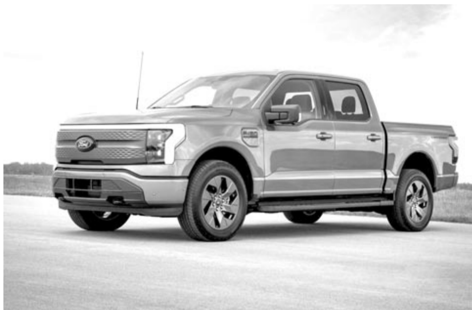
Ford F-150 Lightning, a Ford óriási elektromos pick-upja

A vállalat azon döntése, hogy mégsem valósítja meg a három ülésoros elektromos típust, illetve a második elektromos pick-upja bemutatóját is elodázza 2027-re, komoly pénzvesztéssel jár. A tervek módosítása egyes becslések szerint 1,9 milliárd dollárba is kerülhet a gyártónak. A pénzvesztés nem büntetés, tehát nem valamelyik állam szabott ki bírságot a gyártóra, hogy nem tartotta be az ígéreteit, hanem a piaczgazdaság mechanizmusairól van szó. Arról, hogy nincs ingyenebéd, a befektetett pénz nem fog hasznot termelni, sőt az sem kizárt, hogy kamatot is kell utána fizetni, ami mind veszteség. A Ford következő, teljesen elektromos autója csak 2026-ban érkezik, a tervek szerint egy furgon lesz. Ugyanakkor nem kizárt, hogy az erre vonatkozó tervek is változni fognak. A Ford esetében meglepő a tervmódosítás, hiszen az