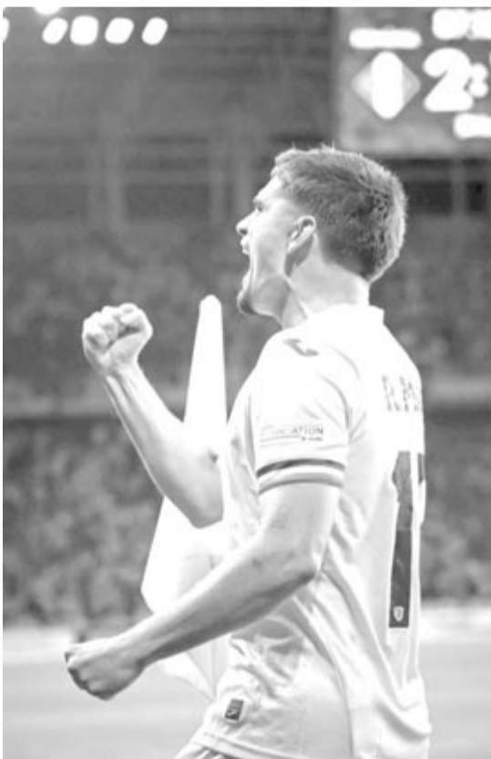
1-2 helyett 2-1

A csoport másik mérkőzésén Koszovó meglepetésre 4-0-ra nyert Cipruson, így átvette a tabella második helyét a szigetországiaktól. A rangsor élén a román csapat áll 6 ponttal, míg Litvánia az utolsó 0-val.