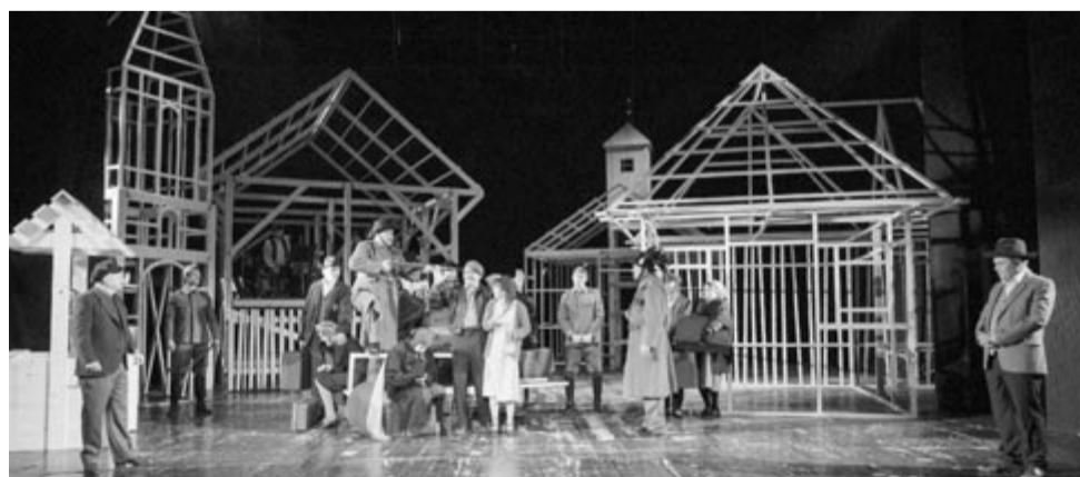
Jelenet a Tompa Miklós Társulat Az igazság gyertyái című előadásából