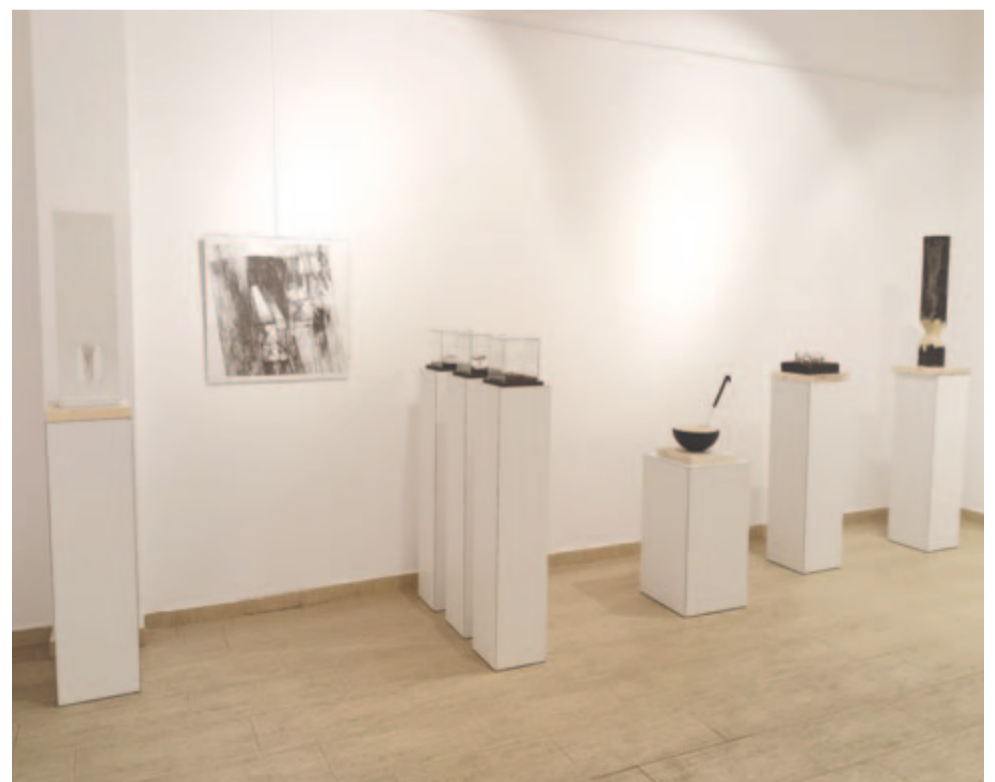
A galéria másik fala