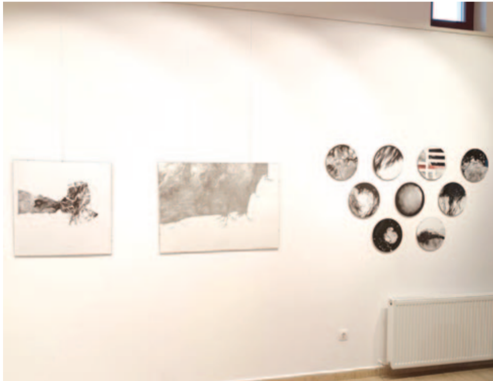
Harmath Ica grafikái

– Ezt egy széles spektrumú grafikai látványvilág tükrözi, első pillantásra megragadja a nézőt a kiállítás formagazdagsága és a grafikus által bravúrosan használt eszköztár. Hány év munkájából válogattál?