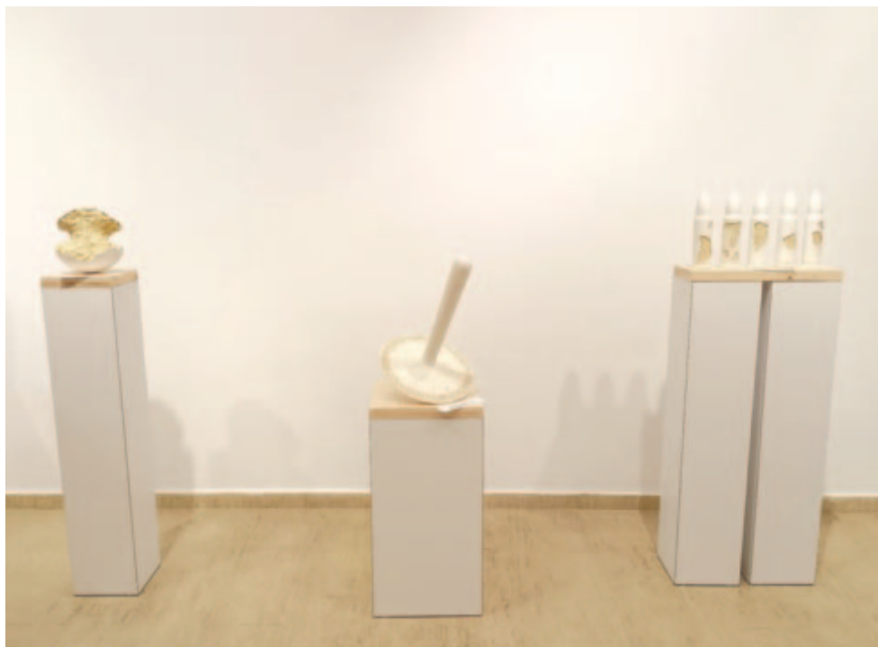
Harmath István szobrai