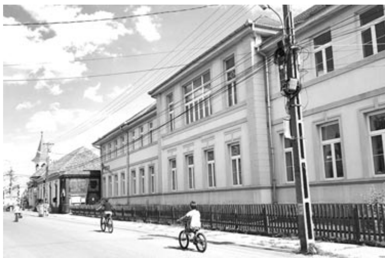
Jó az oktatási infrastruktúra, de a diáklétszám alacsony, és csak néhány év múlva várható emelkedés

Ami az érettségit sikeresen letett diákokat illeti, a tavalyelőtt ez a szám meghaladta az ötven százalékat, de tavaly hangsúlyosabb visszaesés volt, idén viszont sokat javult az arány. Ezek azonban relatív kérdések, hiszen jó arányokról akkor lehet beszélni, ha az országos átlag fölöttiek volnának a mutatók. Ennél gyengébbek, de sokat javultak az idén – magyarázta az igazgató, hozzátéve, hogy a statisztikán sokat ront az, hogy a román nyelvel nehezen boldogulnak a nyárádménti diákok is, így román nyelvből és irodalomból alacsony jegyeket érnek el.