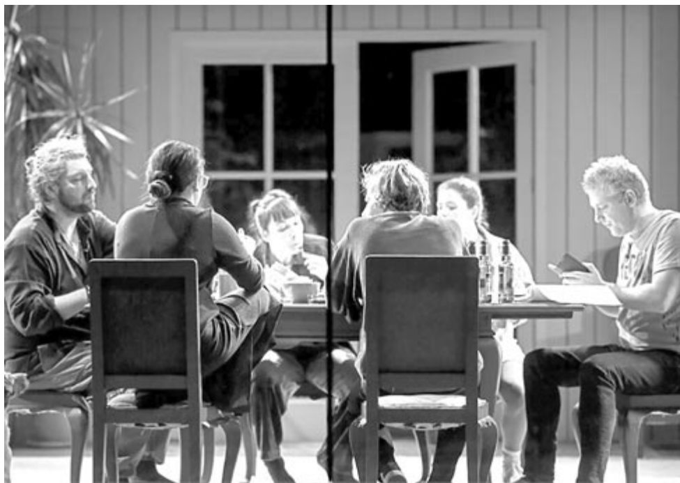
Az ember, aki csak azt tudta mondani, amit olvasott