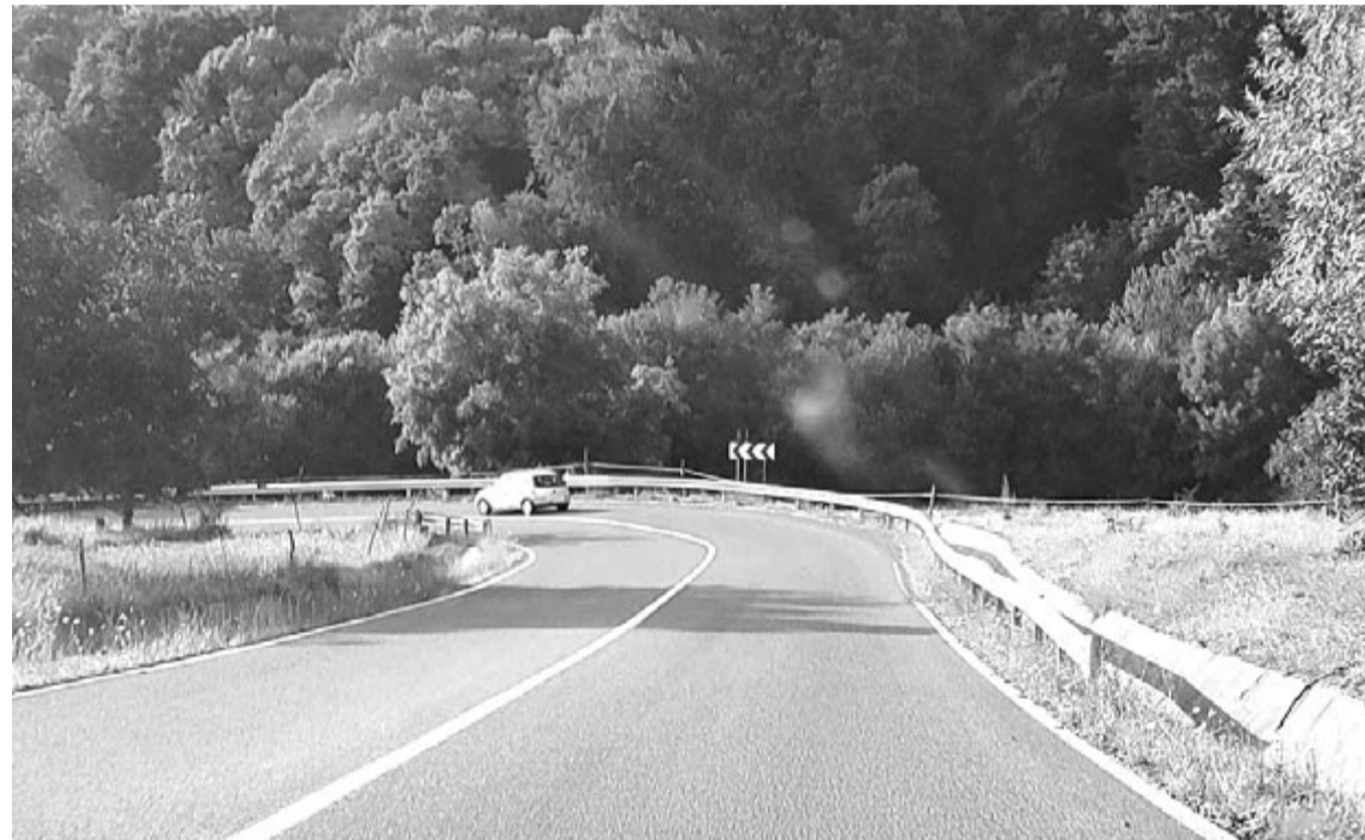
Egyelőre csak megyei út vezet át a Bekecsen, néhány év múlva akár autópálya is lehet