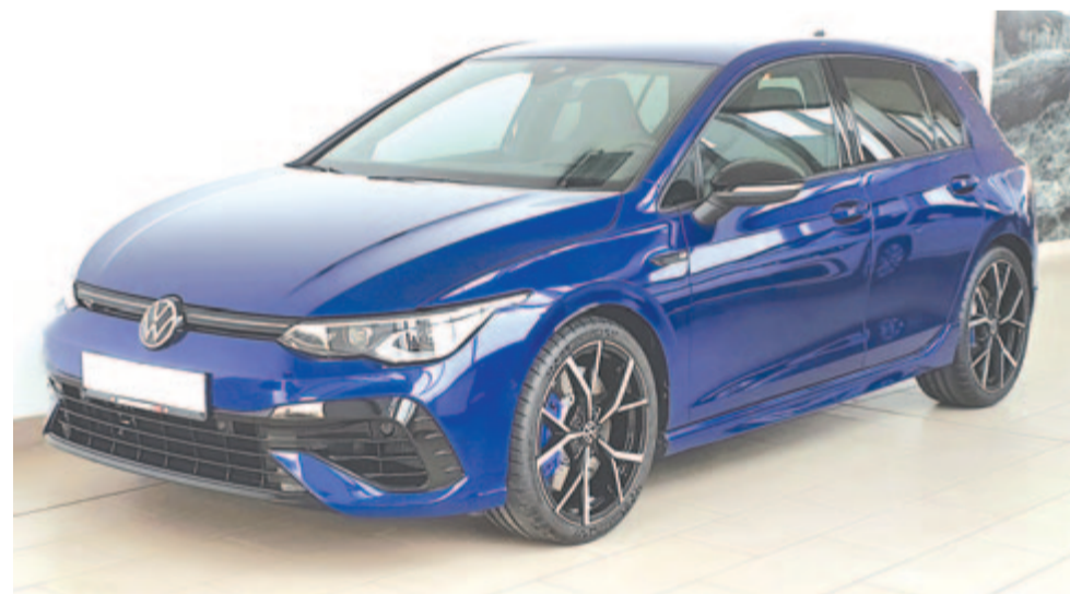
A jelenleg kapható, nyolcadik generációs Golf

gesen komolyan gondolják, hogy 2035-ig forgalmazni fogják a Golfot, másrészt azt is jelenti, hogy a következő bő egy évtizedben sokat nem szándékoznak fejleszteni rajta.