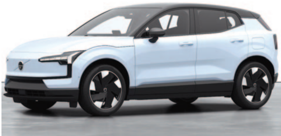
Volvo EX30, a Volvo egyik legújabb villanyautója

Az egykori svéd – jelenleg a kínai Geely tulajdonában lévő – márka már 2021-ben bejelentette, hogy 2030-ra olyan márkává akar válni, amely csak villanyautókat forgalmaz. Tehát a Volvónak az volt a terve, hogy kilenc évvel az első elektromos autójuk – az XC40 Recharge – bemutatása után nemcsak a simán belső égésű motorral szerelt típusaikat,