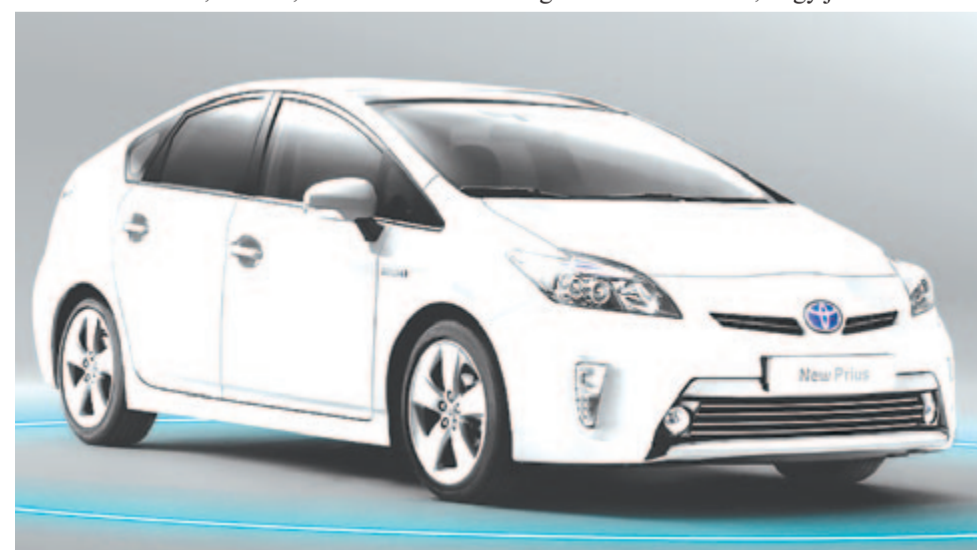
A hibrid autók jelképének számító Toyota Prius

A Toyota globális szintű eladásai idén júniusban valamivel kevesebb mint 796 ezer autóra csökkentek, ami 12,9%-os visszaesés