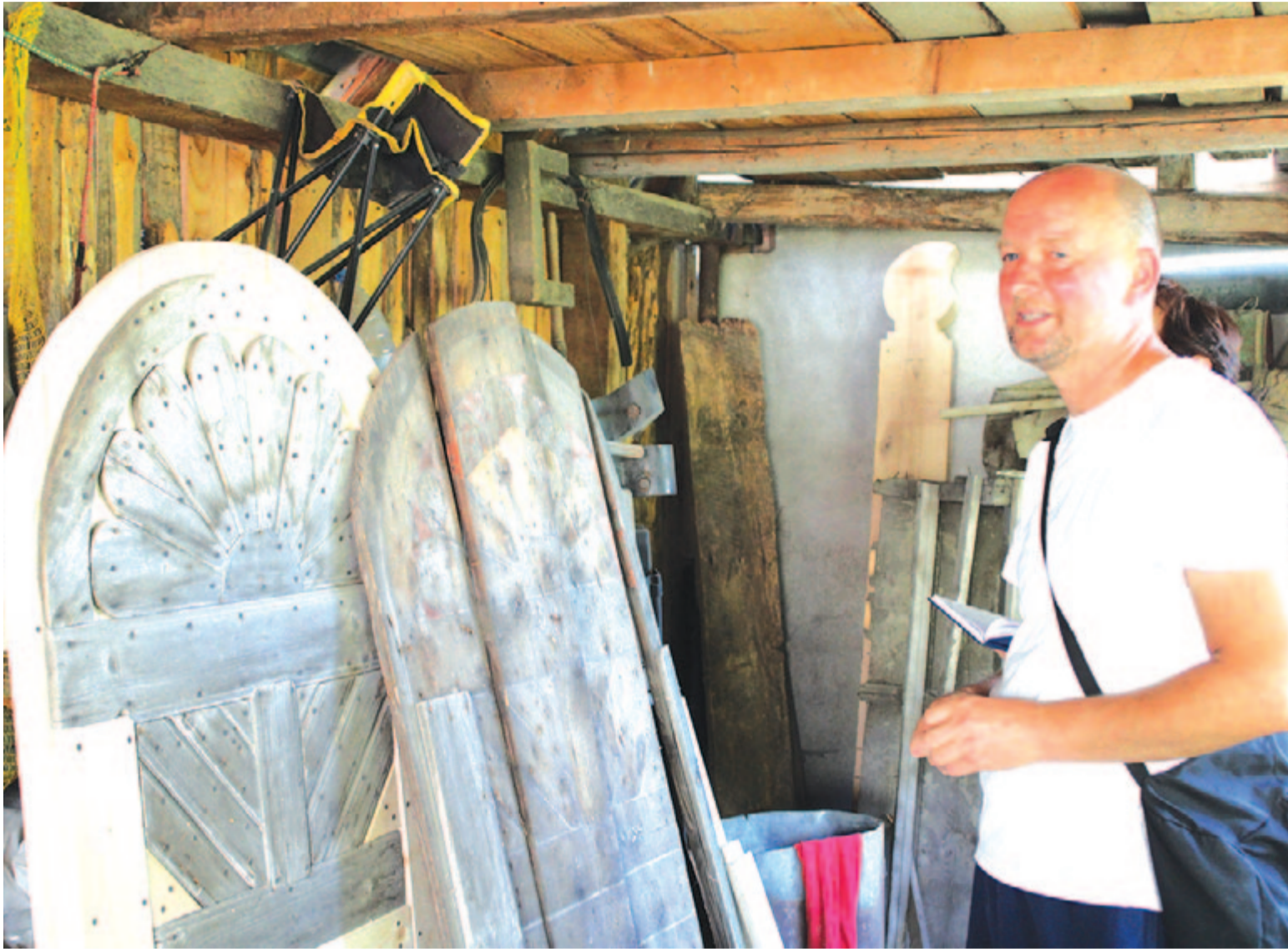
Makfalvi vendégoldalunk a 6. oldalon