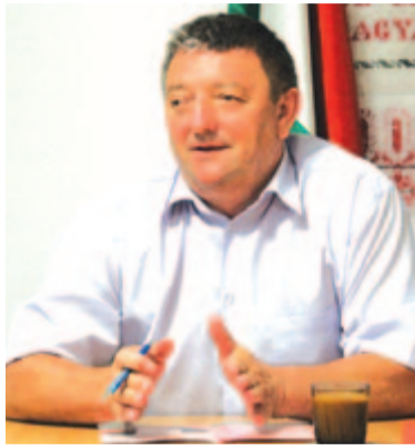
Vass Imre polgármester

– A község területén, Makfalván és Hármásfaluban van ivóvíz- és csatornahálózat, de még mindig maradtak olyan utcák, amelyekben az ivóvíz kevésbé, a szennyvízhálózat pedig nem épült ki. A Hármásfaluban lévő tisztítóállomás, amely tíz éve működik, szintén felújításra szorul. A sok hiányosság kiküszöbölésére el is ké-