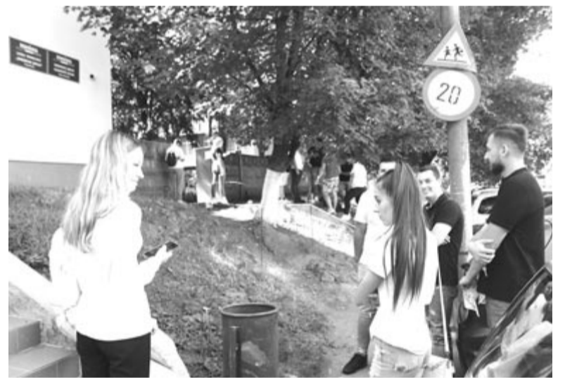
Megbeszélés a vizsga után

Marosvásárhelyen az Egyesülés Főgimnáziumban és a Şincai Technológiai Líceumban, Szászrégenben a Lucian Blaga Elméleti Líceumban, Segesváron a technológiai líceumban és a hozzá tartozó dicsőszentmártoni, szováti és marosludasi albizottságokban folynak az írásbeli vizsgák. A dolgozatokat, amelyeket számítógépen továbbítanak, a marosvásárhelyi Gheorghe Marinescu Elméleti Líceumban működő javítóközpontban értékelik. (b.)