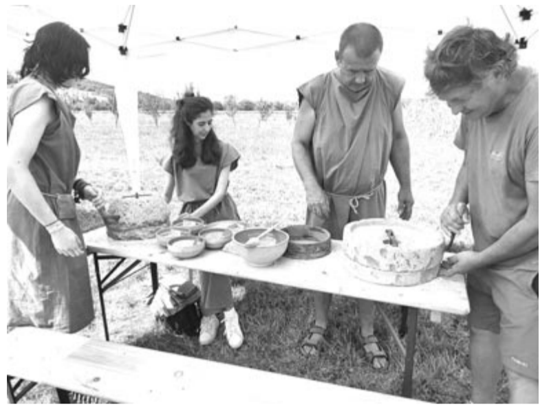
Számos múzeumpedagógiai műhelyben lehetett ismereteket szerezni az ókori életmódról

A következő napokban az ókori tábor parancsnoki épületének belső udvarán folynak még a kutatások, ahol az épület kétoldali belső tornácát és az udvart tárták fel, míg a civil településen folytatott feltárások a napvilágra hoztak két kétezer éves, de jó állapotban maradt, egykori római úthoz igazodó épületet, amelynek egyike lakás volt, a másik egy kisipari műhely, erre utal az itt talált vassalak, fűjtatócső, csontok,