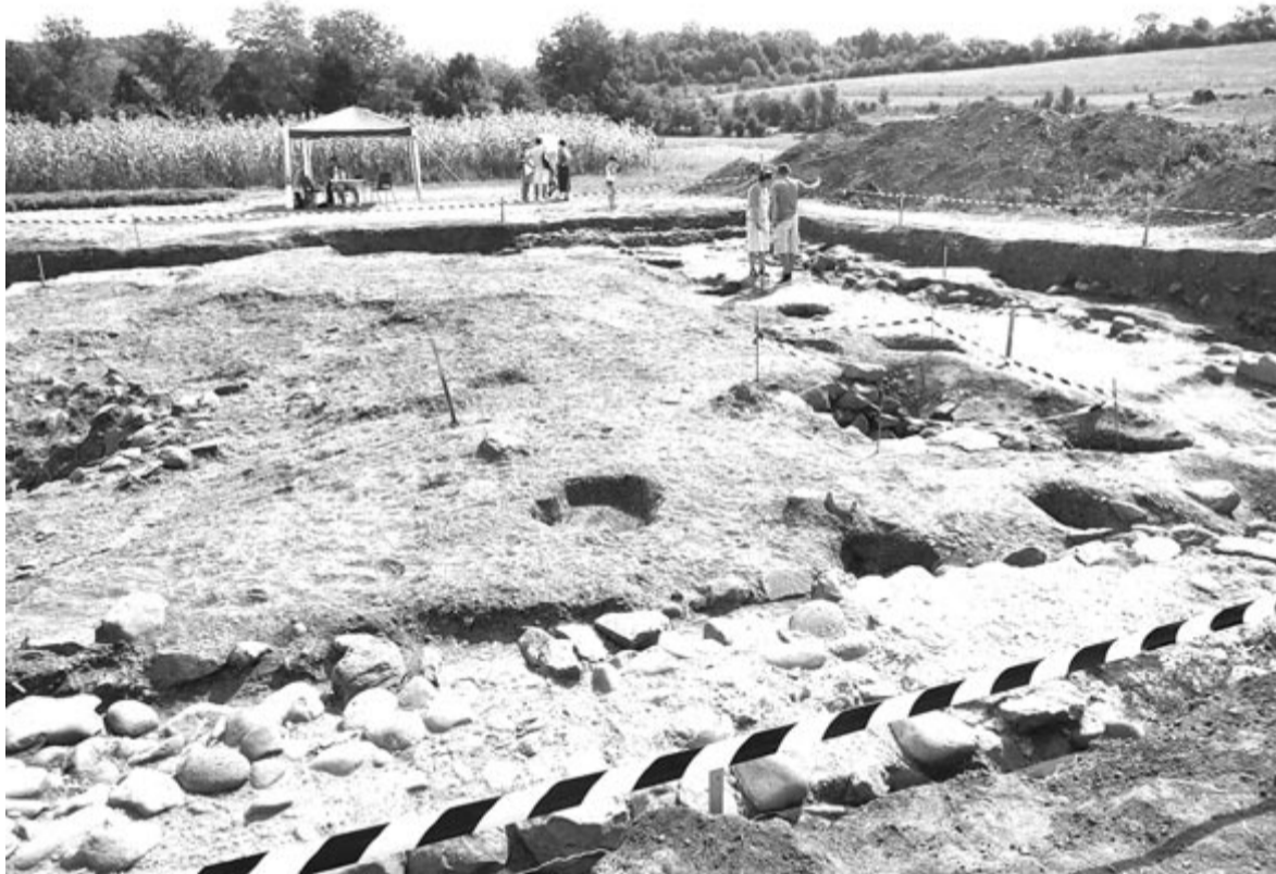
Több helyszínen is meg lehetett tekinteni a most zajló régészeti feltárásokat

Az ideai rendezvény támogatói a Maros Megyei Tanács, az Erasmus+ program TRoHELD3 BIP és a Limes Nemzeti Program voltak, a szervezők között még ott található a helyi Csúrszínház Egyesület is.