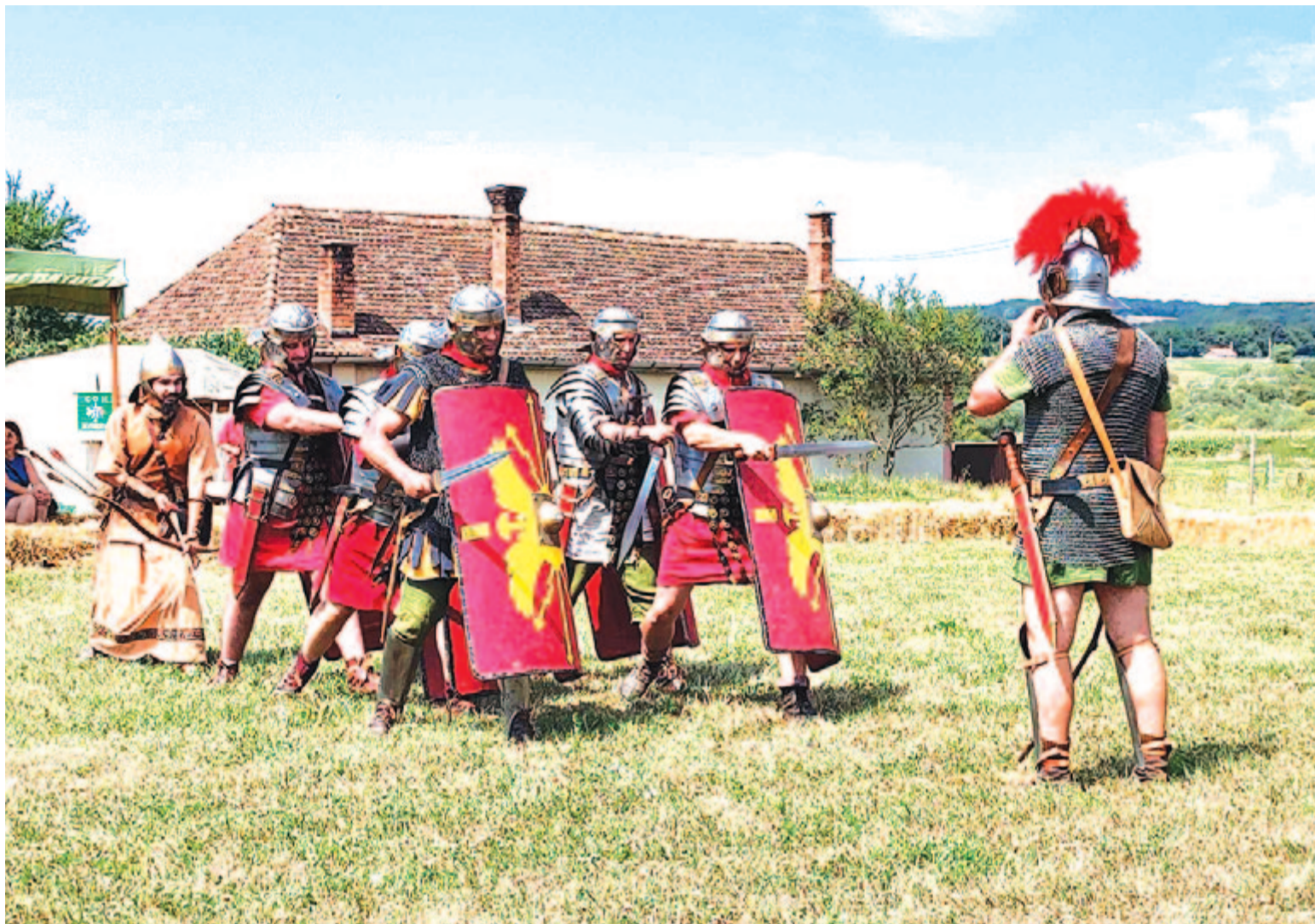
Nem maradhat el ilyenkor a római katonai bemutató