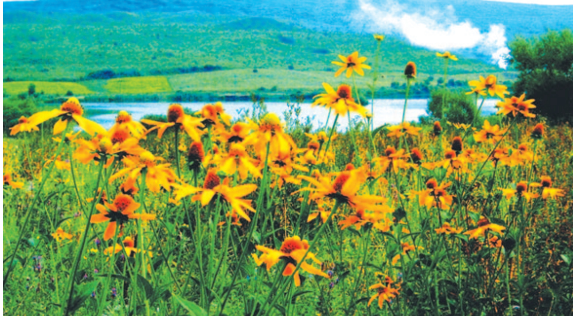
Idegenhonos magas kúpvirág térhódítása a Faragói-tónál, 2006 – kertből kiszökött dísznövény

Harminc éve az ökológia inkább elméleti tudomány volt, de mára sokkal erősebbek a gyakorlati alkalmazhatóságai. Új technológiákat, DNS-módszereket használnak, ren-