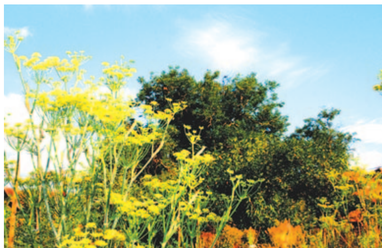
Őshonos kapor kínálja augusztus kegyelmes egének aranyát, Szőkefalva, 2012