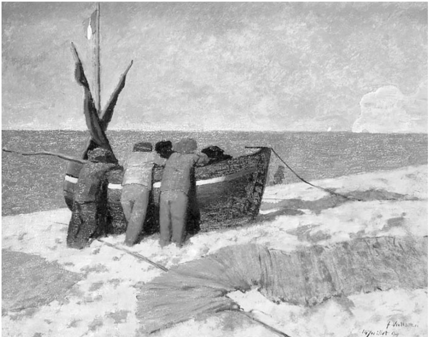
Felix Vallotton: Július 14-e Etretat-nál, 1899

65 évvel ezelőtt, 1959. július 17-én született A Költő. Kegyelettel emlékezünk rá.