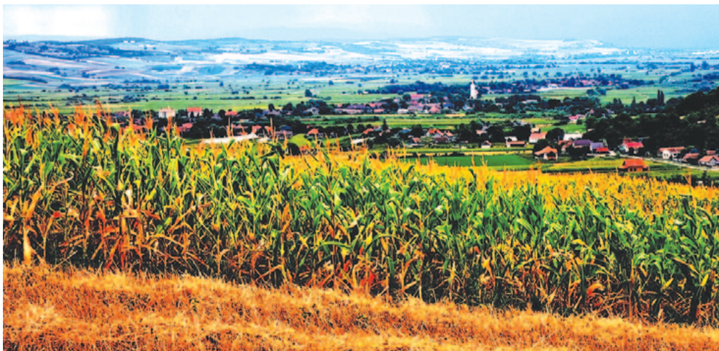
Messze, hol az ég a földet éri – nyáradmenti táj

Maradok kiváló tisztelettel Kelt 2024-ben, aratás havának 12. napján