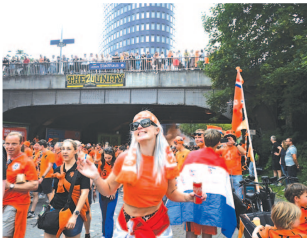
Holland szurkolók vonulnak a németországi labdarúgó Európa-bajnokság elődöntőjében játszott Hollandia – Anglia mérkőzésre a Westfalen Stadionhoz Dortmund belvárosában 2024. július 10-én.

A vasárnap 22 órakor kezdődő berlini döntőben az idei Eb-n százszázalékos és három végső sikerükkel csúcstartó spanyolok várnak majd a sorozatban második fináléjukra készülő és első diadalukra hajtó angolokra.