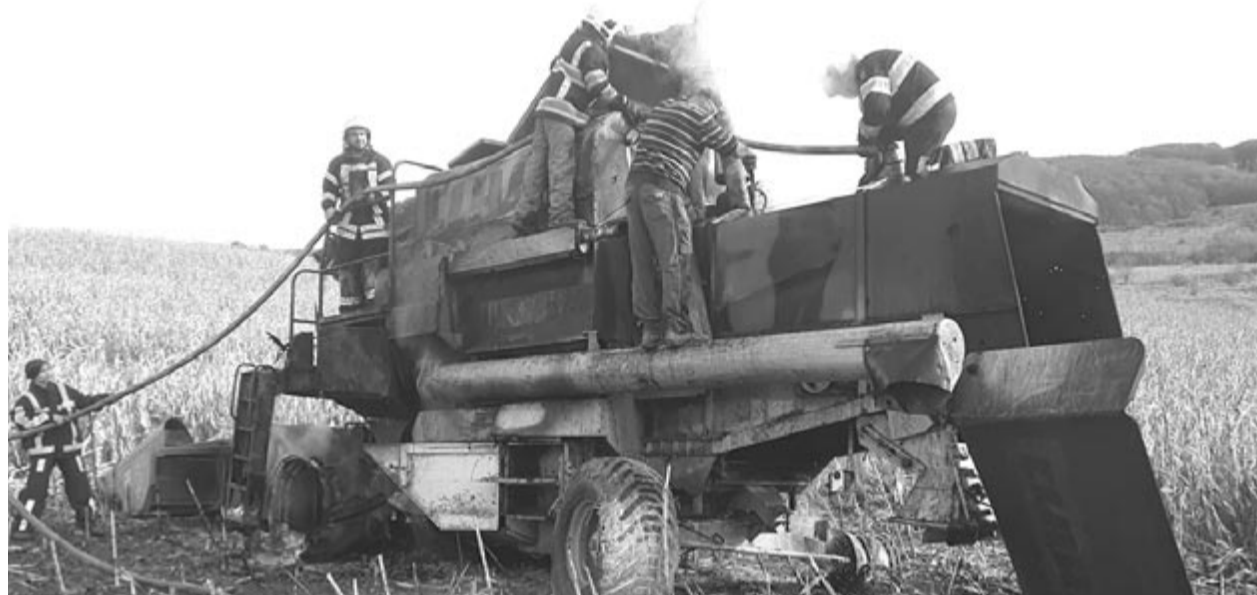
Nemcsak a termés, hanem a haszonjármű is a tűz áldozata lehet betakarításkor

A szél miatt gyorsan terjedő tűz és a magas hőmérséklet emberáldozatokat és jelentős anyagi károkat is okozhat. Ugyanakkor nem szabad megfeledkezni arról sem, hogy ezek az ellenőrizetlen tüzek emberáldozatokkal járó közúti balesetekhez is vezethetnek a látási viszonyok csökkenése miatt – szól a megyei intézmény figyelmeztetése.