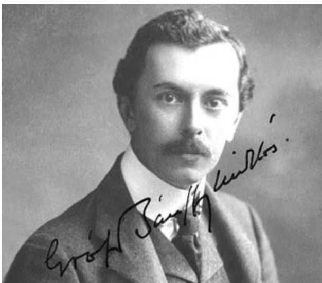
Bánffy Miklós 1920 körül

Főúri származás, egészség, tehetség, műveltség, tágabb cselekvési tér – és a huszadik századi arisztokráciánkat érő meghurcoltatások közepette sírig tartó hűség, felelősségtudat és kitartás jellemezte gróf Bánffy Miklós t. Bánffy Miklós (Kolozsvár, 1873. dec. 30. – Budapest, 1950. jún. 6.) ős- és családfája IV. Béla koráig vezethető vissza. 60.000 holdas földbirtokkal az ország egyik leggazdagabb emberének számított, de vagyónál jóval nagyobb volt vágya, hogy hazájának hasznára legyen. A soktehetségű alkotóművész (író és grafikus) fontos közéleti, lényeges politikai szerepet is betöltött Magyarországon, illetve Erdélyben. A magyar Nemzeti Színház és Opera igazgatójaként egyedül az ő érdeme volt, hogy Bartók Béla műveit játszani kezdték a zenészek (saját zsebből fizette a zenészek díját, hogy megtanulják Bartók műveit). 1916-ban Kós Károllyal közösen szervezték-tervezték IV. Károly koronázási ceremóniáját; Bánffy háborúellenes menetet iktatott be a díszes felvonulásba a hadirokkantak felvonul-