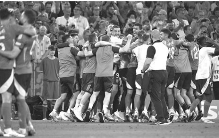
A spanyol csapat ünnepli győzelmét a Franciaország elleni Eb-elődöntős mérkőzés után.

amely megmutatta a benne rejlő és korábban is látott potenciált. Néhány dolgot csinálhattunk volna jobban egy olyan riválissal szemben, amely ennyire sokat birtokolja a labdát. Küzdöttünk a végsőkig, de megvannak a határaink, más okokból. Voltak nehézségeink, és ez volt a hatodik Eb-meccsünk, ezért talán az energiaszintünk is alacsonyabb volt, mint kellett volna” – zárta értékelését az 55 éves francia kapitány.