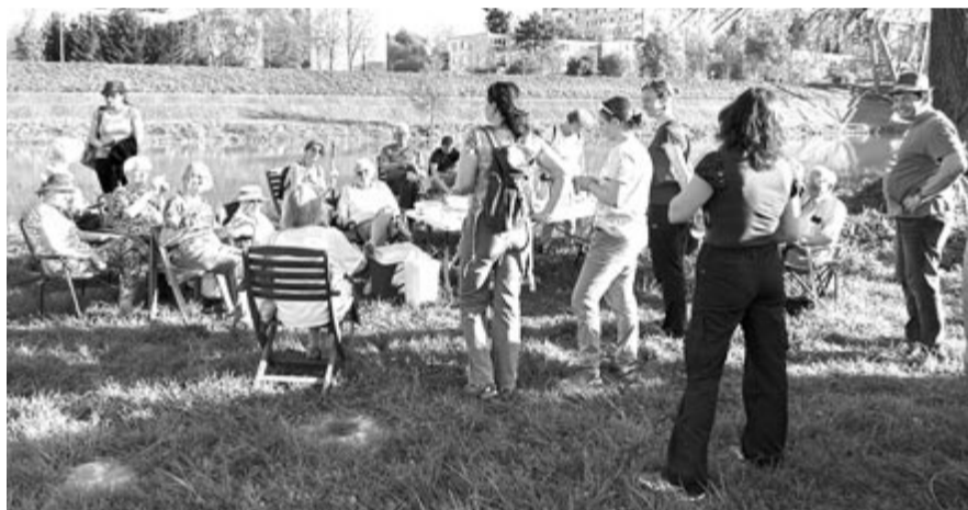
Séta a Maros-parton