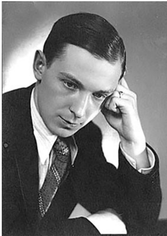
Dsida Jenő 1930 körül

Méltatlanul röviden érintjük, de feltétlenül szólnunk kell témánk kapcsán Dsida Jenő ről, akit nem a gyilkos háború, hanem betegség vitt el idő előtt. Dsida Jenő (Szatmárnémeti,