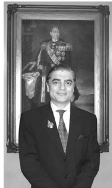
Pál Fülöp herceg

A román királyi család hivatalosan el nem ismert tagját 2020 de-