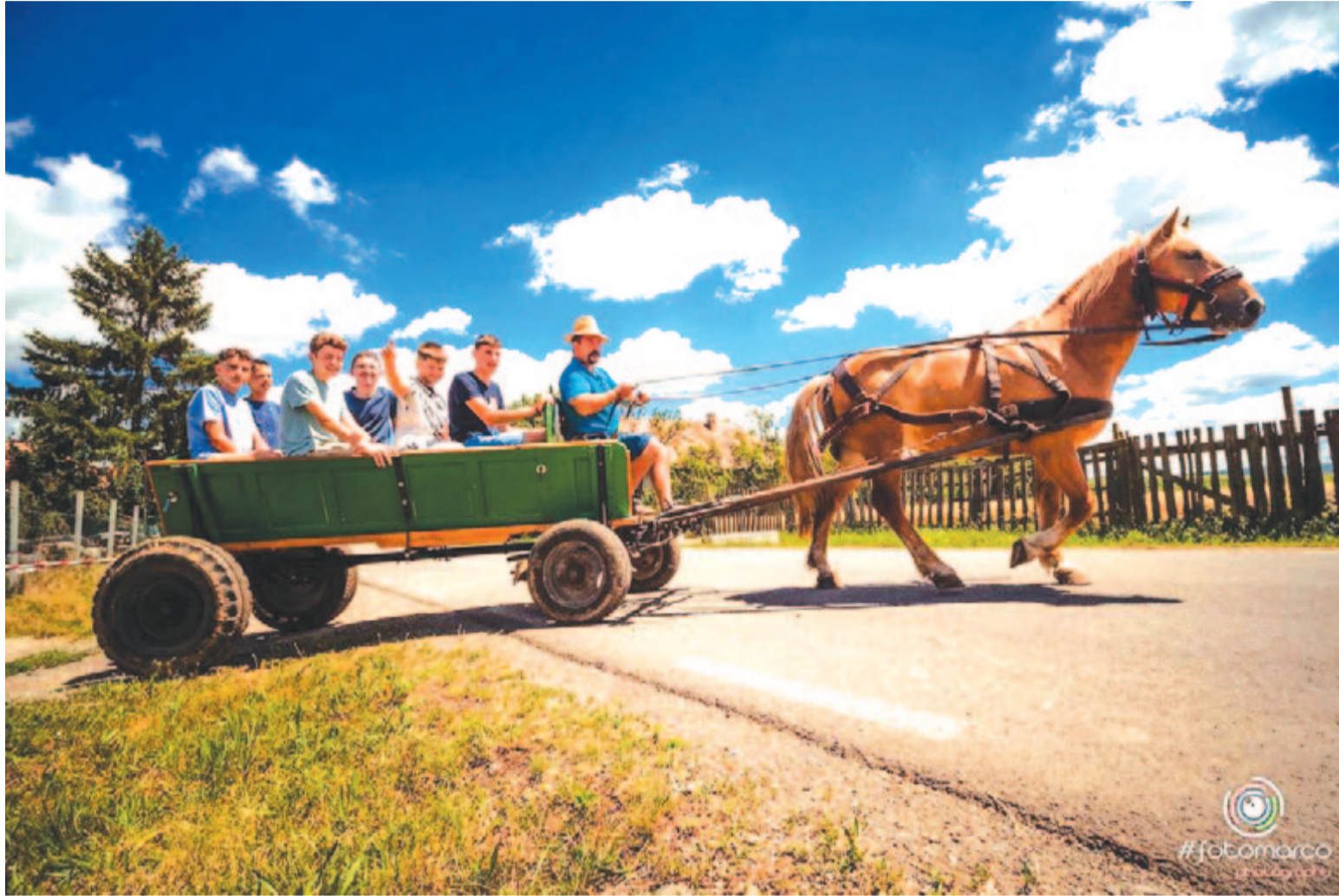
Vajdaszentiványi Népművelési Központ a 6. oldalon