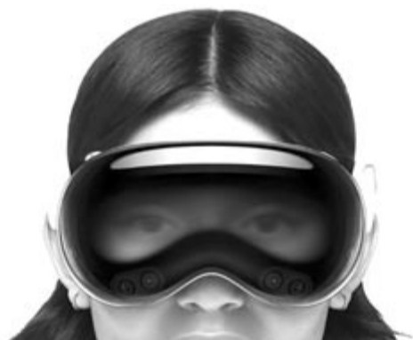
Apple Vision Pro

A kínai márkák közül nem csupán a Huawei növelte az eladásait, ez a Xiaominak is sikerült, méghozzá 38%-kal, továbbá a dél-koreai Samsung is enyhé, 4%-os, növekedést könyvelhetett el. Viszont az Apple 12%-ot veszített, bár még ezzel is meg tudta őrizni abszolút értékben a piacvezető helyét. A felsorolásból nem szabad kifejeitni a Noise márkát, amely viszonylag ismeretlennek számít, legalábbis az előzőkhöz képest, ám a 2024 első negyedévi részesedési adatok szerint globális szinten az ötödik legnagyobb.