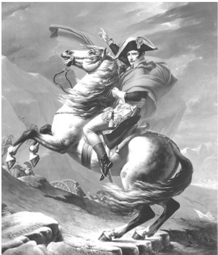
Napoleon átkel az Alpokon (1800)

től később utódai örökölték. A vásárló a fegyverek eredeti dobozát is megkapta, valamint több kiegészítő kelléket, köztük egy puskaporttartót és töltővesszőket. (MTI)