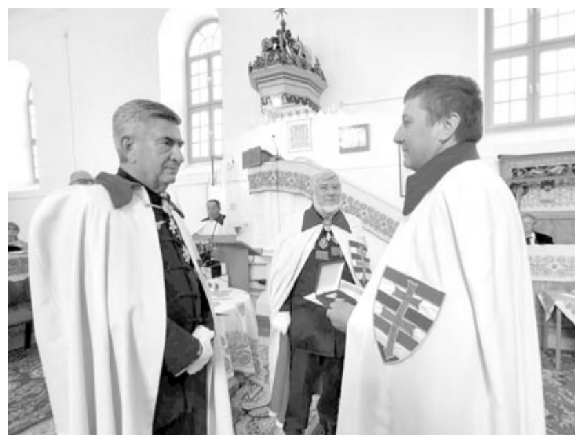
A rend számára fontos, hogy értékelje a munkát – idén egy lovag kapott elismerést