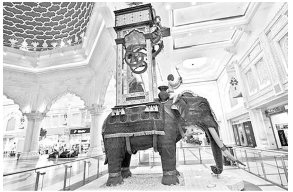
Az elefánt, hátán az órával

A híres mérnök szemmel láthatóan sok szerkezetét víz segítségével működtette. Amint a sivatagban a víz jelentette az életet, úgy a gépezeteknek is a víz adott erőt a működéshez. Ismail al-Jazari rendkívül sok szerkezetet épített, de mérnöki tevékenységének