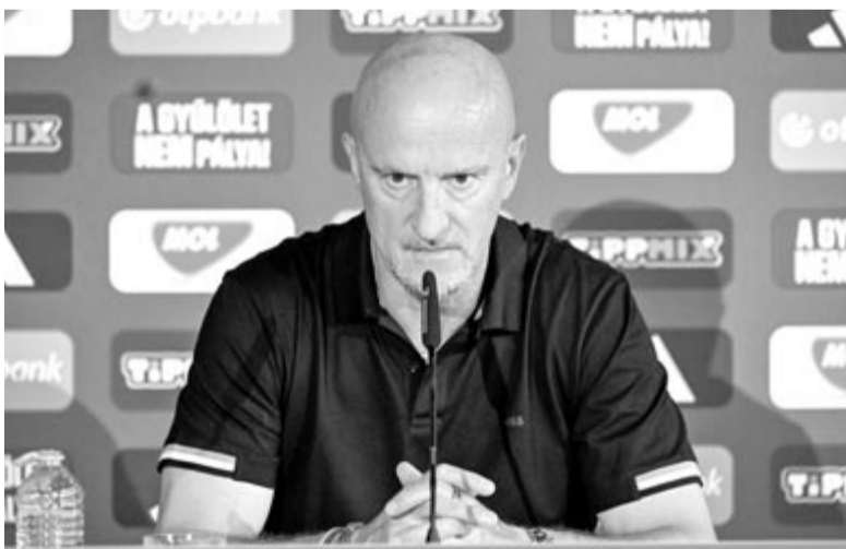
Marco Rossi szövetségi kapitány a németországi labdarúgó-Európa-bajnokságról kiesett magyar labdarúgó-válogatott sajtótájékoztatóján Weiler-Simmerbergben 2024. június 27-én. A magyar csapat előző nap nem jutott tovább, mivel a csoportkör végén a harmadikok tabelláján a nyolcaddöntőről éppen lemaradó ötödik helyen zárt

Az olasz szakember – akivel kapcsolatban több olyan cikk is megjelent a búcsút követően, hogy akár távozhat is a pozícióból – megköszönte a támogatást, és jelezte, hogy az Európa-bajnokság ta-