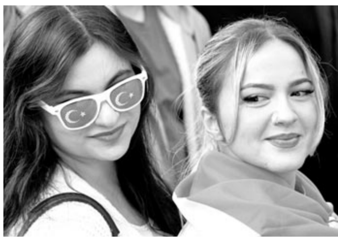
Török szurkolók a németországi labdarúgó-Európa-bajnokság nyolcaddöntőjében játszott Ausztria – Törökország mérkőzést nézik a dortmundi szurkolói zónában 2024. július 2-án

Ekkor úgy tűnt, eldőlt a mérkőzés, az osztrákok azonban nem adták fel, és a szakadó esőben folyamatosan támadtak, majd egy szöglet után gyorsan szépítettek: a 66. percben Sabitzer jobb oldali szögletét hét méterről megcsúsztatták, a hosszú oldalon