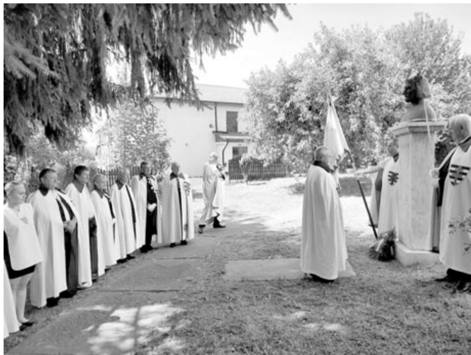
Szent László lovagjai Szent István szobránál koszorúztak

Ez nem merül ki a rendszeres disznóvásásokban és karácsonyi ajándékozásban, a többi rendtagokkal közös projektje az abodi otthon épületének javítása is. „Fontos, hogy konkrét dolgokat is letegyünk az asztalra” – mondta a székeltartó, és ilyen ez a célkitűzés is: a felújított épületet a szeptemberi iskolakezdésig szeretnék átadni.