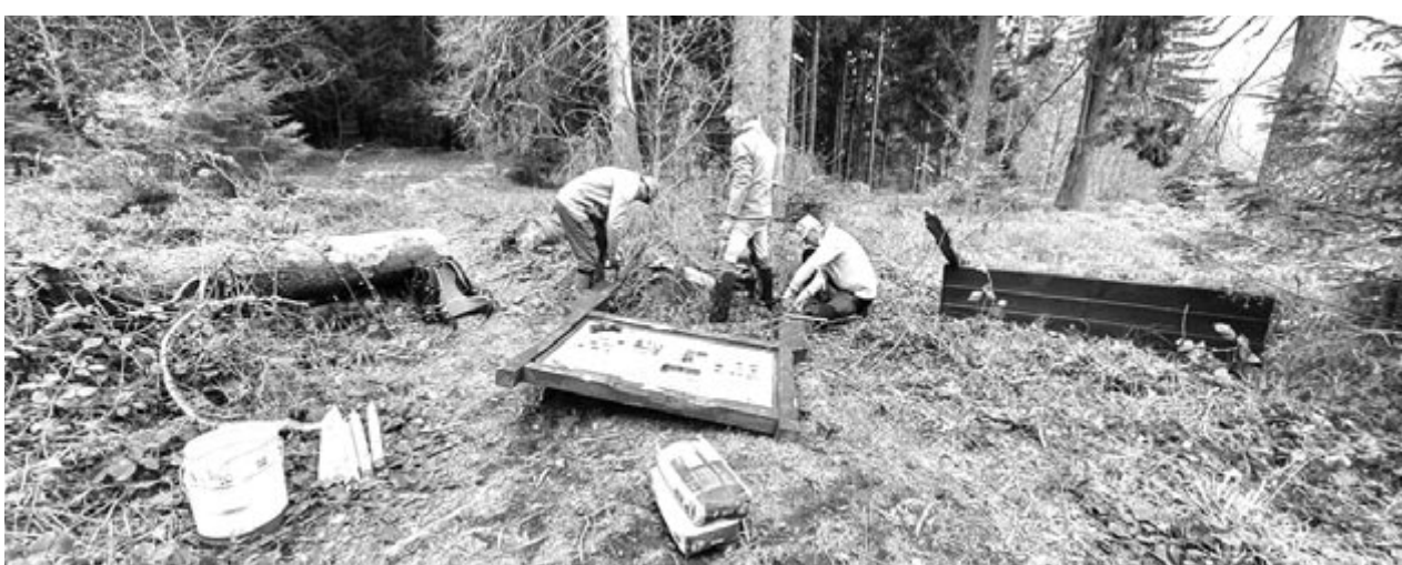
Helyreállítási munkálatok az Istenszéken