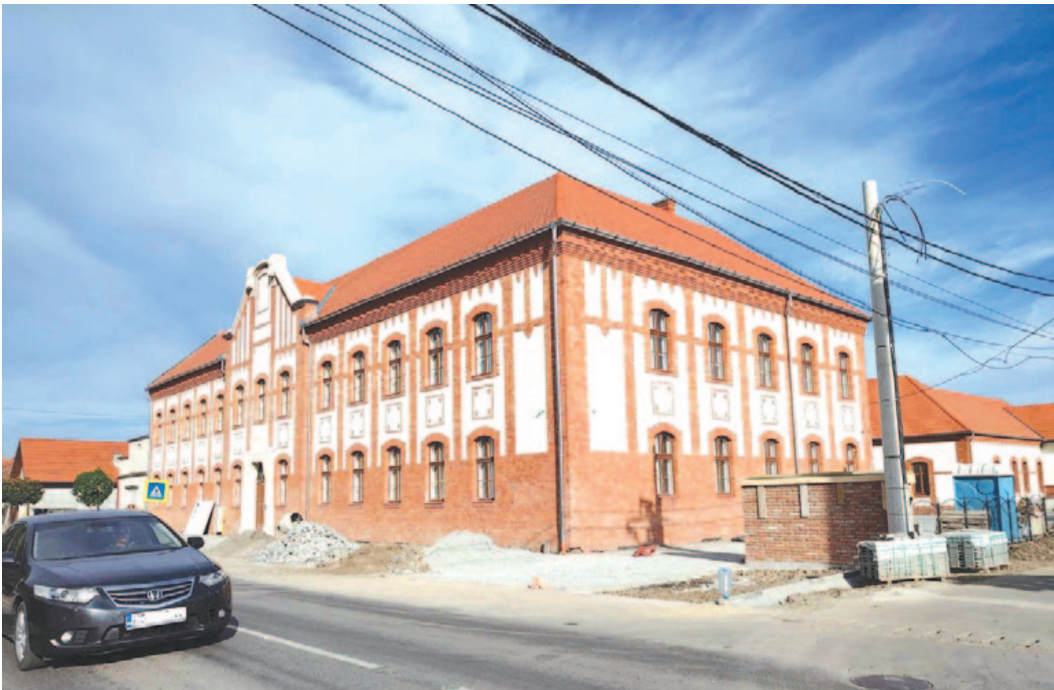
A gazdaságfejlesztési terv egyik fontos eleme a hamarosan nyíló inkubátorház