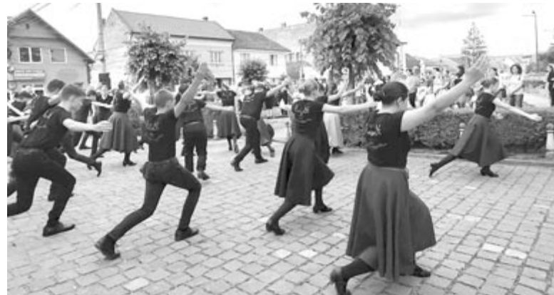
Az ünneplés villámcsődülettel és a Kis-Bekecs performanszával kezdődött

val. Az előjáró örömet fejezte ki, hogy vallási és nemzeti ünnepeink mellett június 4. és október 6. is kezd bevonulni a köztudatba, majd elmondta: Egy éve beszélgettek egymással azok, akik számára Nyáradszereda nemcsak infrastruktúrában, hanem közösségépítés szempontjából is fontos, és idén a június 4-i megemlékezés megszervezése már szinte magától jött. Amikor látjuk a magyar kormány küzdelmeit Brüsszellel, az a modern politika háborúja, ezért van az, hogy ma a magyarok békét akarnak.