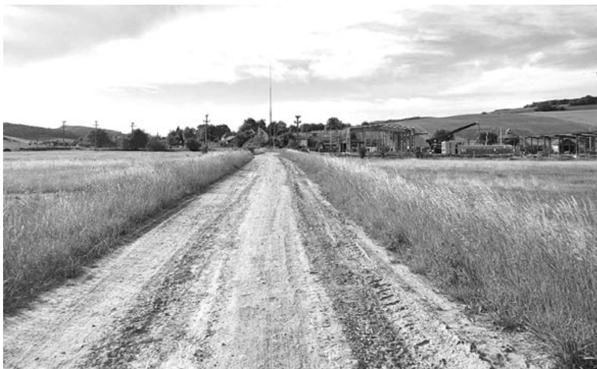
A Székelytompa és Demeterfalva közötti út két oldalán épülhetne ki az ipari park

Az ipari parkot egy kínálkozó lehetőségnek tartják, amióta jóvá-