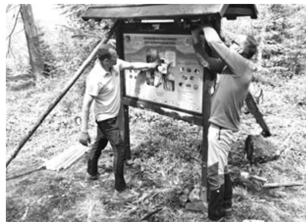
Információs pannó helyreállítása.

Egyedüli megoldás az ilyen tettek elkerüléséért, hogy hétfőnként a szolgálatos hegyimentők mellett önkéntes természetvédők is felügyelik a területet, és amikor szükséges,