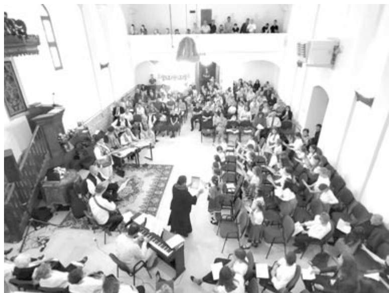
Szűknek bizonyult a templom a sok énekes és az érdeklődők számára

Nyáradszeredából is azt kell üzeni mindenkinek, aki az összetartozás napját ünnepli – és főleg azoknak, akik nem –, hogy érdemes minden június 4-én ünnepelni. Ezen a napon nem a nevek, politikai pártok vagy nézetek a fontosak, hanem az, hogy egymás mellett állva hallatni kell a hangunkat minden vallási és nemzeti ünnepünkön és megemlékezésünkön – biztatott mindenkit a városvezető.