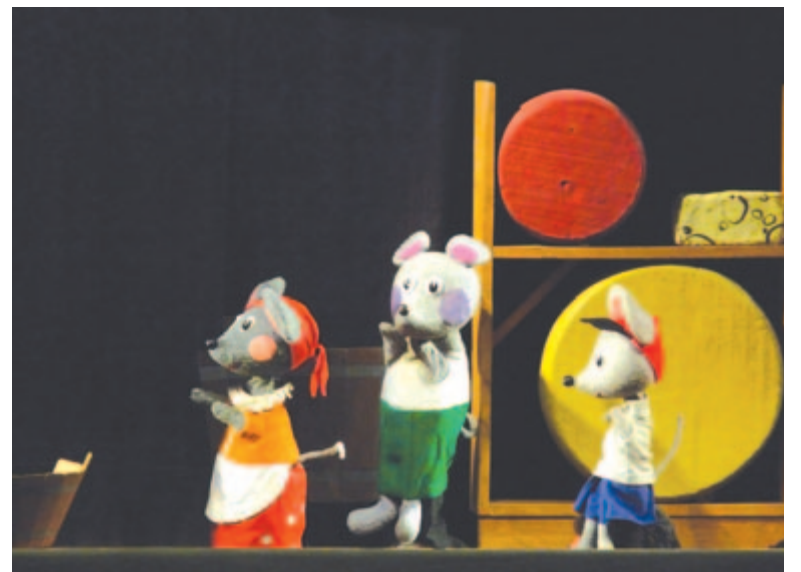
Minden egér szereti a sajtot

– A paraván mögött való kilépés ma már teljesen természetessé vált ebben a művészeti ágban, bár régen is előfordultak élő szereplős előadások. Ami változatlanul megmaradt, az a történetmesélés, a csoda megjelenítése, az „itt és most” varázsa, az, ahogy a színész, a báb és a nézősereg együtt lélegzik.