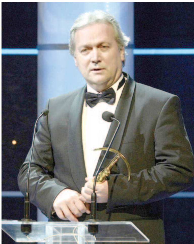
A Prima Primissima díj átvevőjeként

– Azért, mert egyszerűen nem tudják, hogy mitől bolondul meg a béta-szekretáz nevű enzim, miért kezd el rossz helyen hasítani, amikor normális körülmények között adott, hogy hol kell azt a fehérjét félbevágni, és akkor utána minden rendben van. Mint említettem, egyszer valami miatt elkezd rossz helyen hasítani, a miérte pedig csak feltételezések vannak. Az egyik, talán legnépszerűbb hipotézis az agyi vérellátás csökkenésére vezeti vissza, és az agy-érelmeszesedéstől kezdve mindenféle olyan problé-