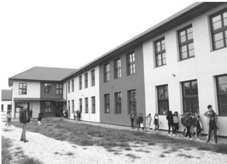
Az ádámosi felsőtagozatos iskola