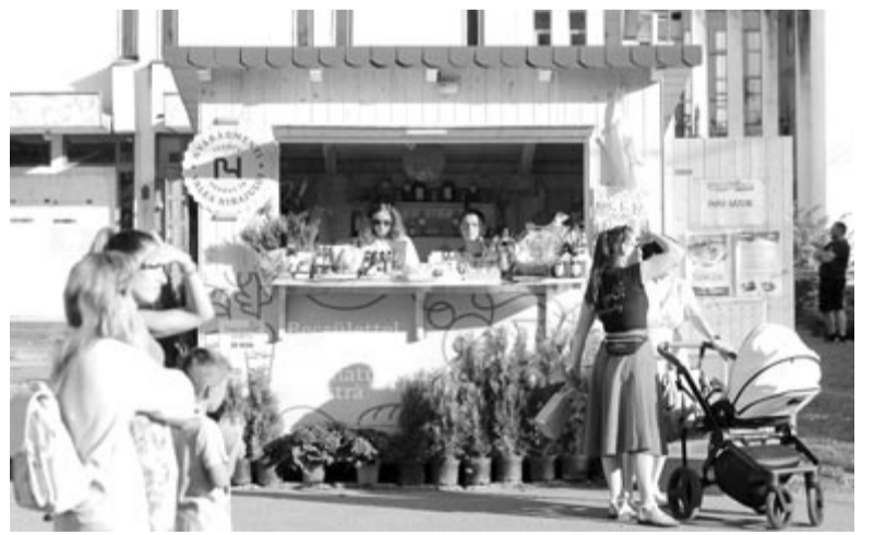
Már tavaly nyáron sokan érdeklődtek a helyi termékeket bemutató kis faházikók iránt

cégeknek a márkák, marketing és kommunikáció terén elismert szakemberei ülnek, mint a Nestlé, Coca-Cola, Bayer, Vodafone, Landor&Fitch vagy Pentagram, és ennek a bizottságnak a tetszését elnyerte a Rubik cég merész elképzelése és stratégiája. Ez a díj az első, amellyel romániai mezőgazdasági-vidékfejlesztési márkanévet jutalmaz a rangos szakmai zsűri. Az elismerés bizonyítja a nyárádmenti projekt szükségességét és hasznosságát, ugyanis kommunikációs stratégia és márkanév nélkül a vidéki kistermelők által előállított értékek és termékek nem kerülnek piacra, nem jutnak el a célcsoporthoz, azaz a fogyasztókhoz, vásárlókhoz. Nem utolsósorban ez az elismerés a projektszervezők odaadását is dicséri – véli a kistérségi elképzelést kivitelező személyzet.