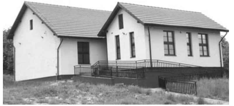
Az iskola sportterme

Arra a kérdésre, hogy miként kezelik a problémás gyerekeket, illetve jellemző-e az iskolai agresszivitás, az intézményvezető nemmel válaszolt. A konfliktusok kialakulását úgy próbálják megelőzni, hogy a szünetekben minden pedagógus kint tartózkodik a gyerekek között, ezáltal sikerül fenntartani a fegyelmet. Másik sajátos módszer, hogy pályázatok révén ingyenes kirándulásokat szerveznek, amelyeken a jó magaviseletű diákok vehetnek részt. Mivel a szerény körülmények között élő gyerekek hálásak azért, hogy olyan helyekre látogathatnak el, ahol sosem jártak, versengenek, hogy felkerüljenek a fegyelmezett diákok listájára. „Elég sok az olyan gyerek, aki Dicsőszentmárton határain túlra sem jutott el. Ezért nagy az öröm, ha kirándulást szervezünk. Ellátogattunk a szebeni karácsonyi vásárra, Kolozsvárra, Beszterce megyébe stb. Olyan diákunk is van, aki a tordai sóbányában letérdelt és