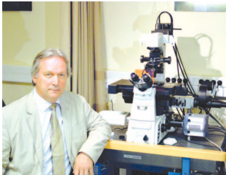
Az új mikroszkóppal

mára, ami az agy vérellátását csökkenti. De ez önmagában szintén beindít más egyéb mechanizmusokon keresztül is memóriazavart. Sokan mondják, hogy ha egy mikrokéményseprőt be lehetne küldeni az érrendszerünkbe, és ez belülről kitarítaná az ereket, akkor évtizedekkel meg lehetne hosszabbítani az ember életét, mert nagyon-nagyon sok betegség vezethető vissza az idegrendszer és a vegetatív idegrendszer kóros működésére. Még a rák is, hiszen az immunrendszerünk arra van kitalálva, hogy a testünkben naponta képződő ráksejteket fölismerje és kilöktse. Ha az immunrendszerünk nem működik rendesen, mert nem kapja meg a vegetatív idegrendszerrel a megfelelő „rugdosást” és szinten tartást, ha alulműködik, akkor a keletkező ráksejtek meg tudnak telepedni, és el tudnak kezdeni burjánzani. Tehát még a rák is visszavezethető az idős kori agyi funkció lassú leépülésére. Ezért kell nagyon odafigyelni az érrendszerünk állapotára, mert például a dohányzás nagyon súlyosan fokozza az érlemezese-