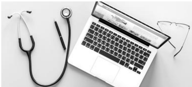
Internetes orvoslás, illusztráció

ijesztetetés, az ok nélkül kikövetkeztetett biztos halál gondolata pedig egyáltalán nem segít. Továbbá, ha jó diagnózist állít fel az internet, és valós gyógyszereket is ajánl, akkor is felmerül az a kérdés, hogy vajon meg tudjuk-e vásárolni az adott orvosságot recept nélkül. Ha pedig kell recept, akkor amúgy is el kell menni orvoshoz, továbbá az internet nem lehet tisztában azzal, hogy esetleg milyen gyógyszerre vagyunk allergiások, vagy esetleg milyen más gyógyszert szedünk, amit nem szabad a javasolt orvossággal együtt bevenni. Tehát sok mindenre jó az internet, sok új tudást lehet megszerezni a használatának köszönhetően, azonban akkor, amikor az egészségünkről van szó, kérdezzük meg a szakembereket, és higgyünk az ő szavunknak!