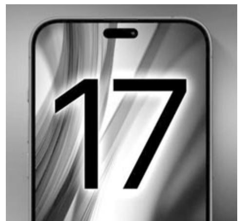
iPhone 17 Slim-konceptió, illusztráció

Bár még nagyon messze vagyunk a bemutatótól, amivel kapcsolatban az is kétséges, hogy valaha megtörténik-e, már a kameráról is lehet tudni néhány részletet. Úgy hírlik, hogy mind a négy modell – a sima, a Slim, a Pro és a Pro Max – 24 megapixeles előlapi kamerát fog kapni, ami mindenképpen előrelépés a mostani 12 megapixeles egységhez képest. A történetben az az igazán különleges, hogy jelen állás szerint még nem lehet tudni, hogy az idén szeptemberben megjelenő iPhone 16 modellcsaládnak hány megapixeles előlapi kamerája lesz.