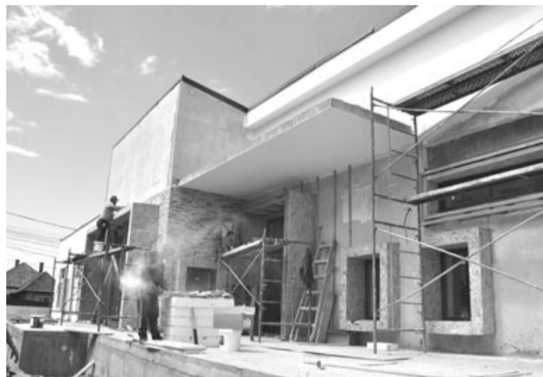
Épül a megye legkorszerűbb bölcsődéje

– Az oktatási intézmények is nagyon szépen megújultak, valóban sikerült mindenhol valamit tenni.