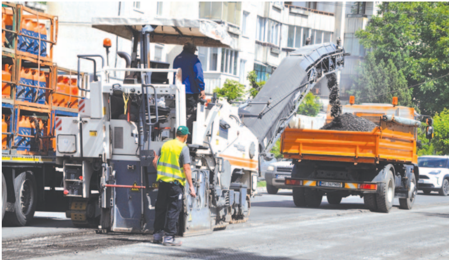
Folyamatban az Egyesülés sugárút felújítása