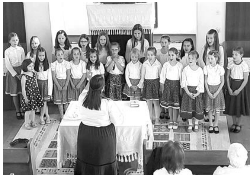
Egyházi énekek, pünkösdi nép- és gyermekdalok csendültek fel