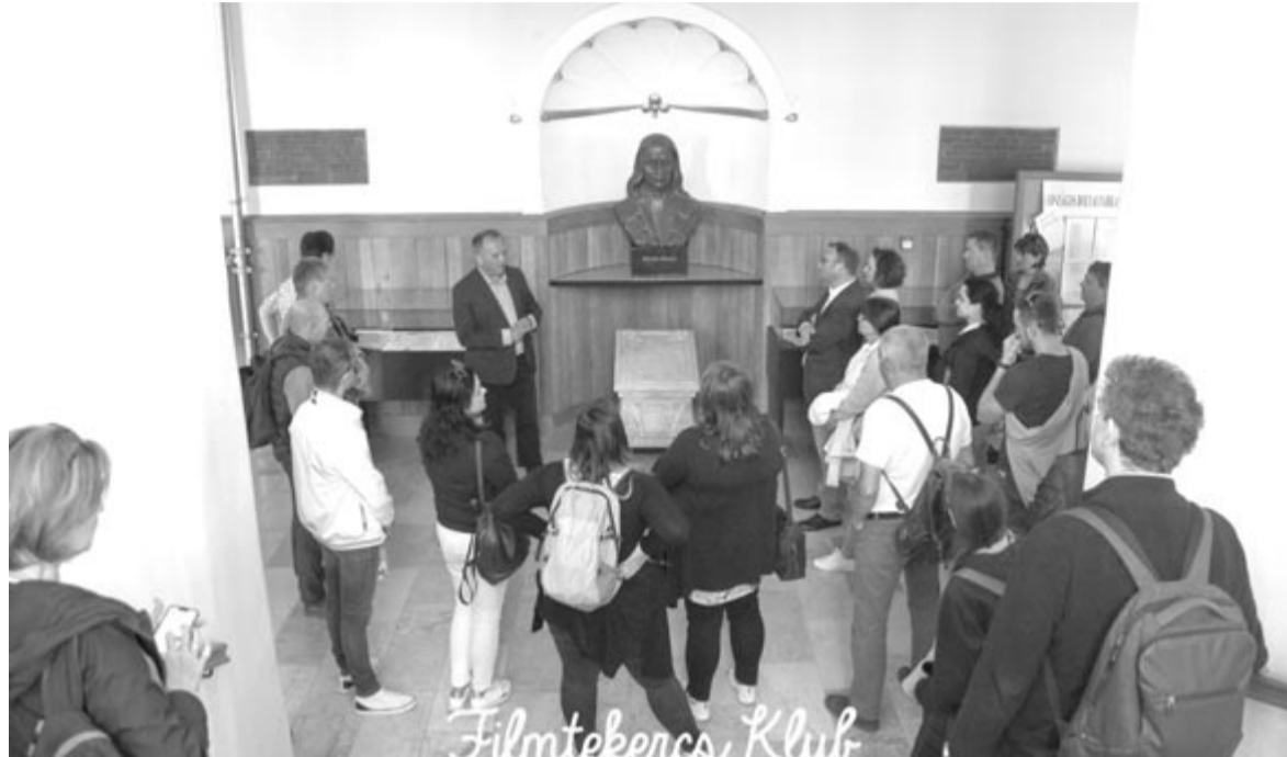
A szombathelyi Bolyai János Gimnázium tanárainak látogatása a marosvásárhelyi Bolyai Farkas Elméleti Líceumban.