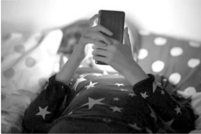
Gyermek szexuális zaklatása, illusztráció

A négy vállalat közleményében azt ígéri, hogy mindent el fog követni annak érdekében, hogy ne lehessen szexuálisan zaklatni és kizsákmányolni a gyerekeket a mesterséges intelligencia segítségével. Maga a kezdeményezés amúgy nem a vállalatoktól, hanem az All Tech Is Human és a Thron nonprofit szervezetektől származik. Utóbbi közlése szerint a négy cég vállalása úttörőnek tekinthető, és komoly előrelépést jelent a gyermekvédelem tekintetében. A Thron szerint az utóbbi időben fajsúlyosan megnőtt azon bűncselekmények száma, amelyeknél a pedofilok mesterséges intelligenciát használtak. A szervezetnek csak az Egyesült Államokban 104 millió kizsákmányolt gyermekről van tudomása, az AI térnyerése pedig csak még inkább nehéz helyzetbe hozza őket.