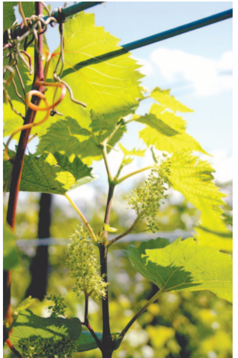
Szőlővirágzás fagyosszentek előtt