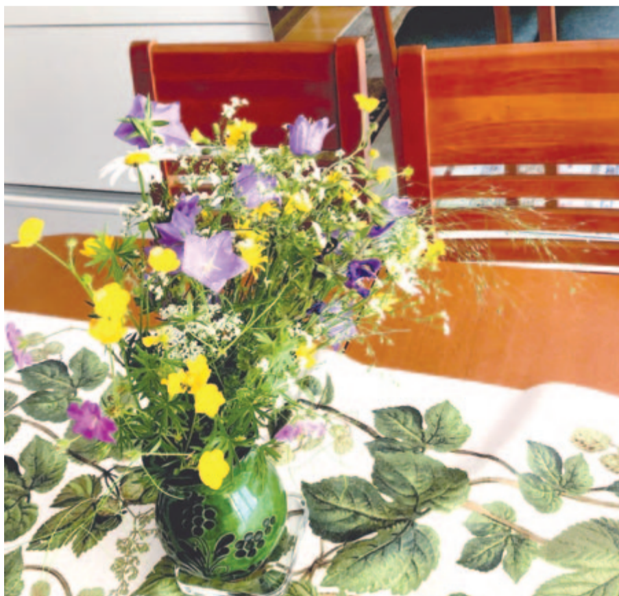
A még napfényes erdő virágcsokor-üzenete