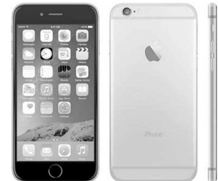
iPhone 6, illusztráció

Ami pedig a batterygate-t illeti, nem kizárt, hogy nem ez az Apple egyetlen ilyen vitás ügye. Vannak arról szóló híresztelések, hogy más termékek esetében is eljárták a szándékos lassítást, vagy valamilyen problémát idéztek elő annak érdekében, hogy a felhasználók kénytelenek legyenek új eszközt vásárolni. Ez nem mentség számukra, de tisztában kell lenni azzal, hogy ebben a kérdésben nemcsak a Cupertino-i vállalat sáros, hanem más cégek is. A Samsung esetében hivatalos szervek is kimondták, hogy szándékosan lassították a régebbi telefonjaikat, valamint most is a közbeszéd és a felhasználói tapasztalat tárgya, hogy 2-3 éven belül a csúcskategóriás (egyben megregrága) dél-koreai telefonok látványosan veszítenek a teljesítményükből.