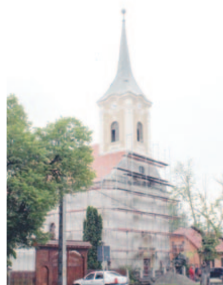
Megújult a szépen ívelt torony

gyülekezetekben szervezett találkozón, nyári táborokban vesznek részt. Aktívan bekapcsolódtak az IKE Váltás irányítói országos programjába, foglalkoznak a vallásörökség korosztályos Shalom néven kilenc tagú ifjúsági keresztyén zenekaruk van, összeforrt csoport, amelynek tagjai közösségi rendezvényeken és más helyszíneken lépnek fel, ahol a sáromberki gyülekezet hírére népszerűsítik – mondja a lelkész, majd megtekintjük a felújítás alatt álló templomot, amelynek a belső falai is már megszüpültek.