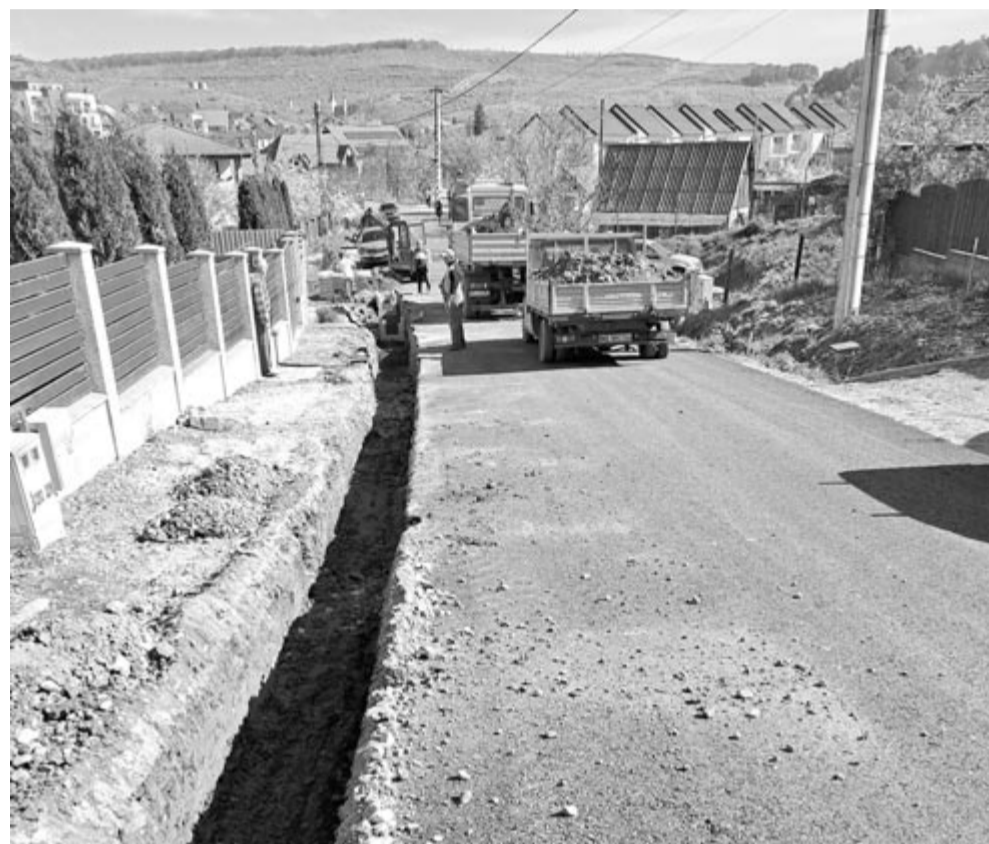
Idén egyelőre csak saját pénzalapból korszerűsítenek utcákat

Az utcák korszerűsítése nem kis feladatot jelent a megyeközpont szomszédságában fekvő község önkormányzatának, ugyanis az utóbbi években számos ingatlan-beruházást végeztek, de a magánpénzeiből kiépült lakó-sorokon az önkormányzat egyelőre nem tud sem közművesíteni, sem aszfaltozni. Ugyanis amikor pénzforrást tudnak azonosítani erre a célra, először azokat az utcákat választják ki, amelyek az adott pillanatban a legfontosabbak. Kebeleszentiványon nemsokára elkezdhetik a csatornázást, most folyik a közbeszerzés, így ezen a településen egyelőre nem jöhet számításba utca korszerűsítés. (GRL)