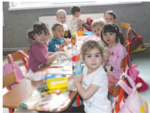
Őszől az új épületben kezdik az évet

Miközben az igazgatókkal bejárjuk az új épületet, arra gondolok, hogy milyen nagyszerű érzés lesz Nagyernyében óvodásnak lenni, és megnyugtató a szülők számára, hogy a munkanap végéig korszerű, esztétikus, kényelmes, szép környezetben, felkészült óvónők, dadusok gondjaira bízhatják gyermeküket. Így kell, így érdemes jövőt építeni, ha lesz kinek!