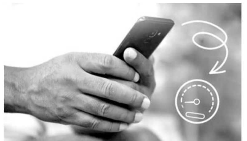
Lassú Samsung, illusztráció

6 év elteltével már nagyon unja a batterygate ügyet. Éppen ezért időről időre komoly összegeket hajlandó arra áldozni, hogy az ügy végre lecsengjen. Nem korrupcióra, megvesztegetésre kell gondolni, hanem arra, hogy például kifizetett 500 millió dollárt egy, az Egyesült Államokban folyó csoportos per rendezésére. Továbbá nem is olyan régen Kanadában egyezett bele egy ottani csoportos kereset kifizetésébe, amelynek értéke 14,4 millió kanadai dollár. Ahhoz, hogy valaki kapjon az utóbbi említett összegből, kanadai lakosnak kell lennie, és rendelkeznie kell egy iPhone 6, 6 Plus, 6S, 6S Plus és/vagy iPhone SE (első generáció) készülékkel, amelyen iOS 10.2.1, illetőleg annál újabb operációs rendszer fut. Az iPhone 7 és 7 Plus modellek tulajdonosai is igényt tarthatnak egy részre abból a 14,4 millió kanadai dollárból, amit az Apple kifizet, ha a készülékükre iOS 11.2 vagy újabb verzió volt telepítve vagy letöltve 2017. december 21-e előtt. Az ügyben eljáró Rochon Genova LLP ügyvédi iroda szerint minden érvényes követelést benyújtott felhasználó 17,5 és 150 kanadai dollár közötti kártérítést fog kapni. A kifizetések pontos összege nagyban attól fog függni, hogy hány kérelem érkezik. Fontos hozzátenni, hogy a perdokumentumok értelmében az Apple minden állítást tagadott, a megegyezés pedig nem azt jelenti, hogy a vállalat beismerte volna a véttségét. Az említett összeg kifizetése vi-