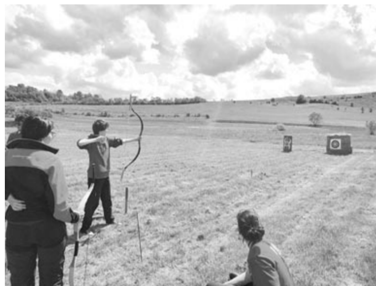
Pajzsokat átütő, igazi nyilvesszőkkel is lehetett célba löni