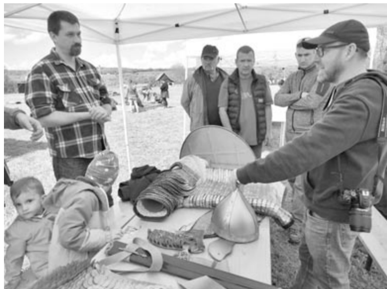
Helyszíni kiállításokon lehetett megismerkedni az itteni régészeti leletekkel