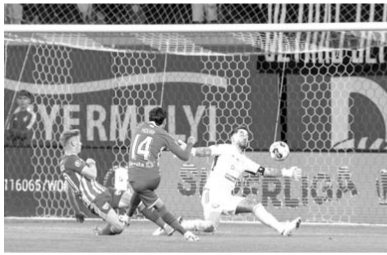
A CSU Craiova támadó középpályása, Houri megszerzi csapata harmadik gólját

Szünet után, ahogy várható volt, az OSK próbált kezdeményezni, de csupán Ciobotariuban láttuk azt a tüzet, ami eredménnyel kecsegtett volna. A támadások építésében nem