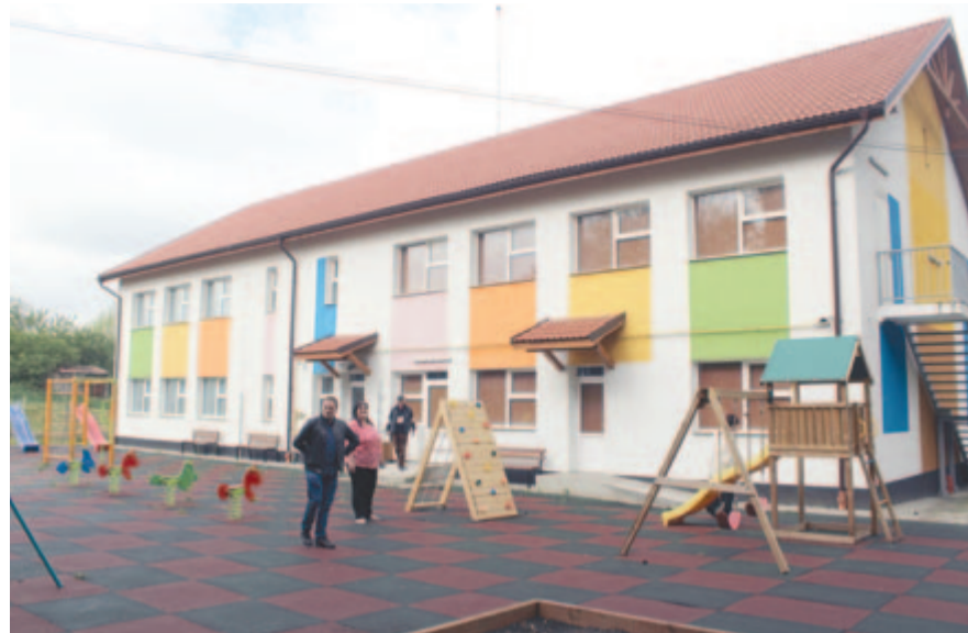
Játszóter az új óvoda mögött

Az Apafi Mihály Általános Iskola szomszédságában felépült új, korszerűen felszerelt, hosszított programú, 80 férőhelyes óvoda a romániai Közoktatás Minőségét Biztosító Ügynökségtől megkapta a működési engedélyt, így ősztől már az iskolahálózatba beleválva fogadhatja a gyermekeket.