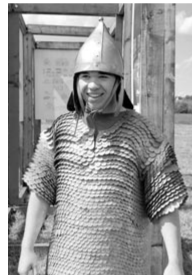
Igy nézhetett ki az itt állomásozó segédcsoport egy harcosa