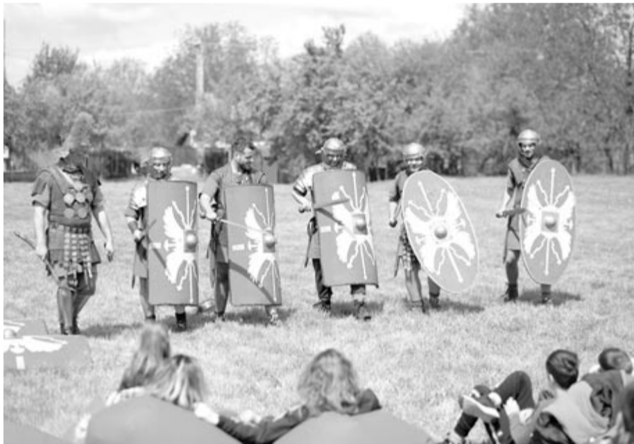
Római katonákkal ismerkedhettek az érdeklődők

A szombati rendezvényről nem hiányoztak az ókori római katonai hagyatékot őrző marosvásárhelyi Milites Marisensis egyesület „katonái” sem, akik római legionáriusokat és a segédcsoport harcosait