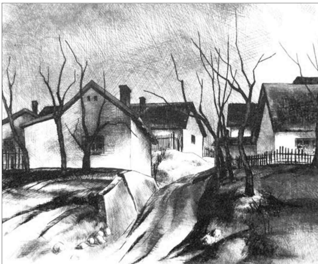
N. Surányi Mária: Tavaszi fények