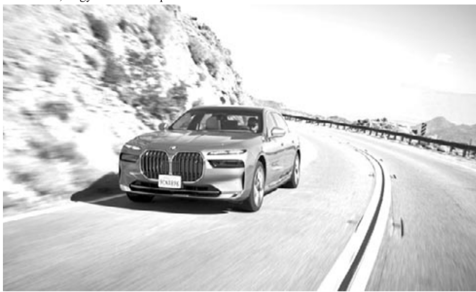
BMW i7, az elektromos luxus BMW, illusztráció

Ha a teljes képet nézzük, akkor viszont kijelenthető, hogy nagy meglepetés nincs. A villanyautók egyre jobbak, a töltőhálózat egyre bővül – még akkor is, ha az árak ilyen tekintetben is emelkednek –, a kínálat pedig a növekvő kereslettel arányosan nő. A BMW minden árszinten támad, vannak belépő elektromos modelljei – amilyen a Mini is –, érkeznek a luxuskiadások, van több elektromos SUV-je, illetve ott vannak a sportosabb modelljei is, M jelzéssel. Utóbbiakkal a cég arra számít, hogy kiemelkedő szereplői lesznek a sportvillanyautós érnak.