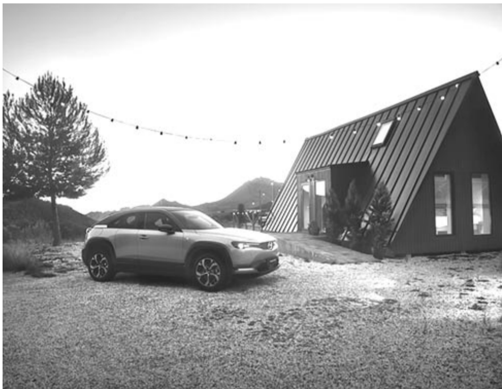
Mazda MX-30 e-Skyactiv R-EV

Az autóba szerelt kis méretű benzinmotor a hátsó tengely fölött lesz beépítve, és egy 50 literes tartályból fogja csipegetni az üzemanyagot. A belső égésű motorral való ráségítés eredményeképpen az autó hatótávja elérheti a 600 kilométert, legalábbis a Mazda szerint. De itt is érvényesül a nincs öröm üröm nélkül elve, vagyis valamit kapunk, de máshol veszítünk. Az eredeti Mazda MX-30 hatótávja 150 kilométer körül alakult a gyakorlatban, míg a hatótávnövelt változat mindössze 85 kilométert fog tudni menni, azt is WLTP szerint, ami a gyakorlatban 60 kilométer körüli adatot fog eredményezni. Az összesített fogyasztás értelmében a Mazda 1 liter/100 kilométeres adatot ad meg, amiben nyilván szerepet vállal az elektromos hajtás is. Továbbá minden bizonnyal ez csak az első 100 kilométerre vonatkozik, amelynek nagy részét a villanyhajtás végzi, azt követően nagy mértékben emelkedni fog a fogyasztás. Ezzel együtt egy elég kedvező szén-dioxid-kibocsátási adatot ér el az autó, 21g/km-t.