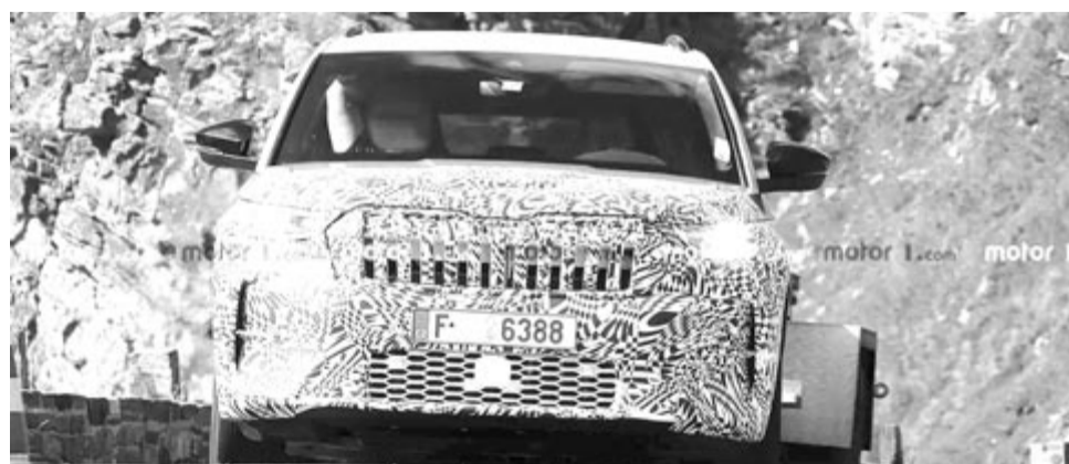
Az új Skoda Kodiaq álca alatt

A cég csupán annyit tett hozzá a bemutatáshoz, hogy a következő három évben három új elektromos autó bemutatását tervezi.