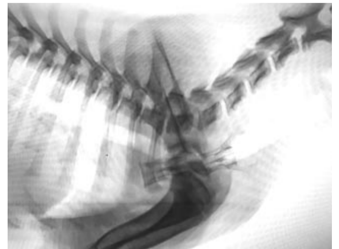
Röntgenfelvétel a nyelősövében elakadt csigolyacsontokról

A szakirodalom szerint a csont tele van esszenciális vitaminokkal, ásványi anyagokkal és aminosavakkal. Kiemelkedő a kalcium-, magnézium- és foszfortartalma, A-, D- és E-vitaminnal is bőven el van látva, illetve esszenciális zsírsavakat biztosít az eb számára. A porcsövet 50%-ban kollagént tartalmaz, ami segít megővni az eb csontjainak, porcainak, ízületeinek, inainak és inszalagjainak épségét. Mindez azonban helyettesíthető a megfelelő táplálékkiegészítővel. Aki mindenáron csontot adna a kutyájának, fontos tudnia, hogy csak akkor adjon, amit nem tud egészben lenyelni, így megelőzhető a fulladásveszély. A szakértők a kutya fejénél nem kisebb méretű csontokat ajánlják, ezek nem tudnak egészben lecsúszni a torkán. Ha pedig nem marad egyedül az állat a csonttal, a felelősségteljes gazdi látja, és ha baj van, azonnal intézkedik.