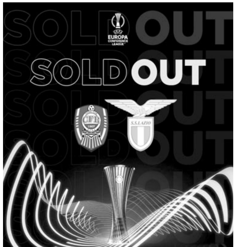
Telt ház lesz a Gépész utcában az Európa-konferencialigás mérkőzésen, adta hírül hétfőn a klub.

RTL Három: AS Roma – Salzburg (Európa-liga, 0-1).