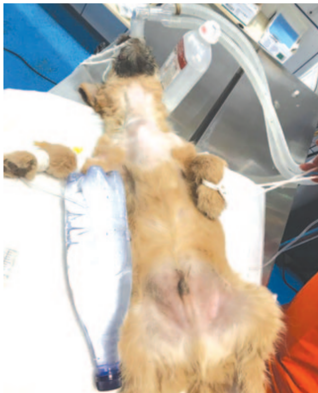
Műtét előtti oxigénbelélegeztetés

– Falu helyen manapság is elképzelhetetlen, hogy a csontokat ne a kutya elé tegyék, mintha a házörzök strapabíró-bak lennének. Mi határozza meg, hogy melyik állatnak adható szárnyas- vagy más állat csontja, és melyiknél életveszélyes? – kérdeztük a szakembert.