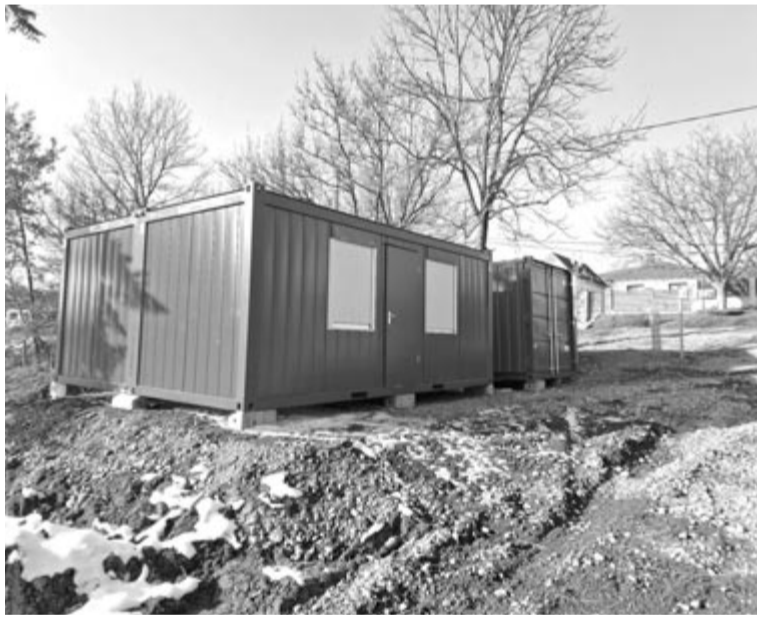
Munkatelep kialakítása Nyárádszentbenedeken

Ha ez a beruházás megvalósul, akkor következhet majd a jövőben a többi település ellátása is: Szentbenedekről gravitációval Harasztkerékre érkezik a víz, amit egy magas fekvő közterületre pumpálnak fel, ahonnan szabadesséssel ellátják a falut, és átviszik majd a vizet Harasztkerékről Vajába és onnan Göcsre. Itt az iskola mellett egy pumpaház épül, amely ellátja a települést, és egy vezetéken Szővérdre irányítja a vizet. Kisgörgény egy külön vezetékről jutna ivóvízhez a nyárádmenti fővezetékéről.